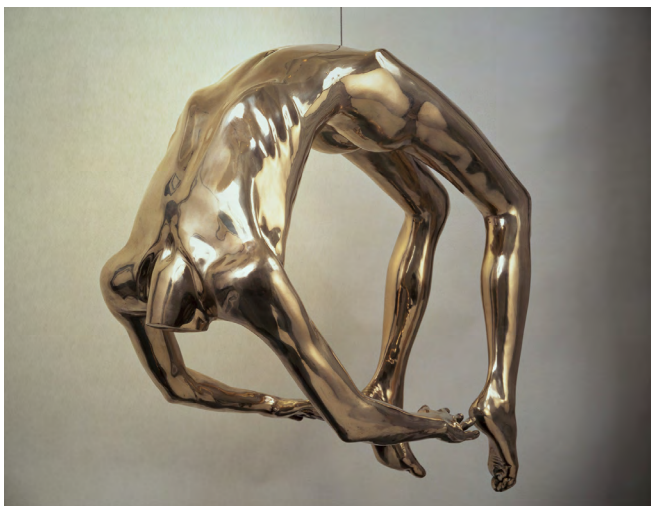
Илл. 2. Луиз Буржуа. Арка истерии. 1993. Бронза. Музей современного искусства, Нью-Йорк. https://www.moma.org/

Ж.-М. Шарко совершил революционный шаг, обозначив, что истерия — не болезнь матки, а психическое заболевание, связанное с подавленными нервными расстройствами и травмами,