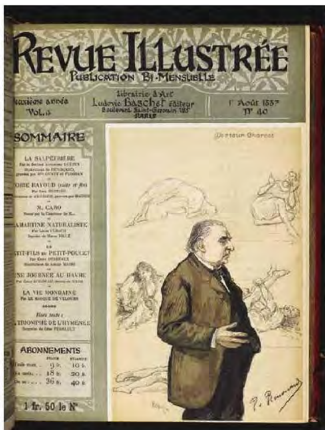
Илл. 4. Поль Ренуар. Доктор Шарко. 1887. Обложка журнала Revue illustrée . Британская библиотека, Лондон. https://www.bl.uk/

выражающимися посредством тела больного. Методы диагностики и лечения в больнице Сальпетриер были наглядными: доктор Шарко создал своего рода театр истерии, в котором больные под его «дирижирование» разыгрывали «акты» спектакля под названием истерия, совпадавшие с художественной классификацией истерических поз [12]. Кульминацией последовательности этих поз была истерическая арка, во время которой человек максимально выгибал спину, опираясь всем весом на голову и пятки, находясь в спазме, удерживающем изогнутое тело в нестабильном состоянии, едва позволяющем его запечатлеть.