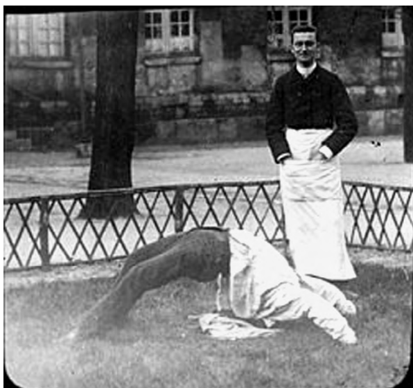
Илл. 9. Альбер Лонде. Истерическая арка. 1880-е гг. Хронофотография. Из журнала La Nouvelle Iconographie de la Salpêtrière . Национальная библиотека Франции, Париж. https://www.bnf.fr/fr