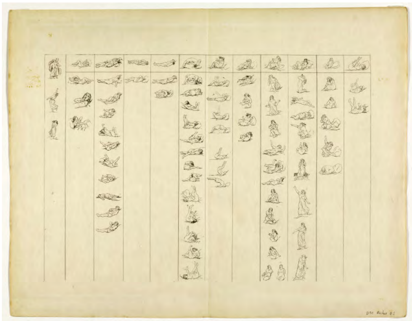
Илл. 3. Поль Рише. Синоптическая таблица большой истерической атаки. 1881. Иллюстрация из книги «Клинические исследования истеро-эпилепсии или большой истерии».