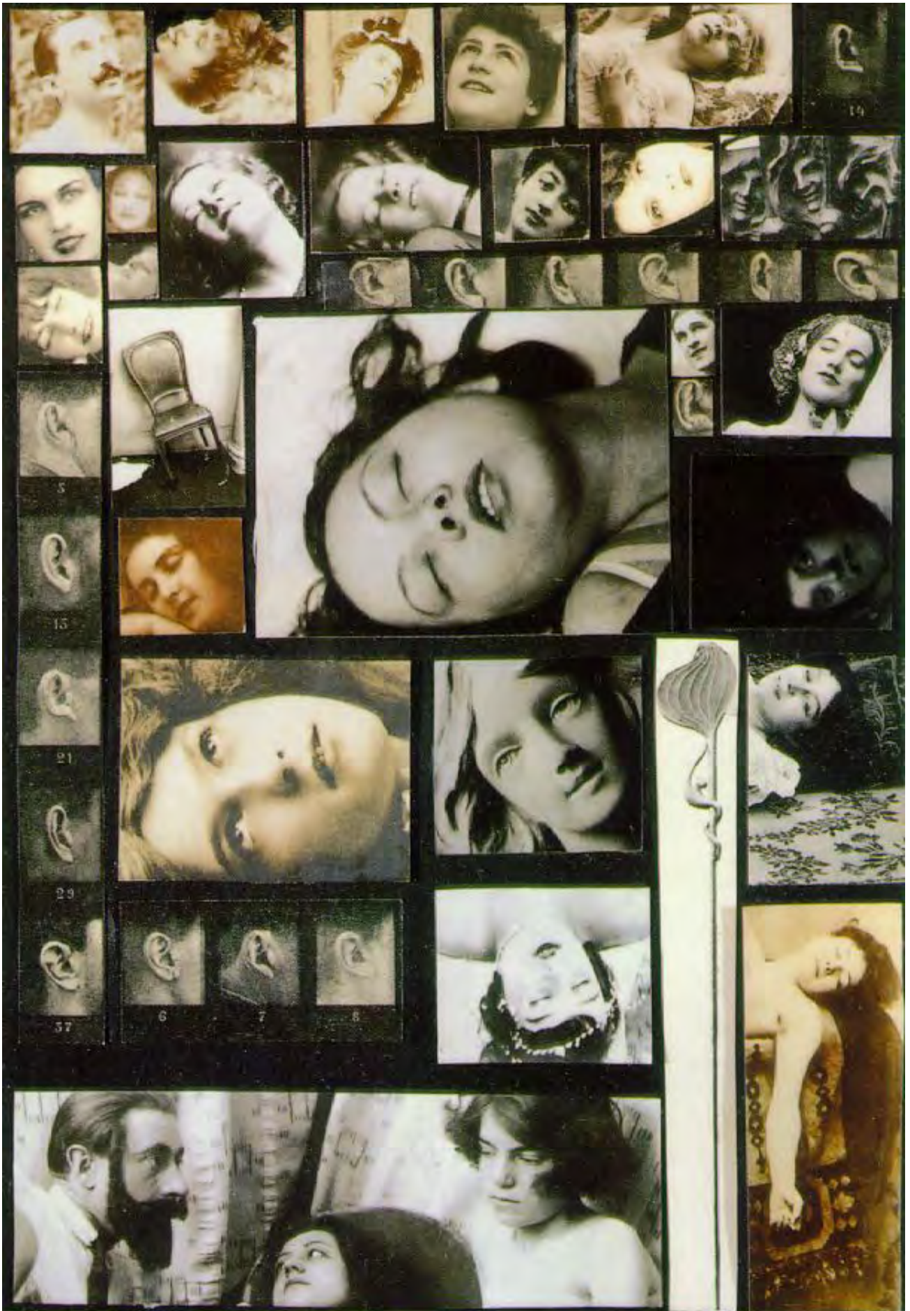
Илл. 7. Сальвадор Дали (совместно с Брассаем). Феномен экстаза. 1933. Фотоколлаж. Частное собрание