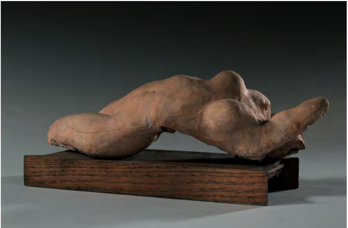
Илл. 5. Огюст Роден. Торс Адель. 1884. Терракота. Музей Родена, Париж. http://www.musee-rodin.fr/

Создание своего рода «алфавита» истерии совпадает с концепцией Мишеля Фуко о процессе эстетизации заболеваний и превращении ars erotica в scientia sexualis в XIX в., то есть конструировании диспозитива сексуальности [3, с. 153–155]. Подобный вуайеризм, активное распространение медицинских иллюстраций, а также театральные сеансы (демонстрации больных в больничном пространстве, имитировавшем сцену театра) Сальпетриер превращает истерию в социокультурный феномен второй половины XIX в. Актуализируя запретную для XIX в. тему болезни (с начала века активно пропагандировался культ здоровья) и создавая тем самым притягательный образ «инаковости», художественные репрезентации истерии проникают в визуальное искусство Франции: публикуются сатирические рисунки о докторе Шарко и его «алфавите» истерии (Илл. 4), Огюст Роден заимствует истерические позы для скульптур (особенно активно используя иконографию истерической дуги, к примеру, в «Коленопреклонном» или «Торсе Адель» (Илл. 5)), Фелисьен Ропе рисует своего рода архетипичные образы, связанные с этим заболеванием, а в некоторых журналах появляются рисунки, посвященные современной скульптуре, полностью состоящей из заимствования истерических поз (Илл. 6).