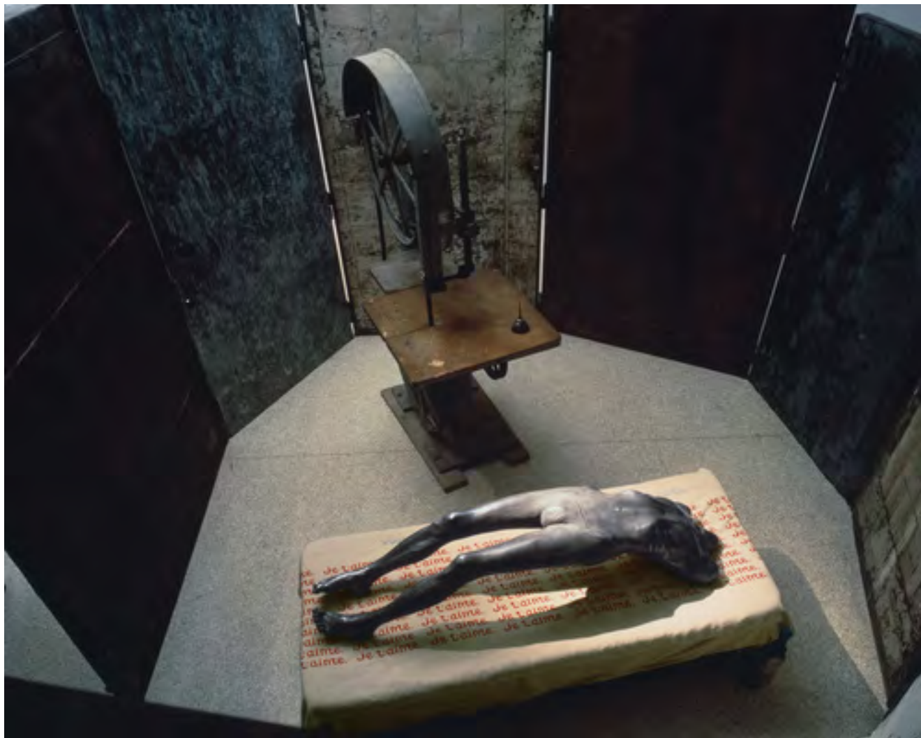
Илл. 1. Луиз Буржуа. Клетка (Арка истерии). 1992. Сталь, бронза, чугун и ткань. Музей современного искусства, Нью-Йорк. https://www.moma.org/

Стоит отметить, что большинство произведений Л. Буржуа окружены большим и постоянно растущим литературным массивом, порожденным как самой художницей, так и множеством критиков, стремящихся соприкоснуться с личностью Л. Буржуа и ее индивидуальной историей. Такой текстуальный фокус приводит к тому, что семь десятилетий карьеры Л. Буржуа те-