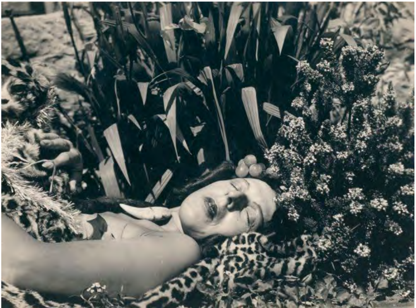
Илл. 8. Клод Каон. Автопортрет 95. 1939. Коллекция Jersey Heritage, Джерси. https://www.jerseyheritage.org/

Впервые Луиз Буржуа обращается к истерической арке в работе 1992 г. «Клетка» («Арка истерии»). Каждая из «Клеток» представляет собой уникальный мир, микросом какого-то явления, призванного восстановить прошлое или затронуть социальные стигмы, создавая благодаря своей структуре простор для вуайеристов, тем самым позволяя участвовать в процессе подглядывания. В «Клетке», посвященной истерии, Л. Буржуа репрезентует стигматизацию больных в лечебницах, продолжая идеи, изложенные в работах Мишеля Фуко о феномене клиники, не только воссоздавая утраченное явление, но и вписывая его в контекст движения феминизма. В пространство клетки Л. Буржуа помещает тело без рук и головы и некий громоздкий аппарат. Тело выгнуто в дуге на низкой кровати, на которой вышиты рядыми слова «Je t'aime», как строки, которые прописывают на школьной доске в наказание за содеянное.