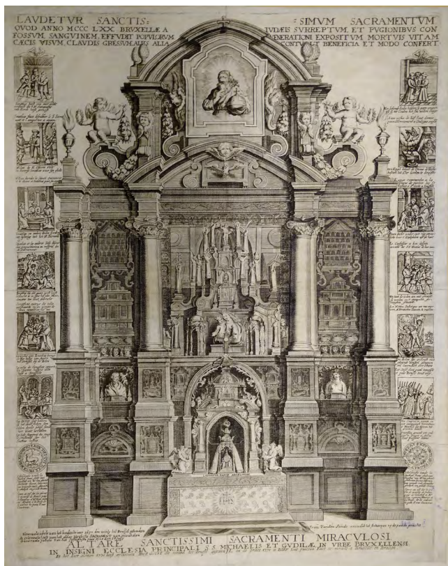
Илл. 3. Неизвестный гравер с гравюры Яна ван Санде. Алтарь Святого причастия в знаменитой церкви Св. Михаила и Гудулы в Брюсселе (Altare sanctissimi sacramenti miraculosi in insigni ecclesia S. S. Michaelis et Gudilae in urbe bruxellensi). 1720-е. Гравюра на меди. Российская национальная библиотека, Санкт-Петербург

проспекты с изображением того или иного известного места с кратким разъяснением истории этого памятника.