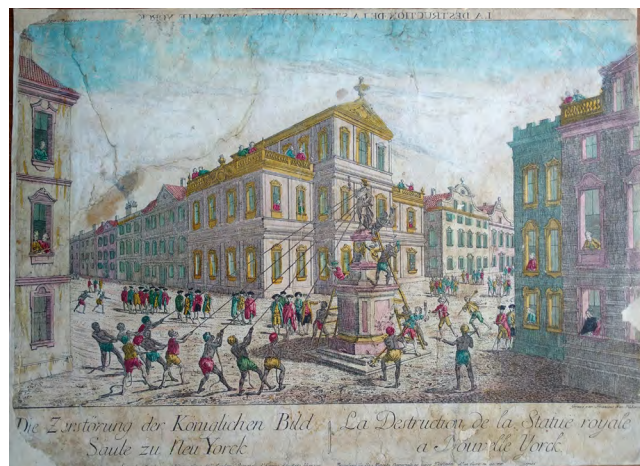
Илл. 5. Франц Ксавье Хаберманн. Разрушение статуи короля Георга III в Нью-Йорке (Die Zerstörung der königlichen Bild Säule zu Neu York). 1780-е. Гравюра на меди, акварель. Российская национальная библиотека, Санкт-Петербург

Можно также выделить несколько специфических теоретических акцентов, связанных с появлением скульптуры в гравюре барокко. Во-первых, это проблема религиозной пропаганды как части политической повестки дня, что столь часто актуализировало тот или иной пластический образ; во-вторых, особенности восприятия самой скульптуры как некоего иллюзорного предмета и в гравюре, и в реальной жизни; и, наконец, в-третьих, тиражирование образов. Последний пункт касается скульптуры особенно сильно, ведь она воспроизводилась на протяжении двух с лишним веков в огромных количествах — в действительности (в дереве, камне или металле) и в гравированном виде.