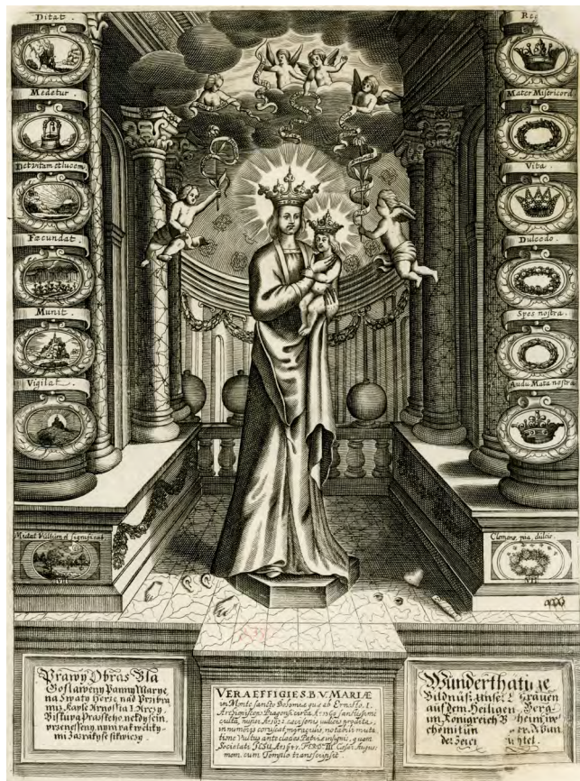
Илл. 2. Неизвестный гравер. Правильное изображение Пресвятой Богородицы... (Prawy Obras Blagoslaweny Panny Marie...). 1650-е. Гравюра на меди. Российская национальная библиотека, Санкт-Петербург

Чуть ближе к строго архитектурной графике, однако всё же в традициях массового искусства Нового времени, находятся изображения алтарей из разных католических храмов Европы. Такие гравюры выступали как своеобразные «туристические»