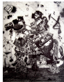
Илл. 1. С. Светоченков. Рыцарь смерть и дьявол. 1999. Гравюра на металле. Частная коллекция. http://www.artstas.spb.ru/

Архитектурное образование сформировало в Стасе Светоченкове крепкого графика. Технику офорта он изучал в мастерской Германа Пахаревского. Светоченков создал ряд графических работ по мифологическим и библейским сюжетам, дополненных