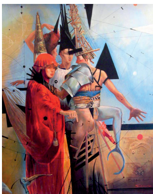
Илл. 2. С. Светоченков. Три философа. 2005. Холст, масло. Частная коллекция. http://www.artstas.spb.ru/

в мастерской стоит масло “Европа на золотом быке”. Идея универсальна, она существует сама по себе и в разное время проявляется в каком-то другом материале. А техника — всего лишь техника. Люди сейчас даже из бумаги делают голову Лаокоона 3 .