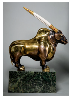
Илл. 4. С. Светоченков. Золотой бык. 2006. Бронза, мамонтовая кость, рубины, сапфиры. Частная коллекция. http://www.artstas.spb.ru/

сообщает уверенная поза Европы. Девушка стоит спиной к зрителю, ноги широко расставлены, гордая осанка, красный плащ в ее руках. Бык находится на втором плане, занимая основное пространство картинного поля. Он в статичной позе, а взгляд направлен на зрителя, в нем чувствуется уверенность и спокойствие. Он отличается высокой степенью декоративности — его шкура покрыта золотой росписью, а голову увенчивают элегантные стилизованные рога. Композиция образует треугольник и решена в красно-сине-желтых тонах, что является приемом классицистической живописи. Лазурный синий цвет на дальнем плане усиливает декоративный эффект, подчеркивая игру золота. Вероятно, декоративность обусловлена тем, что Светоченков в этот период разрабатывал скульптуру «Золотой бык» (Илл. 4) (2006 г., частная коллекция). Художник упоминал о том, что идея существует сама по себе, принимая различные формы: живопись маслом, акварель, графика или же скульптура. Небольшой бронзовый бык с рогами из мамонтовой кости, инкрустированный рубинами и сапфирами — еще одна вариация на тему мифологического сюжета.