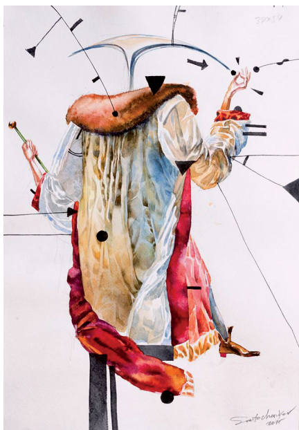
Илл. 6. С. Светоченков. Исследователь. 2015. Бумага, акварель. Частная коллекция.

рук. В своей работе он выбирает иной возраст для персонажей. Главная героиня предстает перед нами в виде зрелой женщины, с холодным, отрешенным выражением лица. По словам художника, это оригинальное решение продиктовано поиском природы: «Даная была малазийской царицей, и я искал соответствующий типаж. Для своей работы я нашел натурщицу-персиянку, поэтому получился такой результат» 4 .