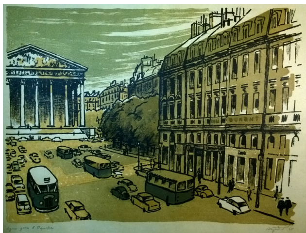
Илл. 5. В.Я. Бродский. Один день в Париже, 1965 г., литография, 40×50.