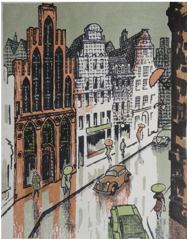
Илл. 4. В.Я. Бродский. Дождь в Ростке, 1966 г., цветная литография, 51×40.