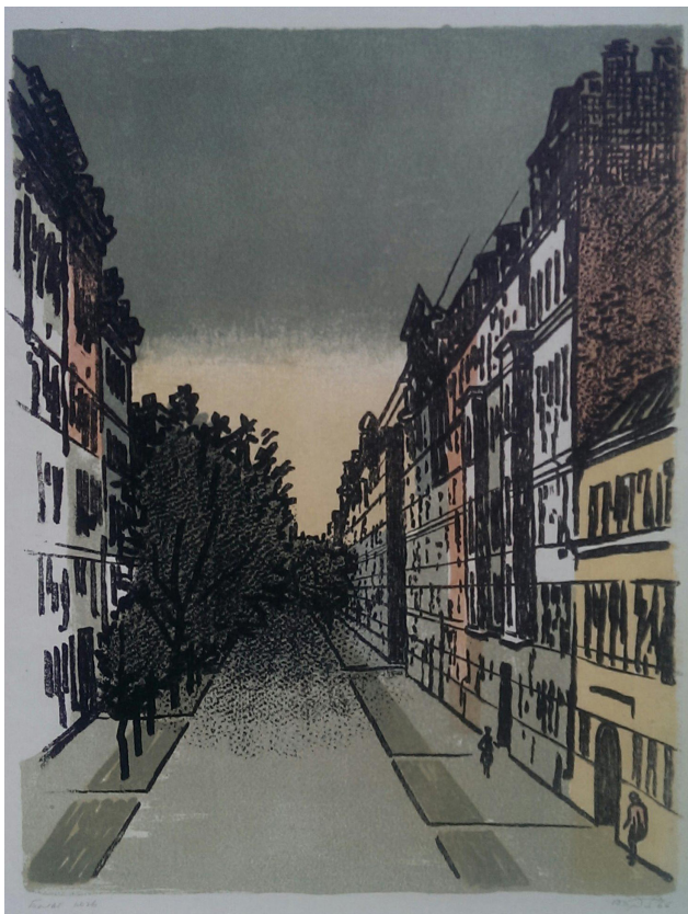
Илл. 10. В.Я. Бродский. Белая ночь. Васильевский остров, 1966 г., цветная литография, 42×32.