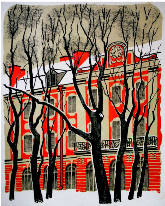
Илл. 9. В.Я. Бродский. Двенадцать коллегий, 1969 г., цветная литография, 31×47.