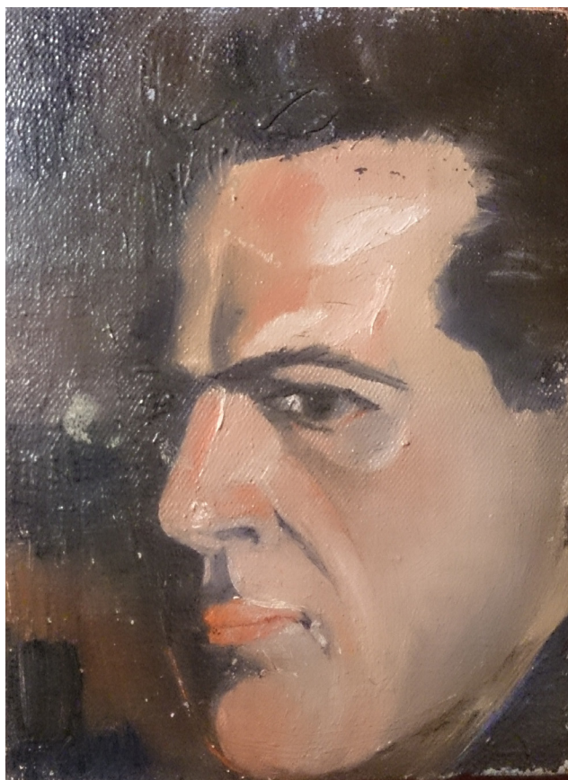
Илл. 3. В.Я. Бродский. Автопортрет, х., м., 1930-е гг. Архив семьи В.Я. Бродского.

ский начал читать спецкурс по творчеству А.А. Иванова. Можно предположить, что Бродский очень любил творчество Иванова. Так, несколько ранее, в протоколе заседания кафедры истории русского искусства от 7 октября 1947 г. во время обсуждения главы докторской диссертации проф. Пунина «Жанр А.А. Иванова», Бродский отмечал, что в докладе диссертанта «мало анализа творчества самого Иванова, перегрузка параллелями и нет связи с ходом исторической жизни, с общественной средой» 6 .