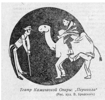
Илл. 6. В.Я. Бродский. Спектакль «Перикола» в Театре Комической Оперы, из рецензии в журнале «Рабочий и театр», 1929 г.

преподавательского состава, который прекрасно разбирался в живописных направлениях современного капиталистического искусства. Похоже, что его авторитет на этапе 1950-х и 1960-х гг. был непререкаем, что подтверждает, например, опубликованная статья «Сущность абстракционизма» [7], вышедшая после знаменитого разгрома Н.С. Хрущевым выставки в московском «Манеже», а также подготовленная лекция «Путешествие в пустоту» (31.03.1963), проведенная им по телевидению 9 .