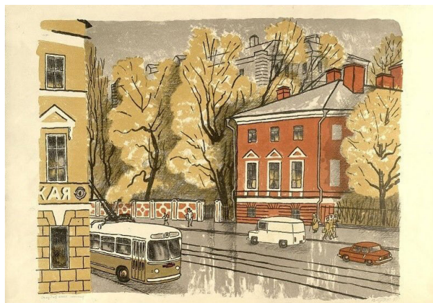
Илл. 11. В.Я. Бродский. Съездовская линия, 1969 г., цветная литография, 10×14.

вился талант Бродского-критика. В книге он открывает новые имена художников, показывает их работы, с профессионализмом разбирает батальные марины и увлекательно пишет о многочисленных водных пространствах нашей Родины.