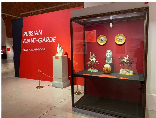
Илл. 1. Фарфор периода правления Николая II. Выставка «Русский авангард. Искусство для нового мира», Государственный Эрмитаж.