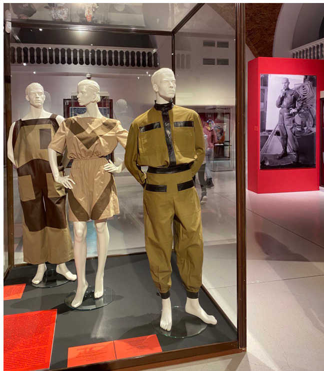
Илл. 4. Реконструкция костюмов по проектам Александра Родченко и Варвары Степановой. Выставка «Русский авангард. Искусство для нового мира», Государственный Эрмитаж.