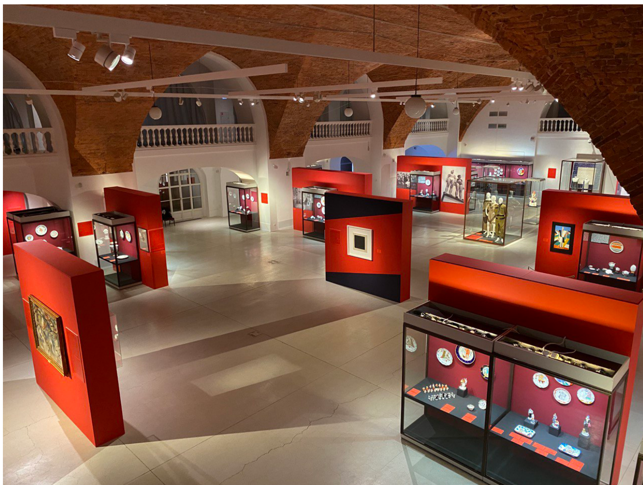
Илл. 2. Выставка «Русский авангард. Искусство для нового мира», Государственный Эрмитаж.