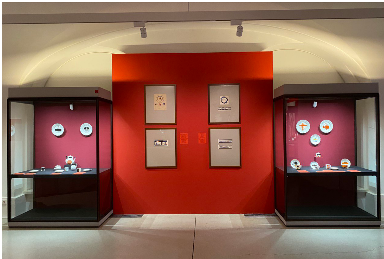
Илл. 3. Супрематический фарфор Николая Суетина. 1923–1924. Выставка «Русский авангард. Искусство для нового мира», Государственный Эрмитаж.