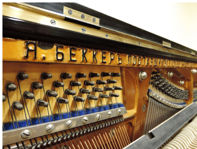
Илл. 4. Пианино из Кабинета Николая II в Зимнем дворце в процессе реставрации. Фотография автора, 2022. Государственный Эрмитаж, Санкт-Петербург