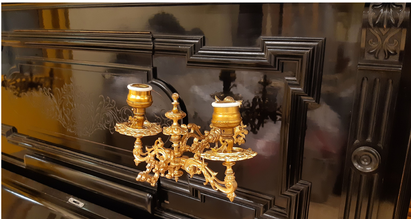
Илл. 6. Пианино из Кабинета Николая II в Зимнем дворце в процессе реставрации. Деталь передней крышки. Фотография автора, 2022. Государственный Эрмитаж, Санкт-Петербург

Как указано в документе, ещё два инструмента “Becker” находились в личных комнатах императора Николая II и его супруги Александры Фёдоровны.