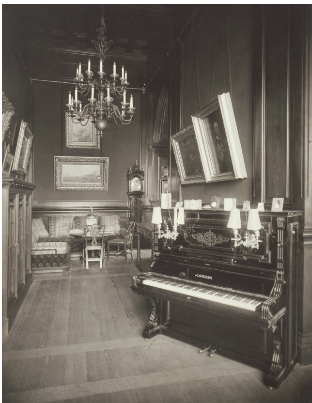
Илл. 7. Вид Кабинета Николая II в Зимнем дворце. Фотография К. К. Кубеша, 1917. Государственный Эрмитаж, Санкт-Петербург

Кабинета Николая II, вероятно, не удалось продать на аукционах, и оно было оставлено в стенах музея для выполнения утилитарной функции. А со временем пианино оказалось в Школьном центре Государственного Эрмитажа, где десятилетиями исправно служило преподавателям и ученикам.