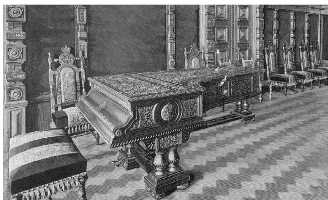
Илл. 2. Рояль фабрики «Беккер» в Гостиной внутри Императорского (Царского) павильона на Всероссийской промышленной и художественной выставке 1896 г. в Нижнем Новгороде. Журнал «Всемирная иллюстрация». 1896. № 1445. С. 371