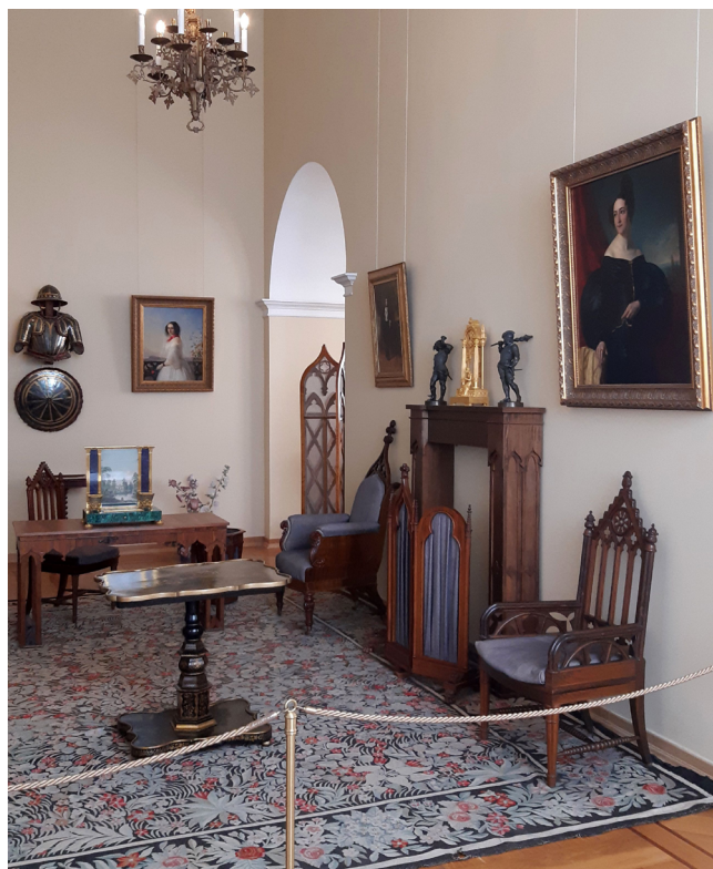
Илл. 8. Вид зала № 182, бывшего Кабинета Николая II. Государственный Эрмитаж, Санкт-Петербург

Таким образом, сам факт того, что до нашего времени в стенах Государственного Эрмитажа сохранилось несколько фортепиано из комнат Николая II (пианино “Becker” и рояль “Shroeder” из Серебряной гостиной), следует расценивать как исключительный случай. Ничем не примечательное, кроме своего происхождения, пианино “Becker” из