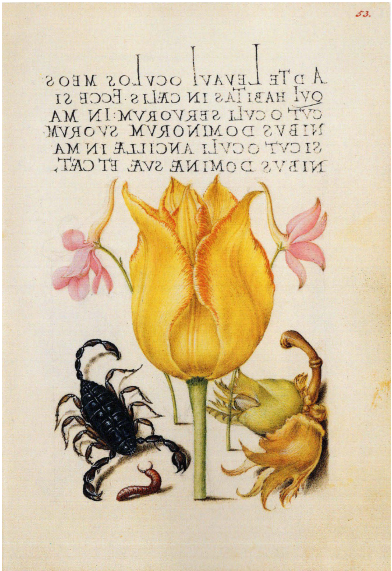
Илл. 4. Йорис Хуфнагел. Скорпион, тюльпан, лесной орех. Образцовая книга каллиграфии, f. 53. 1590–1596. Пергамен, акварель. 16,6 x 12,4 см. Ms. 20 (86.MV.527). Музей Пола Гетти, Лос-Анджелес