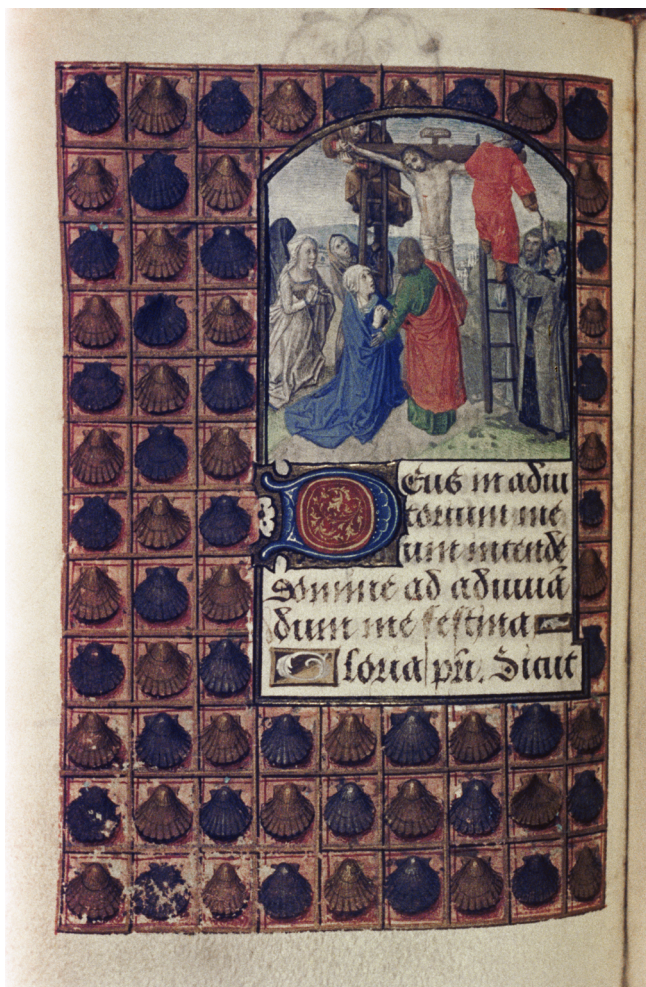
Илл. 3. Часослов Энгельберта II Нассауского, f. 084v. Мастер Марии Бургундской. 1470–1490. MSS. Douce 219-20. Бодлианская библиотека, Оксфорд

Но основные источники сюжетов личных духовных переживаний были связаны с путешествием ко святым местам: почетным и обязательным делом для праведного христианина. Средневековые пилигримы прикрепляли к шляпе раковину моллюска — так называемый гребешок святого Иакова — как свидетельство своего паломничества, а также использовали его в качестве дорожной посуды. Зачастую по возвращении домой христиане прикрепляли раковину к стене своего дома в знак совершенного хождения к святым местам. Сохранились молитвенники первой половины XIV в., где на страницах видны следы крепления сувениров, привезенных