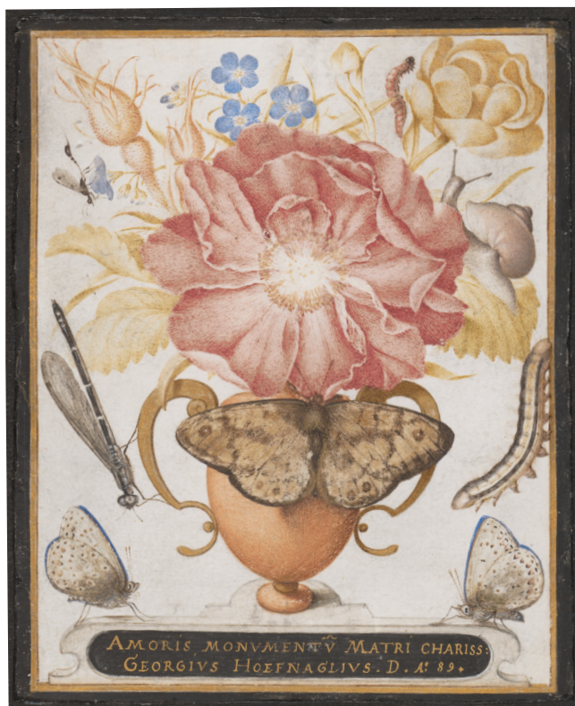
Илл. 10. Йорис Хуфнагел. Натюрморт. 1589. Акварель, гуашь, пергамен. 11,7 × 9,3 см. Музей Метрополитен, Нью-Йорк

книгами для автографов друзей 27 , где сбор записей, личных впечатлений, путевых заметок, поэзии и цитат чередуется с изображениями [16, р. 60]. Несмотря на то, что Хуфнагел во многом продолжает формальные приемы мастеров иллюминированных книг, наследуя прием иллюзий, обманок, его иллюстрации несут светские, развлекательные, интеллектуальные или естественнонаучные смыслы.