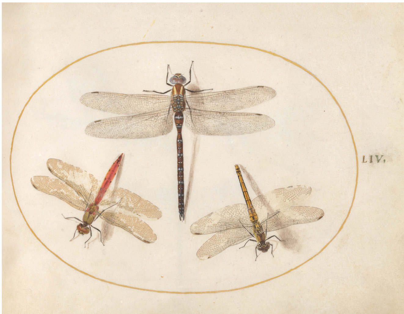
Илл. 8. Йорис Хуфнагел. Серия «Четыре стихии». Animalia rationalia et insecta (Ignis) , vol. 1, pi. LIV. 1575/1580. Акварель, гуашь, пергамен, 14,3 x 18,4 см. Национальная галерея искусства, Вашингтон