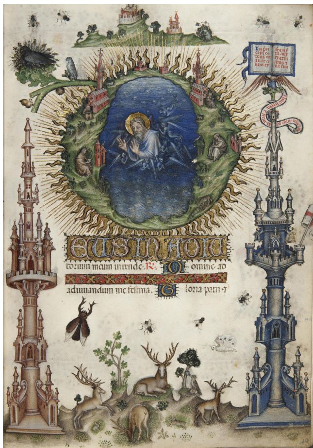
Илл. 6. Часослов Джана Галиаццо Висконти, ф. 19. Национальная библиотека Флоренции. Banco Rari 397 and Landau-Finally 22