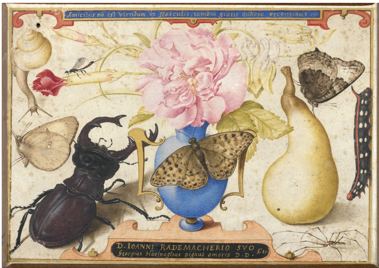
Илл. 9. Йорис Хуфнагел. Натюрморт. 1589. Акварель, бумага, дерево. 11, 8 × 16,3 см. Музей Зеландии, Мидделбург