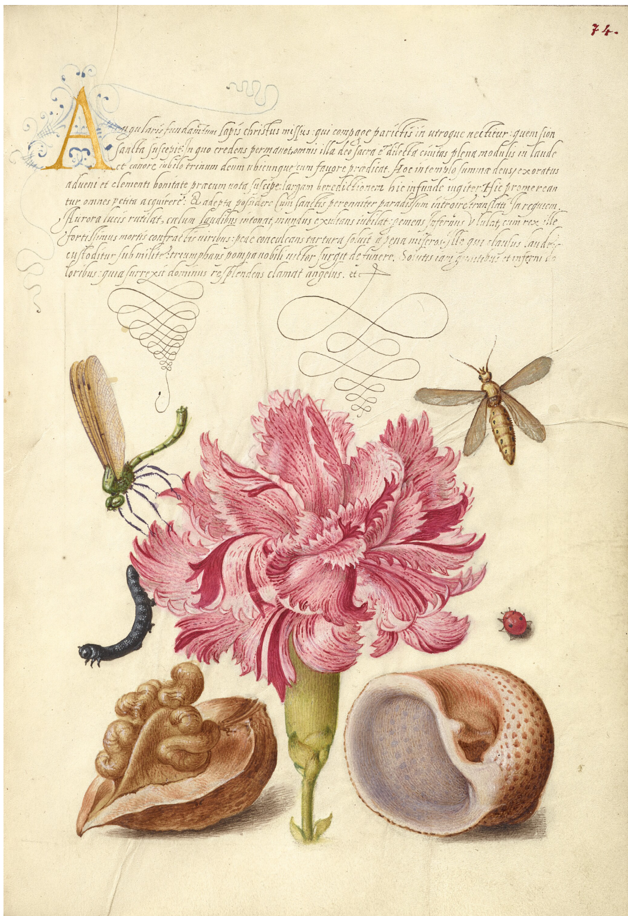
Илл. 5. Йорис Хуфнагел. Стрекоза, гвоздика, гусеница, божья коровка, орех и раковина моллюска. Образцовая книга каллиграфии, ф. 74. 1590–1596. Пергамент, акварель. 16, 6 x 12,4 см. Ms. 20 (86.MV.527). Музей Пола Гетти, Лос-Анджелес