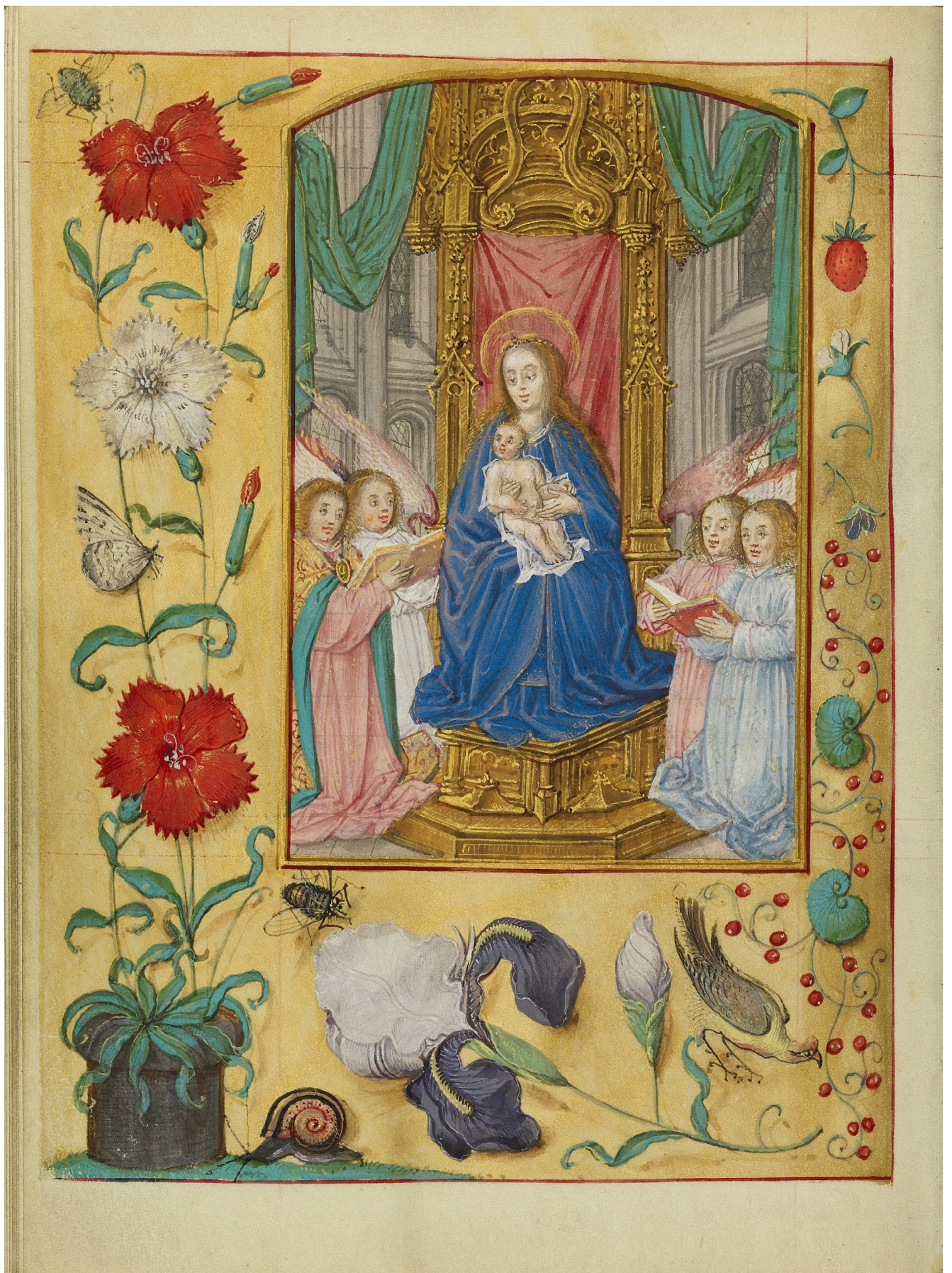
Илл. 2. Часослов, ф. 105v. Мастер Герард Хоренбот. 1500-е. 15, 2 x 11, 1 см. Ms. Ludwig IX 17 (83. ML.113). Музей Пола Гетти, Лос-Анджелес