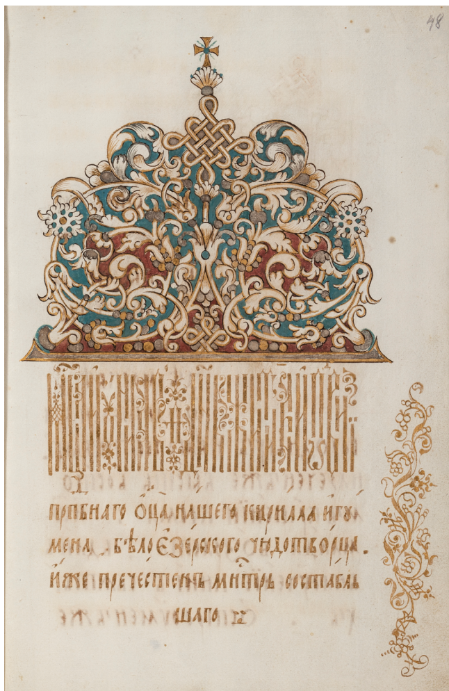
Илл. 1. Начало текста Жития преп. Кирилла Белозерского. Золото, чернила. Первая строка названия — вязь. Заставка старопечатного типа. Служба и житие преп. Кирилла Белозерского. 1720. БАН, П I Б 85, л. 48. Библиотека Российской академии наук, Санкт-Петербург