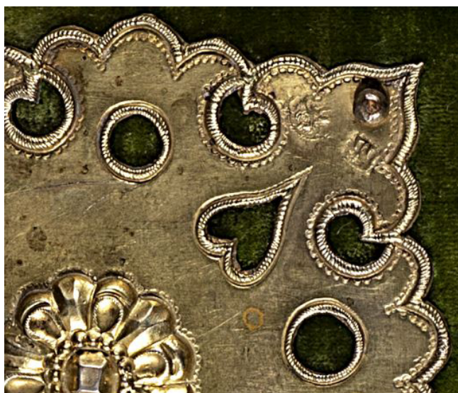
Илл. 4. Верхняя крышка переплета. Бархат, металлические накладные средник и 4 наугольника. Служба и житие преп. Кирилла Белозерского. 1720. БАН, П I Б 85