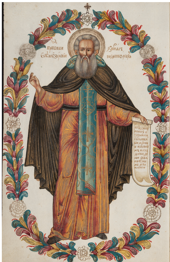
Илл. 2. Преп. Кирилл Белозерский. Миниатюра. Клеевые краски, золото. Служба и житие преп. Кирилла Белозерского. 1720. БАН, П I Б 85, л. 46 об.