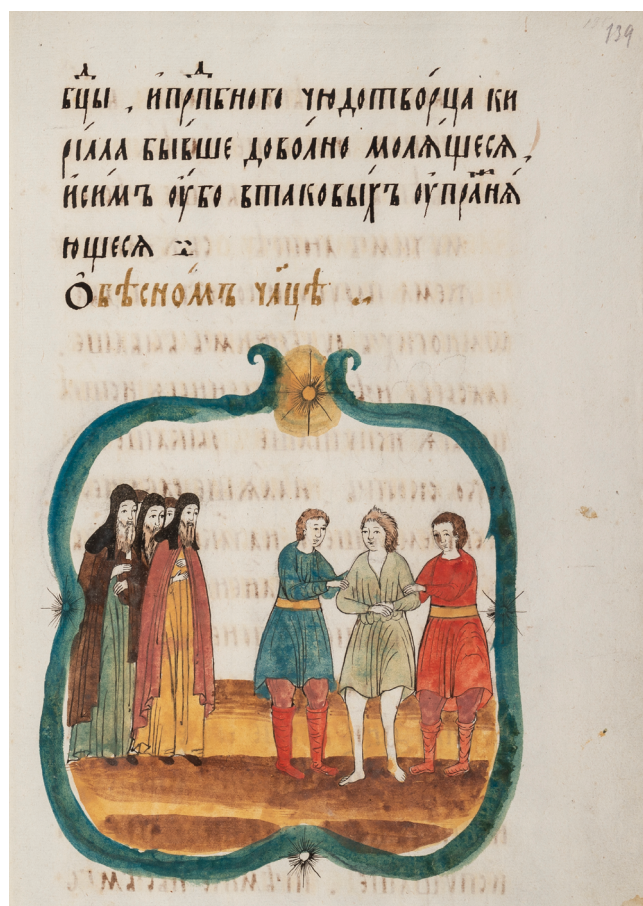
Илл. 3. Излечение бесноватого. Миниатюра. Клеевые краски. Служба и житие преп. Кирилла Белозерского. 1720. БАН, П I Б 85, л. 139

не были особо изысканно оформлены. Относящиеся к первым — более традиционны для средневековой книжной культуры и разнообразно украшены. Среди них есть несколько лицевых рукописей, три из которых — Сборник житийный, лицевой (БАН П I А № 34. XVI в. (60-е гг.) 380 мин.), Звезда Пресветлая, с дополнениями, лицевая (П I А № 58, 263 мин.) и Житие прп. Сергия Радонежского, лицевое (БАН П I А № 38. XVII в. (кон.) 468 мин.) — включают по несколько сотен миниатюр. К этой группе примыкает интересующая нас рукопись из преподнесенных непосредственно Петру I — Житие и служба прп. Кирилла Белозерского (БАН П I Б № 85 [2, 201–203] 2 36 мин.), выполненная по традиционным канонам иллюминирования рукописных средневековых книг.