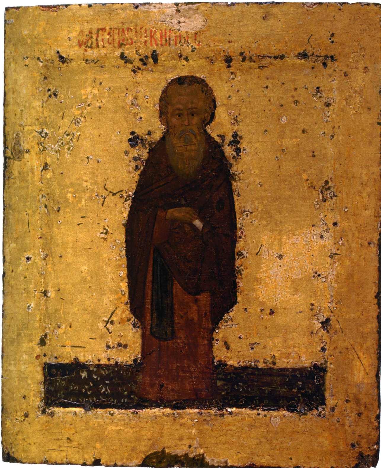
Илл. 8. Прп. Кирилл Белозерский. Дионисий Глушицкий. 1424. Опубликовано в: Кирилл Белозерский и памятники с редкой иконографией: Материалы конференции. Каталог выставки 22 июня – 15 августа 2017. Кириллов, 2018

Гравированная датированная запись на окладе начинается словами «Сия книга была сочинена в Кирилове монастыре...». Это достаточно достоверно свидетельствует о том, что рукопись была составлена, т. е. написана, украшена и проиллюстрирована в самой Кирилловской обители. Есть