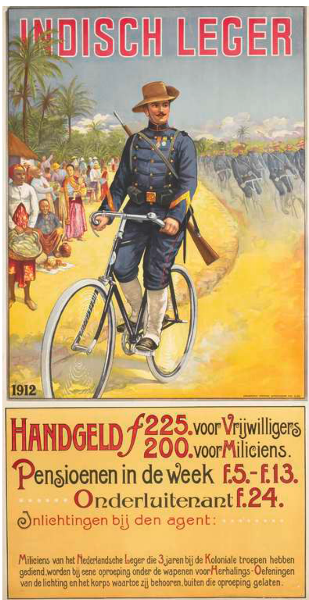
Илл. 2. Плакат с надписью «Армия Нидерландской Индии. Жалование 225 гульденов для добровольцев, 200 для военнообязанных. Пенсия 5–13 гульденов в неделю, для младших лейтенантов — 24 гульдена. Информацию о службе можно получить у агента...». 1912

Вскоре в Нидерландскую Индию (современную Индонезию) хлынул поток товаров, которые раньше были недоступны местным жителям: велосипеды, бритвы, пиво, консервы и т. д. Импорт положил начало развитию рекламы [4, р. 2], и количество рекламных агентств быстро росло [4, р. 2–3]. В Индонезию устремилось большое число молодых голландских художников, зародивших в колонии искусство рекламного плаката [4, р. 17]. Создатели рекламы ориентировались на яркий образ, чтобы его могли с легкостью понять как грамотные, так и безграмотные жители (которых было больше 50%) [4, р. 6]. Поэтому умение «читать» образы плакатов с опорой на доступные нам исторические сведения является основным методом исследования как рекламных, так и военных плакатов Нидерландской Индии.