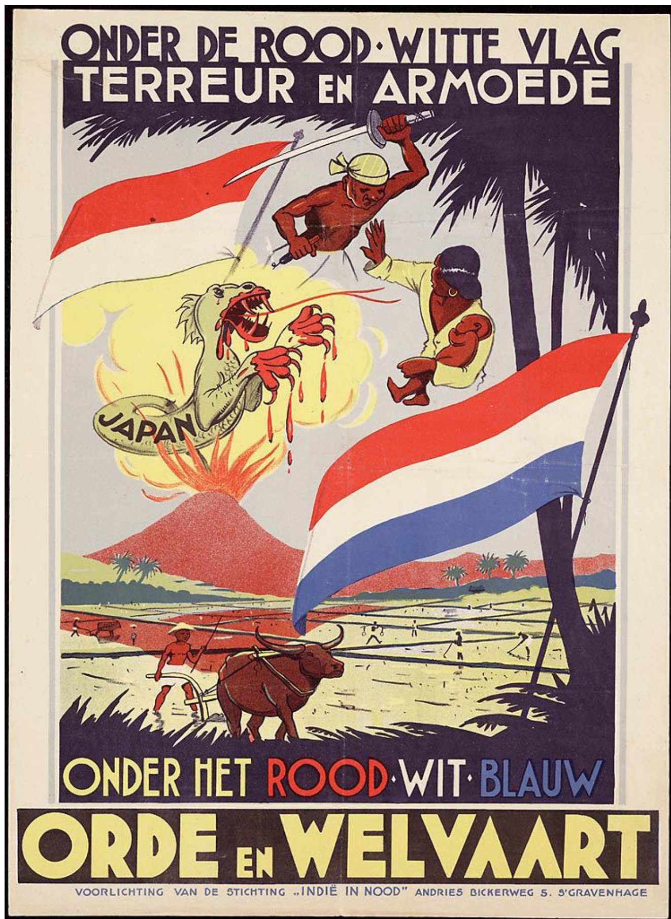
Илл. 9. Плакат с надписью «Под красно-белым флагом — террор и бедность. Под красно-бело-синим — порядок и процветание»