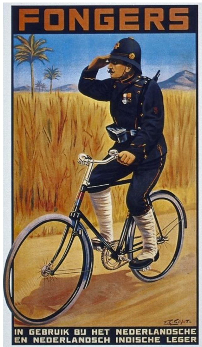
Илл. 3. Плакат с надписью «Фонерс. На службе у Армии Нидерландов и Армии Нидерландской Индии»

Наблюдая за успехом развития рекламы товаров среди гражданского населения, военные из Королевской армии Нидерландской Индии (КНИЛ) позаимствовали ее практику. В 1910–1940-х гг. по заказу армии появилось несколько плакатов, которые должны были показать КНИЛ защитницей Нидерландской Индии, а также с помощью ярких образов демонстрировали жителям колонии преимущества военной службы.