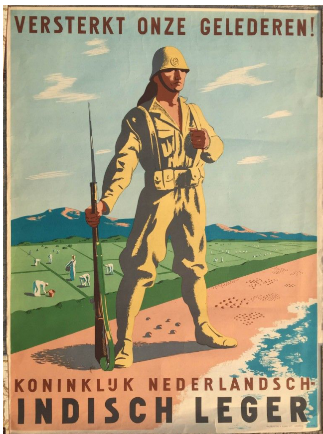
Илл. 4. Плакат с надписью «Укрепим наши Ряды! Королевская армия Нидерландской Индии»

лечение. Был доступен ограниченный, но все же карьерный рост, а по выходу в отставку полагалась пенсия [2, с. 22–23]. Более того, в Индонезии еще со времен первых индунизированных царств военнослужащие попадали в почетную касту кшатриев, что поднимало человека в иерархии традиционного общества [2, с. 20]. Отмечу, что такая черта характерна и для современной армии Индонезии.