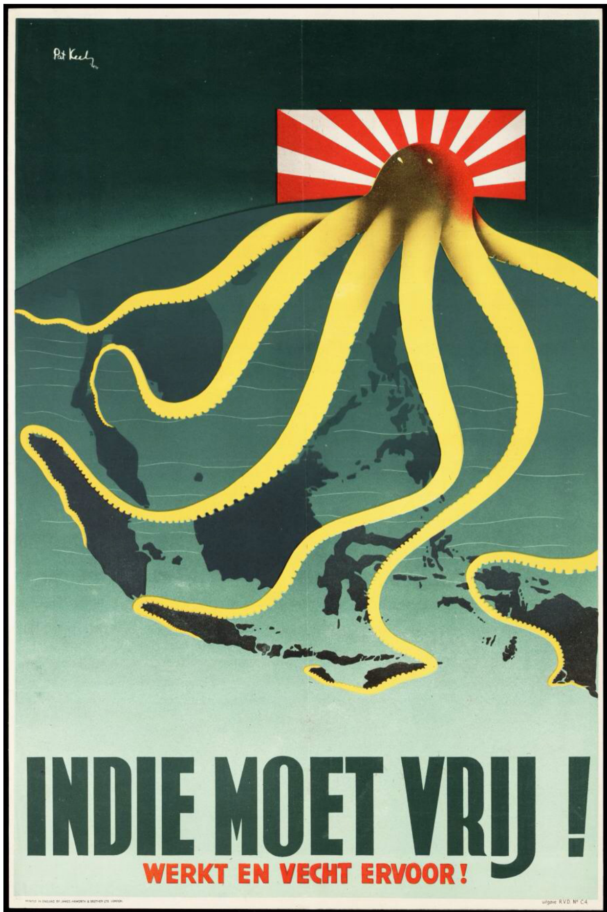
Илл. 7. Плакат с надписью «Нидерландская Индия должна быть освобождена! Работайте и сражайтесь за это!»