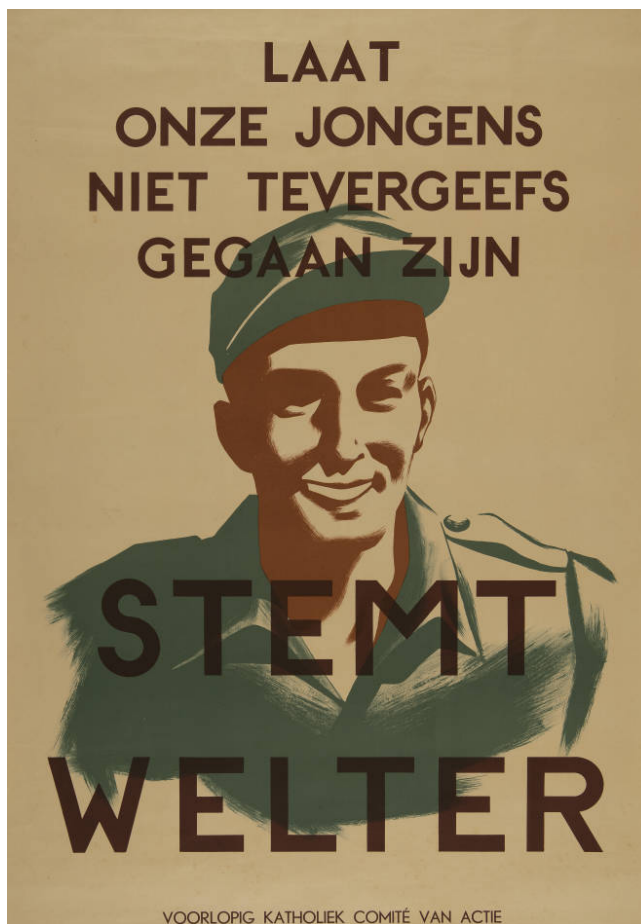
Илл. 8. Плакат с надписью «Не дайте нашим парням погибнуть напрасно. Голосуйте за Вельтера. Католический Комитет Действия»

Напоследок стоит отдельно остановиться на образе Японии, которая на данном плакате представлена в виде дракона. Мне представляется, что это вовсе не дракон из восточноазиатского фольклора, а змей из индонезийской мифологии под названием «нага» ( индонез. naga ) 3 , который почти