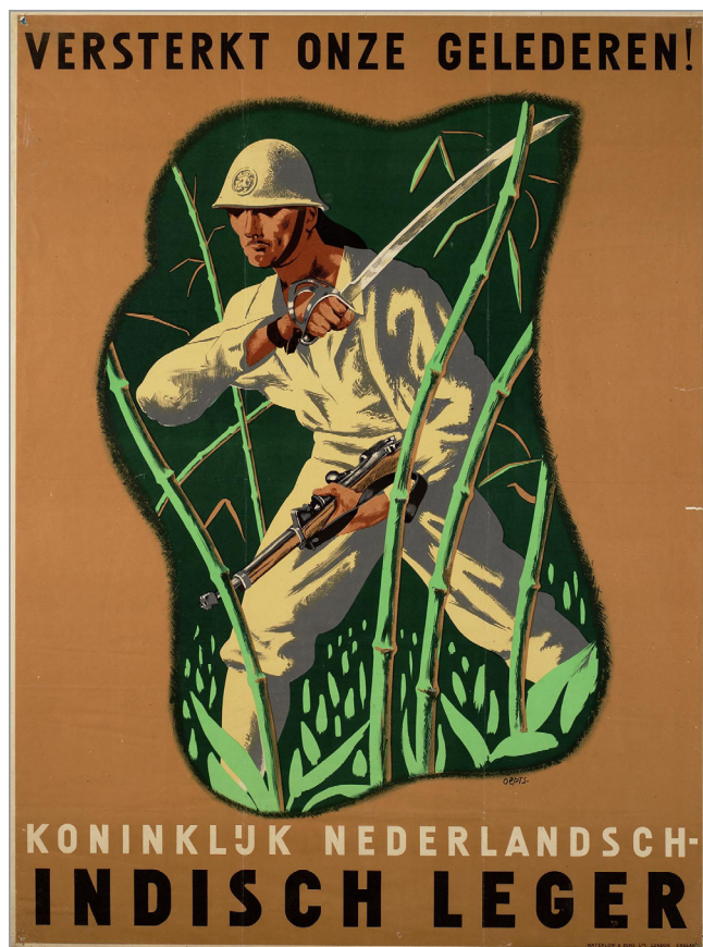
Илл. 5. Плакат с надписью «Укрепим наши Ряды! Королевская армия Нидерландской Индии»

После захвата Японией Индонезии в 1942 г. нидерландские военные плакаты были заменены японскими, которые призывали вступать уже в японские вспомогательные вооруженные формирования. Однако даже в период войны