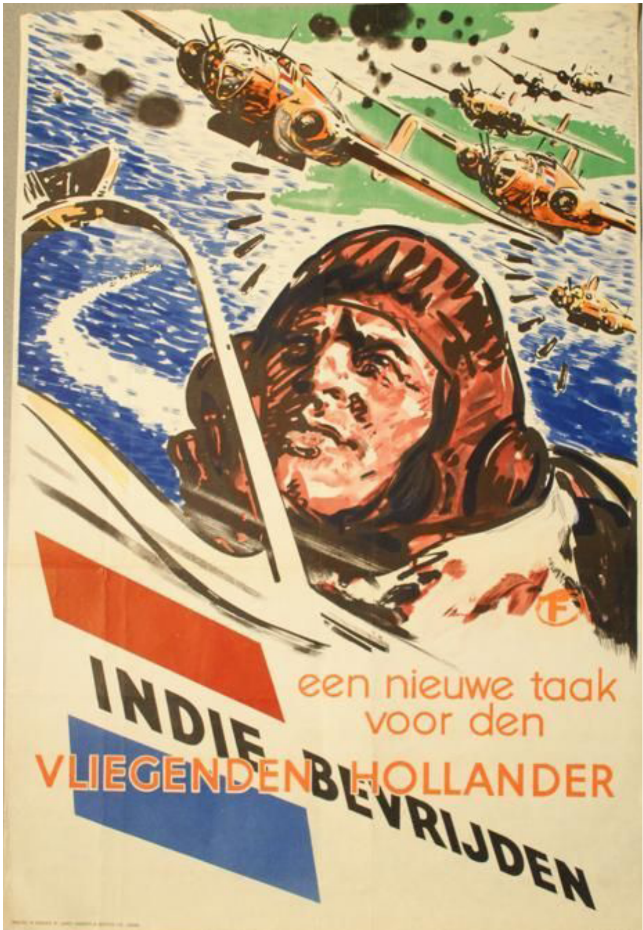
Илл. 6. Плакат с надписью «Новая задача для Летучего Голландца — освободить Нидерландскую Индию»