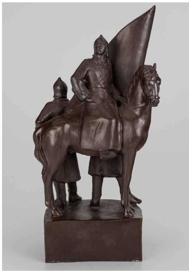
Илл. 4б. Скульптурная композиция «Красноармейская группа»