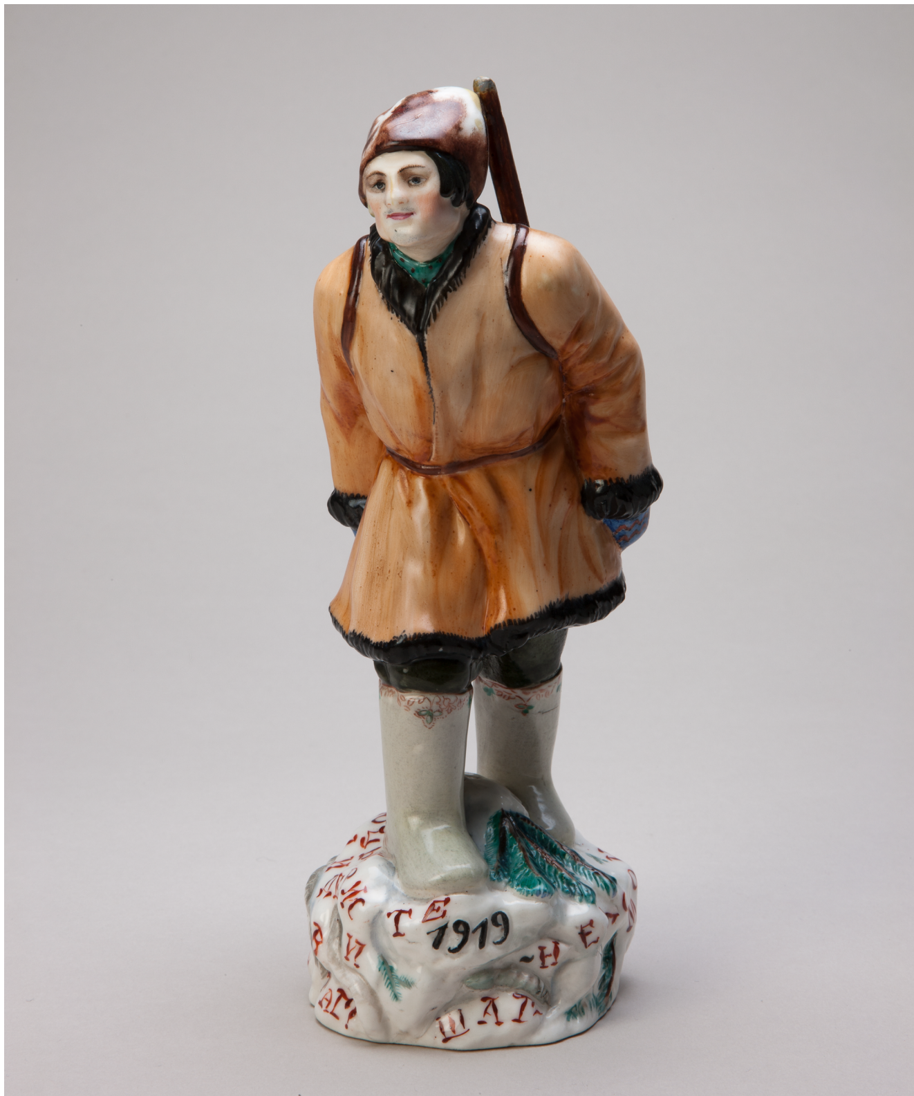
Илл. 1. Скульптура «Партизан в походе». 1920-е. Модель Н. Я. Данько, 1919. Фарфор, роспись надглазурная полихромная

Первой работой скульптора на названную тему стала открывшая серию историко-революционных типов скульптура «Красноармеец», известная нашим современникам как «Партизан в походе» (Илл. 1). На высоком подножии с рельефом, имитирующим снежные сугробы с ветками деревьев, с датой 1919, обозначающей время действия, и надписью «Революционный держите шаг — неутомный не дремлет враг» в образе шагающего вразвалку паренька изображен красноармеец. Он в