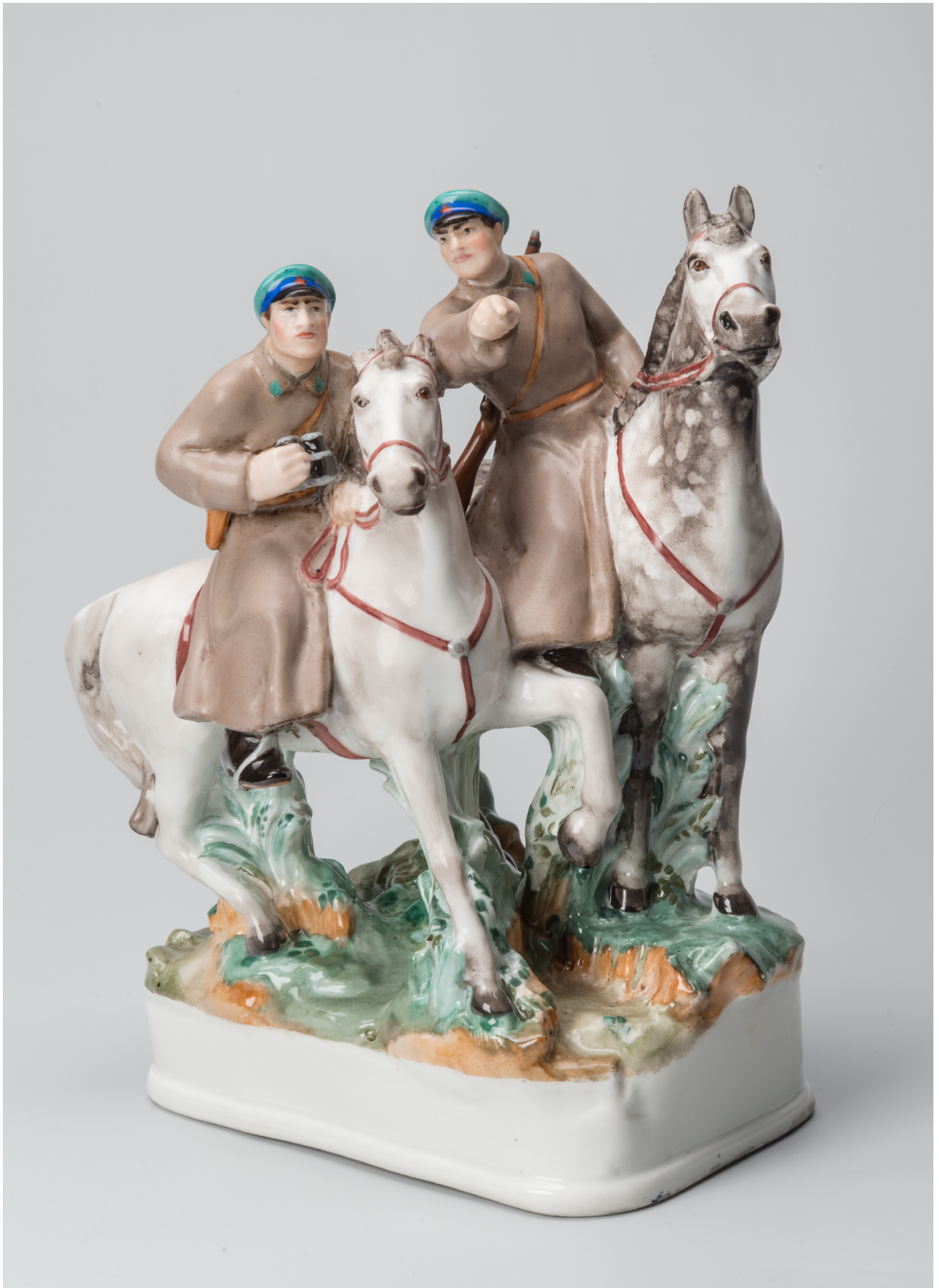
Илл. 7. Скульптурная группа «Конная разведка». 1930-е . Модель Н. Я. Данько, 1938. Формовщик И. Д. Кузнецов. Роспись М. П. Кирилловой. Фарфор, роспись надглазурная полихромная