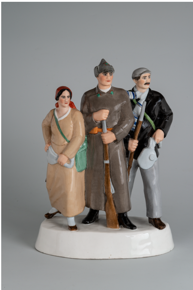
Илл. 5. Скульптурная группа «Готовы к обороне». 1930-е. Модель Н. Я. Данько, 1932. Формовщик И. Д. Кузнецов. Фарфор, роспись надглазурная полихромная © Государственный Эрмитаж, Санкт-Петербург, 2021. Фотографы Д. В. Сироткин, А. В. Теребенин

обретенный в 1939 г. в Антикварном магазине Государственным музеем керамики, располагавшемся в усадьбе Кусково, хранится в его коллекции и сейчас [6, с. 38].