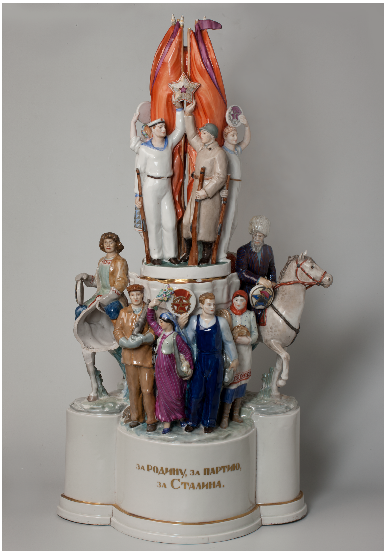
Илл. 8а. Скульптурная группа «Готов к труду и обороне». 1941. Модель Н. Я. Данько, 1940. Роспись В. А. Шехтера. Фарфор, роспись надглазурная, полихромная, позолота, серебрение