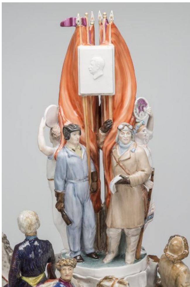
Илл. 86. Скульптурная группа «Готов к труду и обороне». Фрагмент