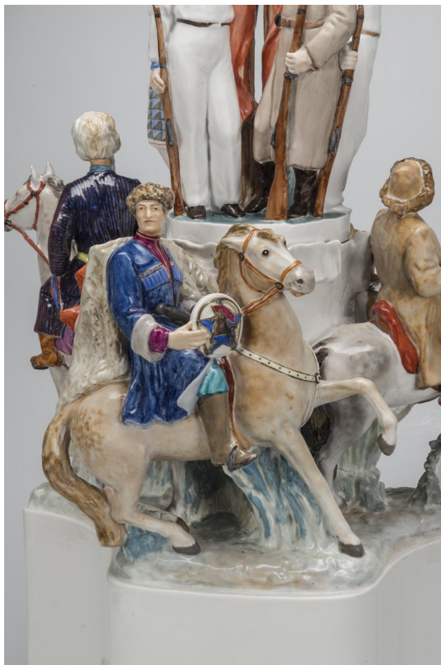
Илл. 8а. Скульптурная группа «Готов к труду и обороне». Фрагмент

Масштабная композиция «Готовы к труду и обороне», появившаяся накануне войны, исподволь созревала в творчестве скульптора. Выполнена она в рамках социального заказа времени и посвящена 60-летию К. Е. Ворошилова 2 (Илл. 8а).