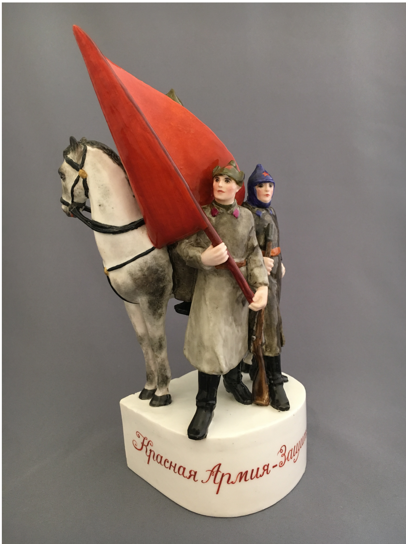
Илл. 4а. Скульптурная композиция «Красноармейская группа». Конец 1920-х. Модель Н. Я. Данько, 1927. Фарфор, роспись надглазурная полихромная, позолота, цирровка. Частное собрание, Санкт-Петербург