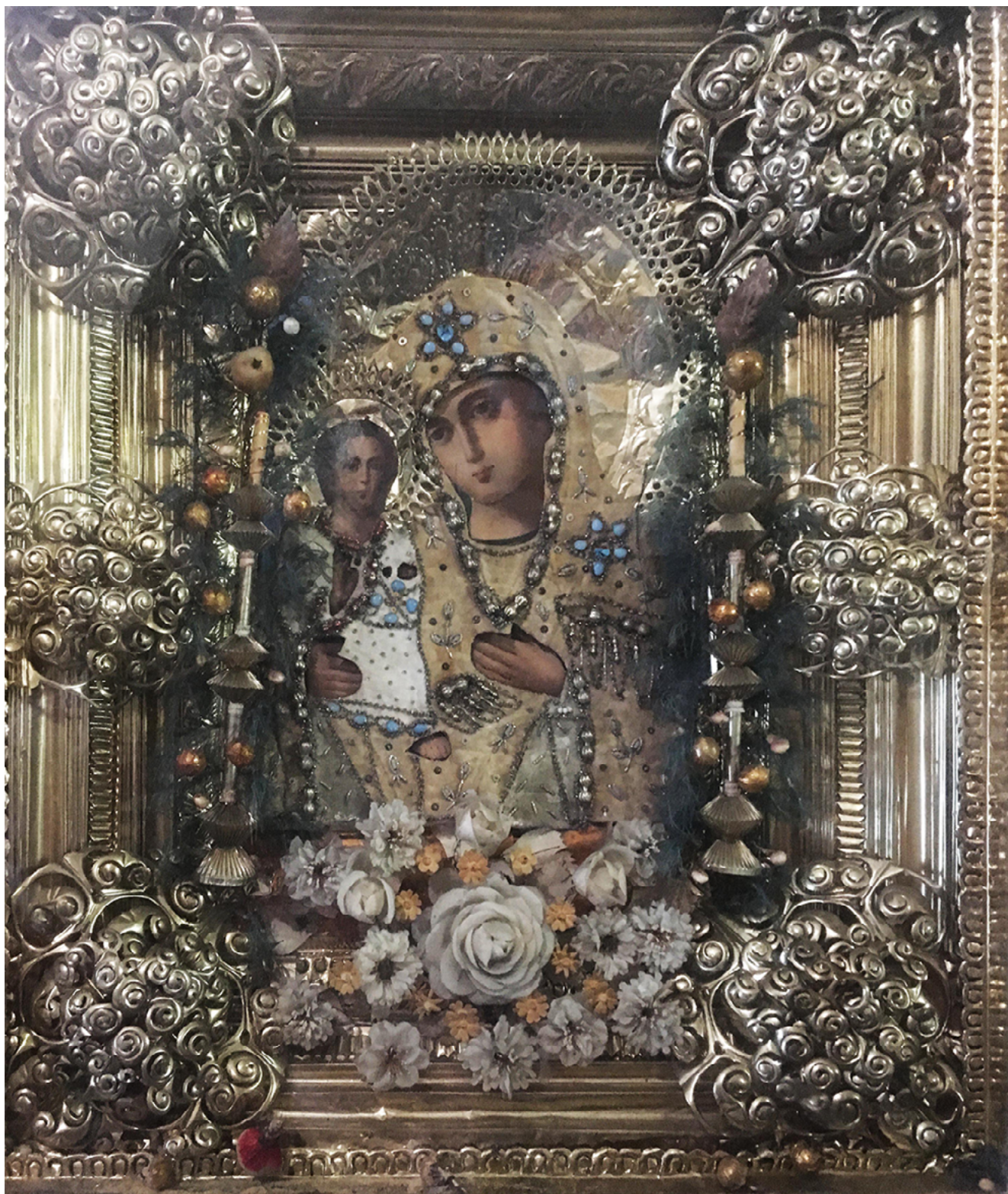
Илл. 9. Образ Богородицы. Начало XX в. Прорезной металл, тиснение, бумажные цветы. Экспозиция музея Спасо-Яковлева Дмитриева монастыря «Монастырская ризница», Ростов Великий.

использовались для изготовления самых разных предметов. Например, кокошники изготавливались из прорезного и просечного картона (Илл. 8), изготавливались прорезные и просечные фольговые оклады на недорогие иконы, бумажные украшения и бумажные цветы на иконы, иконные и посудные полки, на гробы и многое другое [13, с. 10–11] (Илл. 9). Интереснейшим феноменом этого вида искусства является традиция изготовления бумажных «снежинок» перед Новым годом, которая возни-