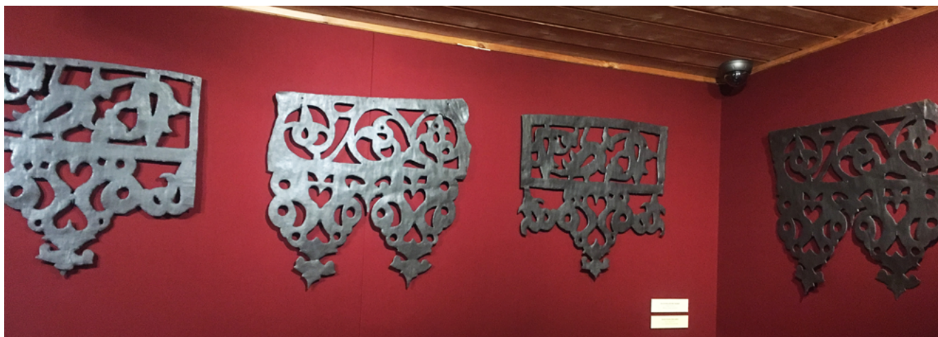
Илл. 4. Фрагменты архитектурного декора в экспозиции музея Коломенское, Москва. XVII– XVIII вв. Железо, просечка.

мание этого привело к путанице в терминологии и в восприятии подобных произведений.