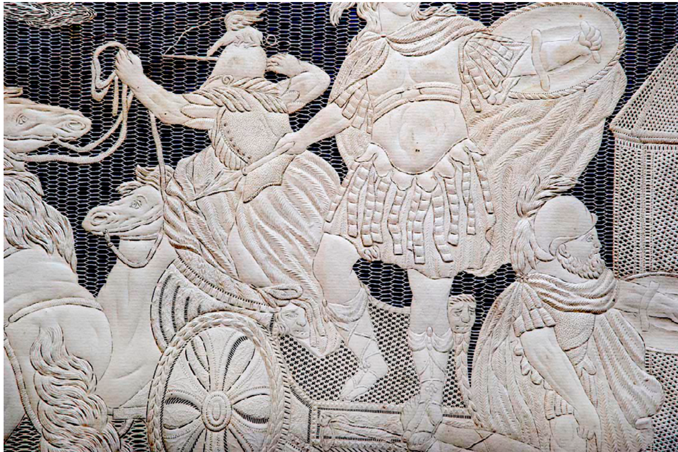
Илл. 5. Алексей (Александр) Артамонов. Смерть Гектора. 1807. Фрагмент прорезной картины из собрания митрополита Платона Левшина. Бумага, вырезание ножом, пробойниками, тиснение. Сергиево-Посадский музей-заповедник, Сергиев-Посад.

Из отдельных вырезанных элементов, приклеенных или прикрепленных на фон другим способом, могут создаваться однослойные, многослойные и многоцветные композиции, то, что обычно называется «аппликацией» (от латинского слова applicatio — прикладывание). Но любая одноцветная вырезка, любой силуэт могут быть приклеены на фон, и при этом они не