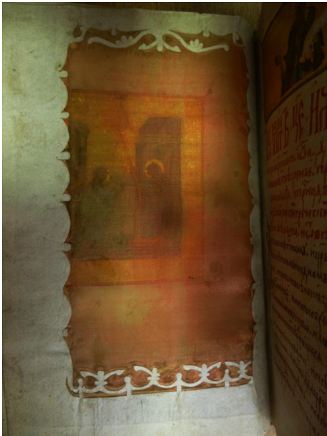
Илл. 6. Рамка для занавеси. Тверской сборник. 1490-е. Вырезание из бумаги. Государственный архив Тверской области, Тверь.

называются аппликацией. В истории вырезания многоцветные и многослойные вырезные композиции из разных материалов известны довольно давно, достаточно вспомнить памятники Пазырыкских курганов или нанайские свадебные халаты из рыбьей кожи. Традиционно различают аппликации из войлока, кожи, ткани, бумаги и т. п. На наш взгляд прикладывание вырезок к фону, их прикрепление — это название процесса завершения работы , которое стало подменять основную технику создания образа , что внесло дополнительную путаницу. На музейных этикетках пишется «войлок, аппликация». То есть «войлок, прикладывание» или, как в случае с бумагой, «бумага, прикладывание». В этом случае техника создания самого произведения не указывается. На наш взгляд необходимо писать «войлок, вырезание, аппликация» или «аппликация вырезным войлоком».