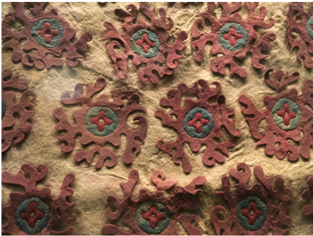
Илл. 1. Фрагмент конского чепрака. IV–III вв. до н. э. Могильник Пазырык, курган 5. Вырезание из войлока. Аппликация. Государственный Эрмитаж, Санкт-Петербург.