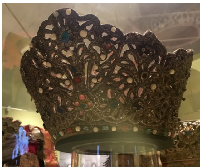
Илл. 8. Венец. Девичий головной убор. Россия, Новгородская губерния, первая половина XIX в. Картон, просечка, шелк, золотное шитье, низание, перламутр. Государственный исторический музей, Москва.

Вырезание из кожи, бересты, ткани, войлока, издревле бытовало в народном искусстве по всей территории России. Но народная традиция вырезания из бумаги возникла после того, как у рабочих и крестьян появилась бумага и картон, которые