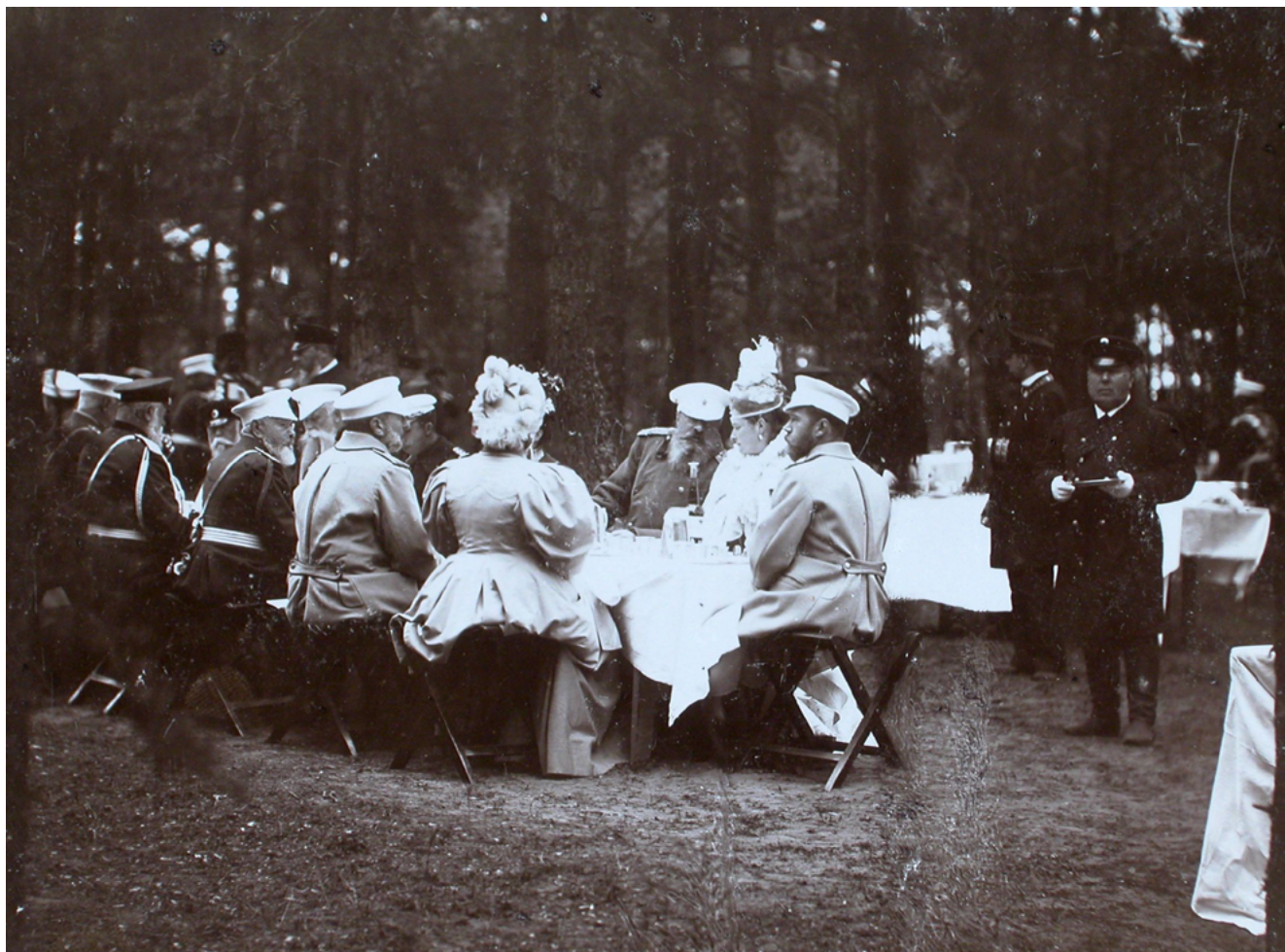
Илл. 6. Высочайшие гости во время завтрака в лесу после смотра войск. 1897. Фотография. ЦГАКФД СПб. П. 329. Сн. 36

В Лазенковском дворце останавливался, например, император Александр II во время своего приезда на польские земли в 1867 г. Историческим свидетельством этого визита является поднесенное монарху подносное блюдо, которое хранилось во дворце, а ныне находится в фондах Национального музея в Варшаве. А в 1884 г. этот парк посещали его сын Александр III и внук Николай Александрович — тоже будущий монарх, о чем упоминалось ранее.