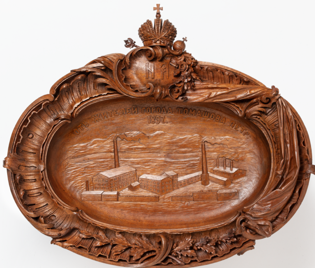
Илл. 8. Блюдо подносное «от жителей города Томашова». Мастер В. Богачик. 1897. Варшава. Дерево, резьба, полировка. 52,0 x 42,0 x 6,0 см

Таким образом, в собрании Эрмитажа сохранились два подносных блюда мастера В. Богачика: одно от города Варшавы,