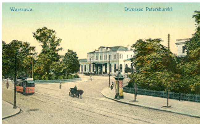
Илл. 2. Санкт-Петербургский вокзал в Варшаве. 1900-е. Открытка. Собрание автора

властям и подданным, что, например, Варшава — лишь один из многочисленных губернских городов. Именно по этой причине на подносном блюде из собрания Эрмитажа помещена надпись «ОТ ГОРОДА ВАРШАВЫ».