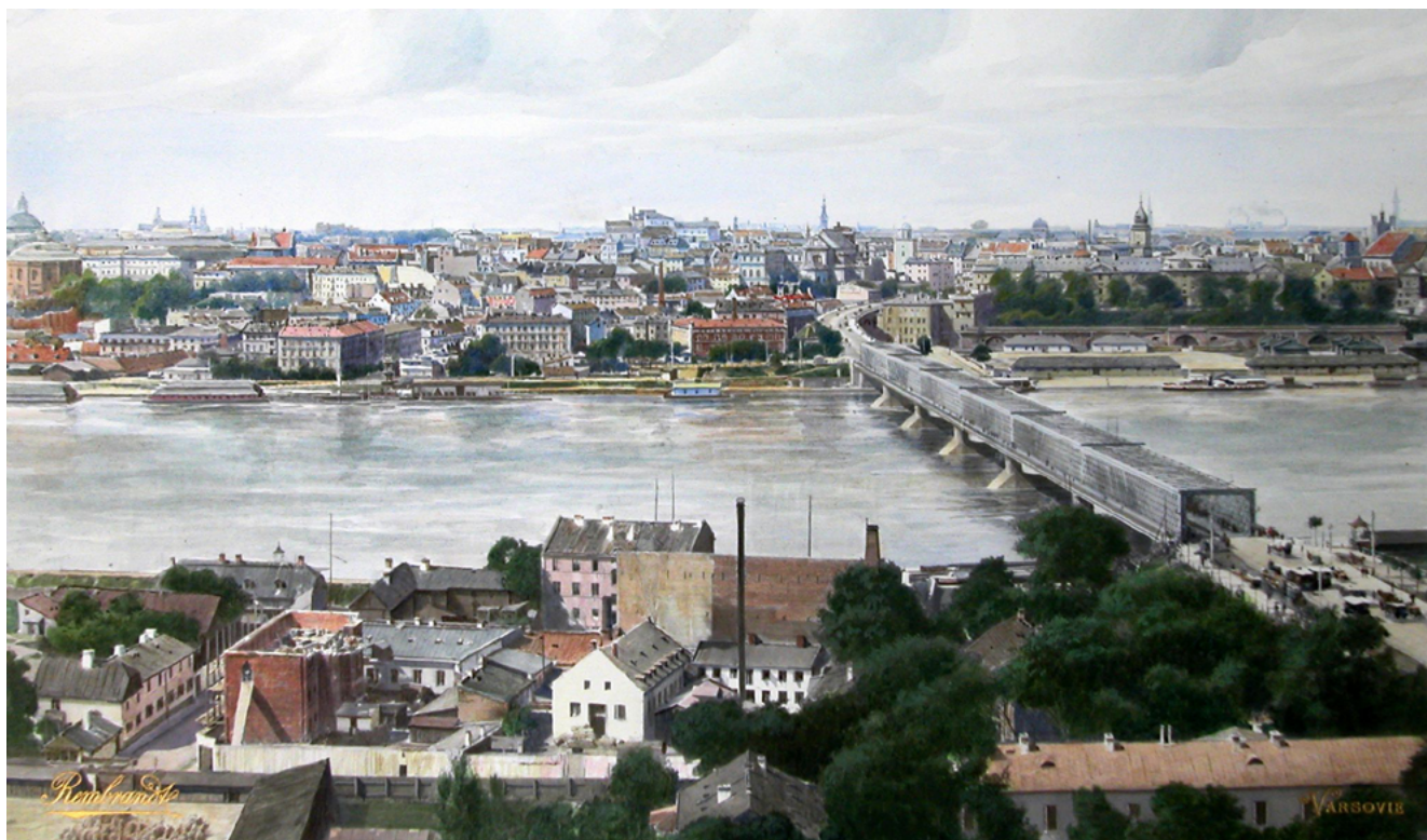
Илл. 1. Общий вид города Варшавы со стороны реки Вислы. 1890–1900-е. Фотография. ЦГАКФФД СПб. П. 345. Сн. 19

ных, этнических и религиозных групп, а также от городов, что подчеркивало широту просторов государства, национальное и профессиональное многообразие населения [9]. Выполненные как ведущими ювелирными фирмами, так и провинциальными кузнецами, эти изделия имеют традиционную круглую форму, продиктованную функциональной необходимостью — поместить в центр выпеченный хлеб и солонку [1, с. 52].