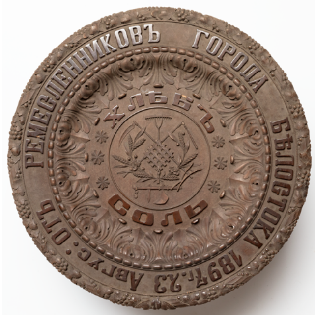
Илл. 9. Блюдо подносное «от ремесленников города Белостока». Неизвестный мастер. 1897. Дерево, резьба, полировка, тонировка. 50,5 x 50,5 x 4,5 см

другое от жителей города Томашова, что обозначено резными буквами на бортике.