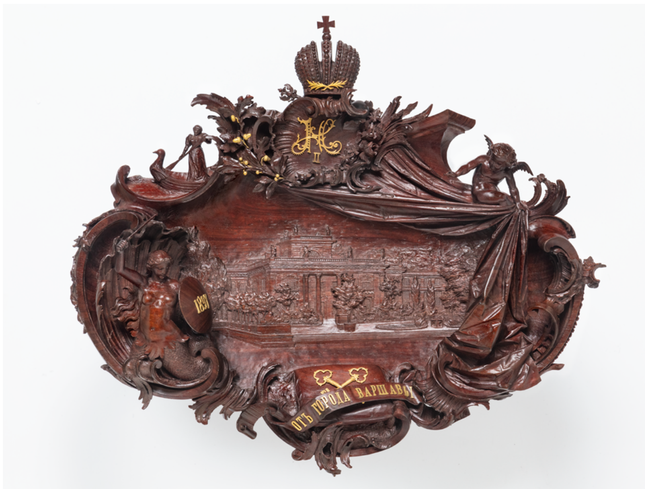
Илл. 3. Блюдо подносное «от города Варшавы». Мастер В. Богачик. 1897. Варшава. Дерево, металл, резьба, литье, полировка. 41,0 x 56,0 x 8,0 см

На улице стояла летняя погода, и, по словам Николая II, все «умирали от жары» [3, с. 358]. Однако правила этикета требовали от всех участников торжественной встречи надеть парад-