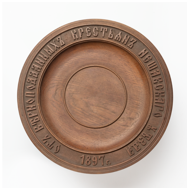
Илл. 10. Блюдо подносное «от верноподданных крестьян Нешавского уезда». Неизвестный мастер. 1897. Дерево, резьба, полировка, тонировка. 43,0 x 43,0 x 5,0 см

Внешняя простота этого произведения была продиктована функциональностью предмета: поскольку в центре