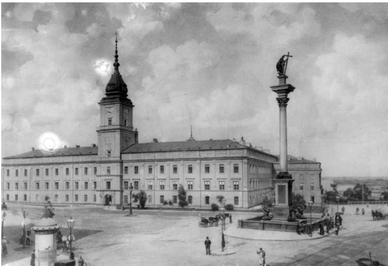
Илл. 7. Вид Королевского замка в Варшаве. 1890-е. Фотография. ЦГАКФФД СПб. А. 8876

Поэтому неудивительно, что для размещения семьи Николая II на время их пребывания в Варшаве в 1897 г. был выбран именно комплекс в Лазенках.