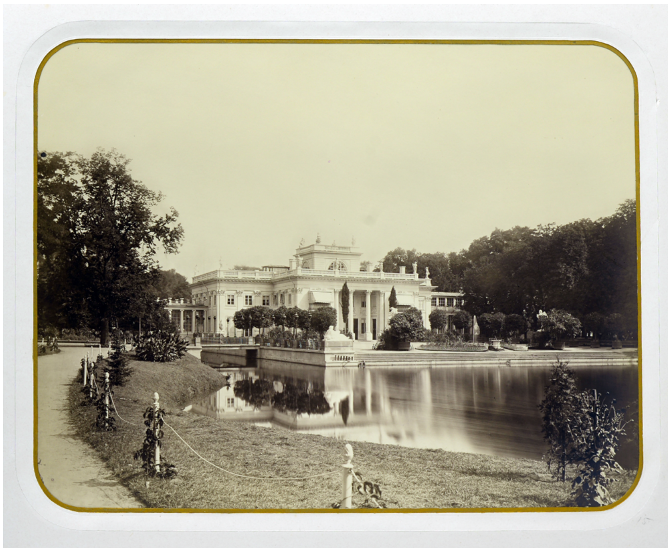
Илл. 4. Вид на королевский дворец Лазенки. Конец XIX в. Фотографическое ателье "Kloch & Dutkiewicz", Варшава. Фотография © Государственный Эрмитаж, Санкт-Петербург, 2021. Фотографы С. В. Бутыгин, А. Я. Лаврентьев

ные мундиры (для военных) или фраки (для гражданских лиц всех сословий). Сам император вышел в форме лейб-гвардии Волынского полка.