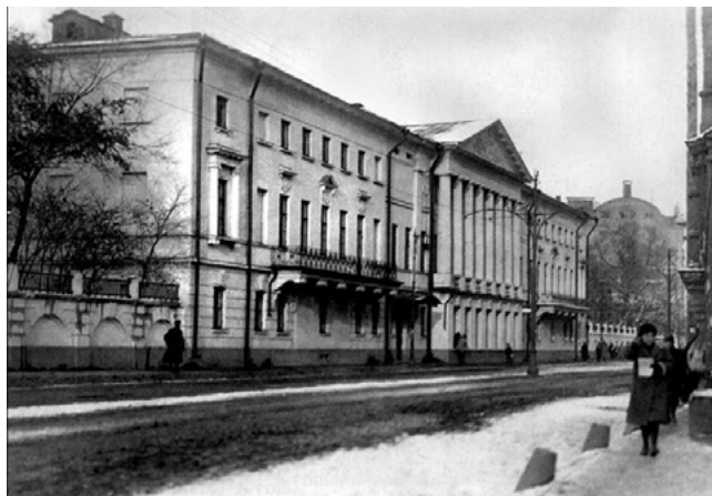
Илл. 2. Здание Государственной академии художественных наук. Фотография. 1923–1930

Классический период наступает в конце жизни в Киеве (орнаменты Владим. Собора).