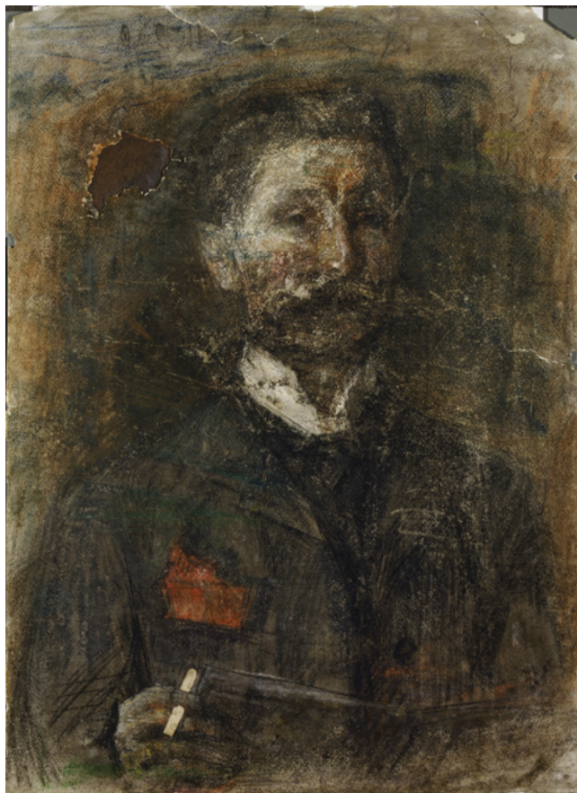
Илл. 8. М. А. Врубель. Автопортрет. 1904–1906. Бумага, пастель, уголь, коллаж. 64 x 46. Государственная Третьяковская галерея, Москва. Инв. № Р-4687

Другой вопрос, что именно автор подразумевал под «реализмом». Ответ можно найти в книге «От мольберта к машине» [18], где Тарабукин объяснял: «Понятие “реализм” я употребляю в самом широком смысле и отнюдь не отождествляю его с натурализмом, являющимся одним из видов реализма и притом самым примитивным и наивным по выражению. <...> Не копирование действительности стало отныне мотивом реалистических устремлений (как это было у натуралистов), но, напротив, действительность перестает быть в каких бы то ни было отношениях стимулом творчества. Художник в формах своего искусства создает свою действитель-