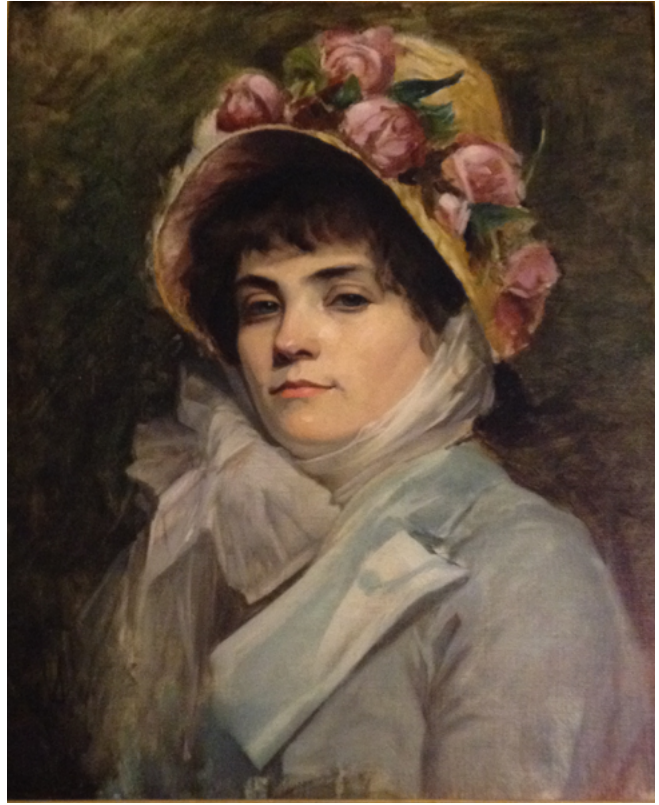
Илл. 5. М. К. Башкирцева. Жоржетт. 1881. Холст, масло. Замок-музей Генриха IV, Нерак