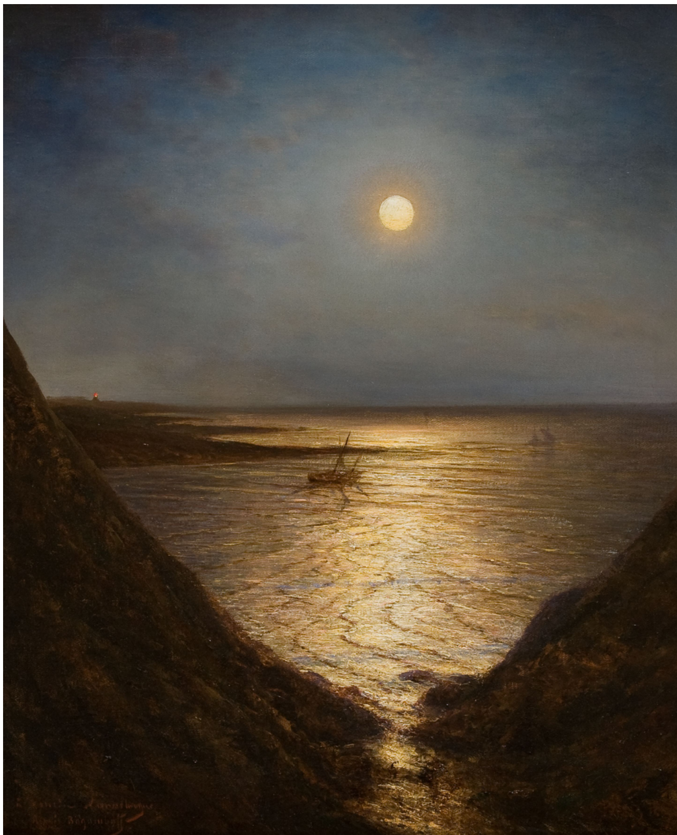
Илл. 7. А. П. Боголюбов. Лунная ночь. 1867. Холст, масло. Музей Рыбной ловли, Фекан