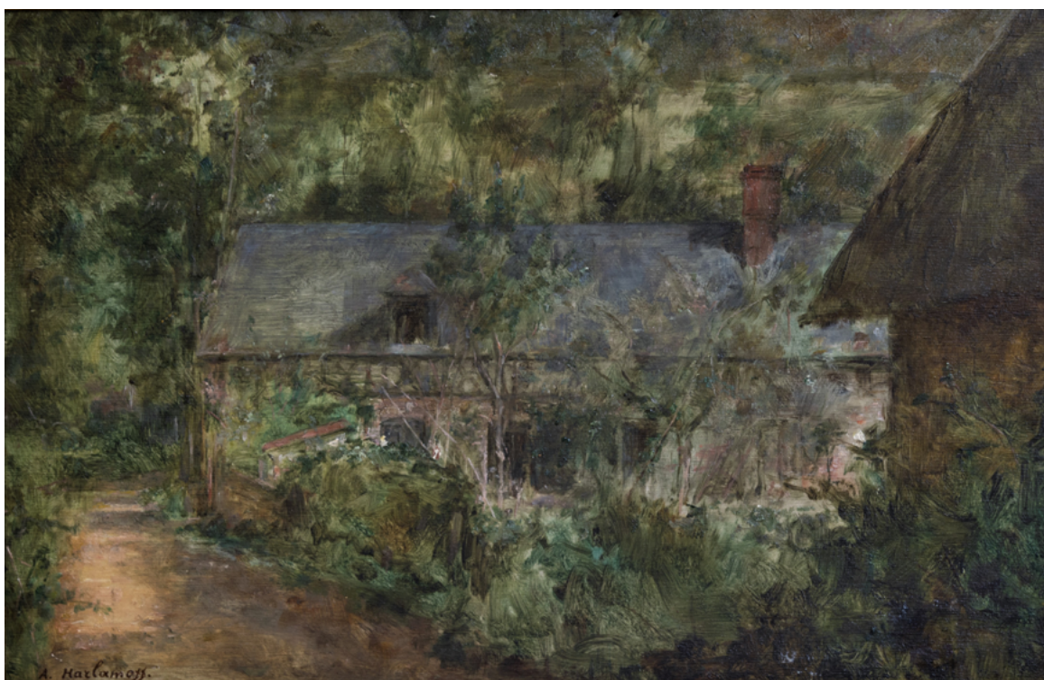
Илл. 9. А. А. Харламов. Дом в Вёле. Без даты. Холст, масло. Мэрия Вёля