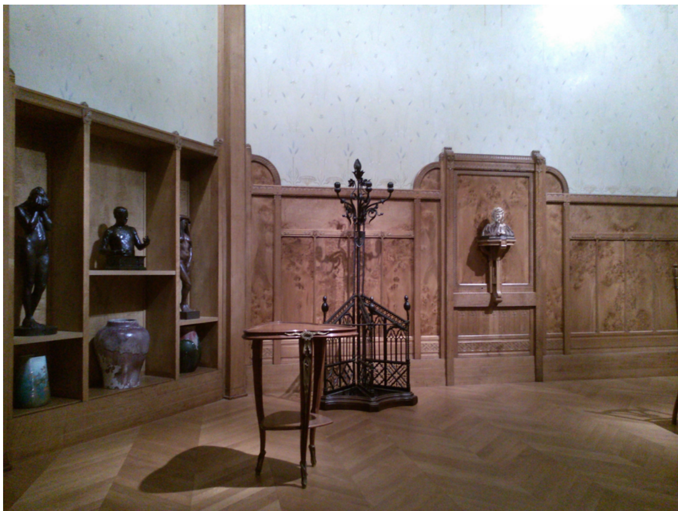
Илл. 3. М. К. Башкирцева. Горе Навзикаи в интерьере Ар Нуво. 1884. Бронза. Музей д'Орсэ, Париж

Картины и рисунки Башкирцевой, подаренные ее матерью, можно видеть и в провинциальных музеях Франции. Речь идет, прежде всего, о музее изящных искусств Жюля Шере в Ницце, городе, в котором жила семья Марии. В музее Шере — 10 картин художницы и несколько графических произведений. Кроме этого, в музее Зиема в Маргите на юге Франции находится ранний портрет кисти Башкирцевой — «Молодая женщина в шляпе с голубым пером» (Илл. 4). Картина поступила в коллекцию музея в 1911 г. согласно желанию супруги Феликса Зиема, обратившейся к матери художницы с просьбой подарить музею произведение