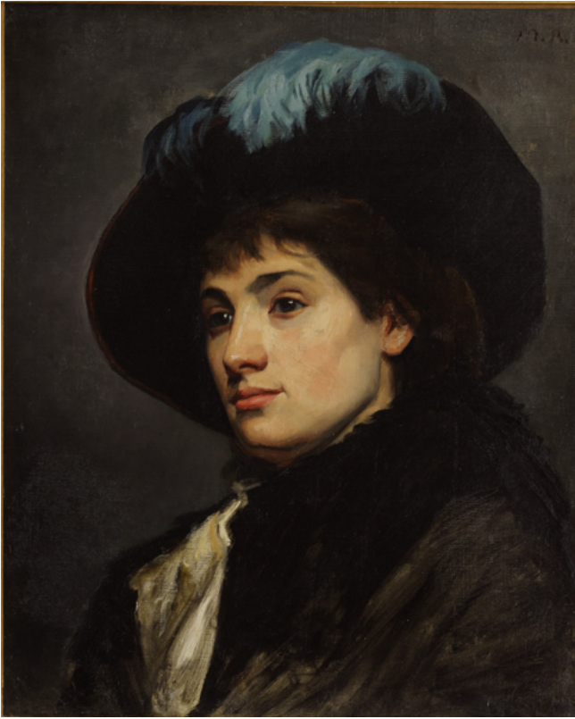
Илл. 4. М. К. Башкирцева. Молодая женщина в шляпе с голубым пером. Около 1878. Холст, масло. Музей Зиема, Мартиг