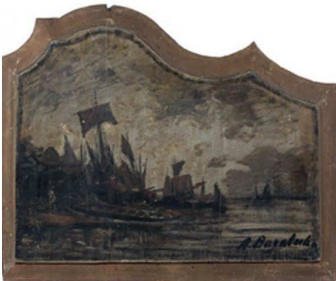
Илл. 8. А. П. Боголюбов. Взморье. Без даты. Дерево, масло. Музей Эжена Будена, Онфлёр.