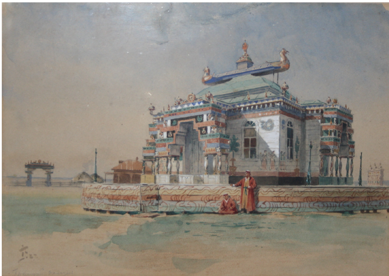
Илл. 6. И. П. Прянишников. Неизвестный дворец. Акварель, перо. Музей Баронселли, Сент-Мари-де-ла-Мер