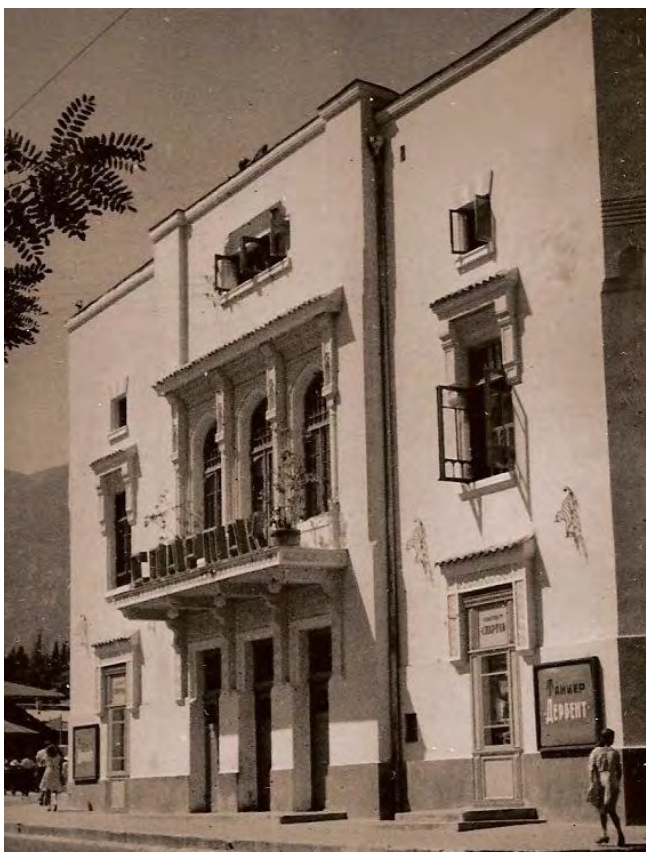
Илл. 1. Народный дом. 1930-е

жизни. Так, летом 1919 г. была открыта театральная школа при народном университете, расположившемся в Народном доме (в конце Пушкинского бульвара, ныне здание кинотеатра «Спартак») (Илл. 1, 2) под председательством врача и