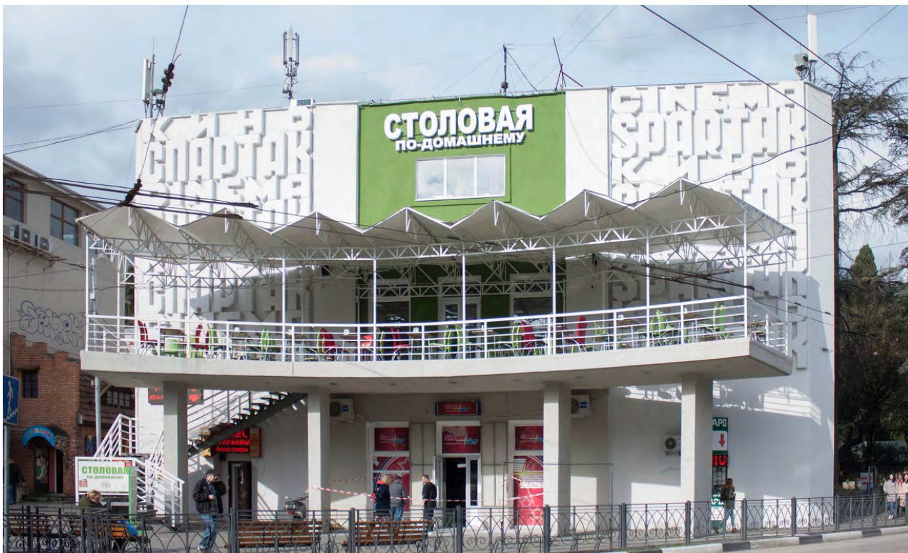
Илл. 2. Здание кинотеатра Спартак. Современный вид. Фото 2020

Исторический анализ состояния балетного искусства России начала XX в. позволяет констатировать лидирующие позиции этого вида искусства в мировом балетном пространстве.