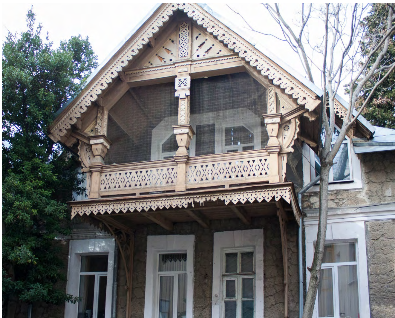
Илл. 3. Здание дворянского собрания. Современный вид. Фото 2020

В сложный военно-революционный период, находясь в Москве, М. М. Мордкин открывает собственную балетную студию, впоследствии воспитавшую немало известных московских танцовщиков и хореографов, экспериментаторов советского балета 1920-х – 1930-х гг. Благодаря работе авторской школы были подготовлены танцовщики для будущей собственной гастрольной труппы, получившей название «Московский передвижной театр балета». Репертуар коллектива строился в основном на сочинениях самого М. М. Мордкина, его концертных номерах, классических и характерных танцах, называемых «хореопоэмами», а также первом большом балетном спекта-