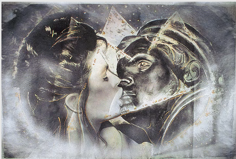
Поцелуй с историей. 1994. Фотография, травление, аэрограф, акварель, впечатывание газет, акрил. 100х150 см. Эта работа приобретена Художественным музеем Вайсмана с выставки «Американский поп-арт и русский соц-арт»

По результатам этих съёмок получилась большая серия работ, выполненных в разное время в разных техниках.