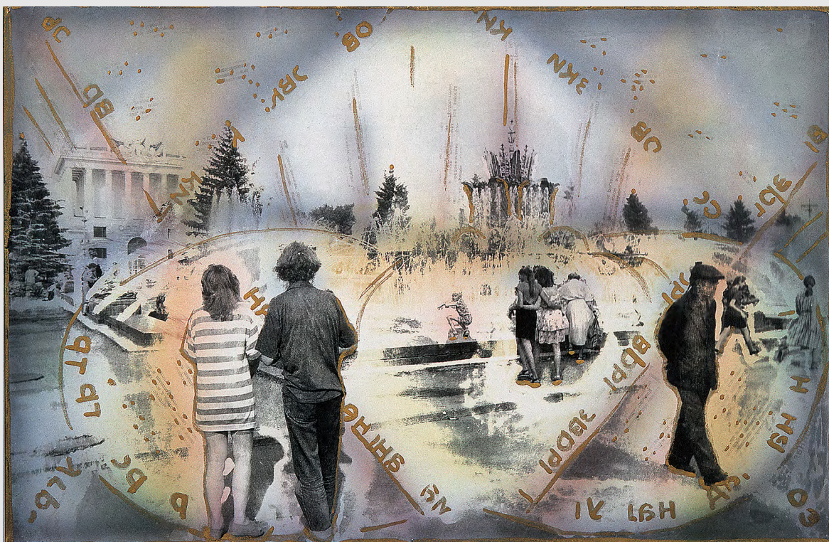
ВДНХ, фонтан. 1994. Фотография, травление, ретушь, аэрограф, акварель, впечатывание газет. 30x24 см

Кстати, до перестройки социальными проблемами мы мало интересовались, а здесь пошёл сплошной социум. Мы включили в свои задачи интерес к социальным изменениям, с той лишь разницей, что социальное само по себе для нас не было главным. Фотография фиксировала состояние мира, в том числе и его социального слоя. Это был фактический материал, который нам предстояло сделать значимым в искусстве. И мы начали работать исключительно с фотодокументами, закончив на время с рисунком, живописью и акварелью. Как-то Ольга Барыкина, которая снимала о нас фильм, посвященный нашим перформансам на станции «Площадь революции», спросила: «Вы столько работаете с метро, а где вы познакомились?». Мы переглянулись: «В метро!». «Теперь всё понятно», — сказала она! А мы задумались, неужели это действительно как-то связано? Вероятно да, иначе почему эта тема постоянно возникает у нас под разными соусами и в разное время. Ведь если бы не метро, мы, скорее всего, никогда бы не встретились.