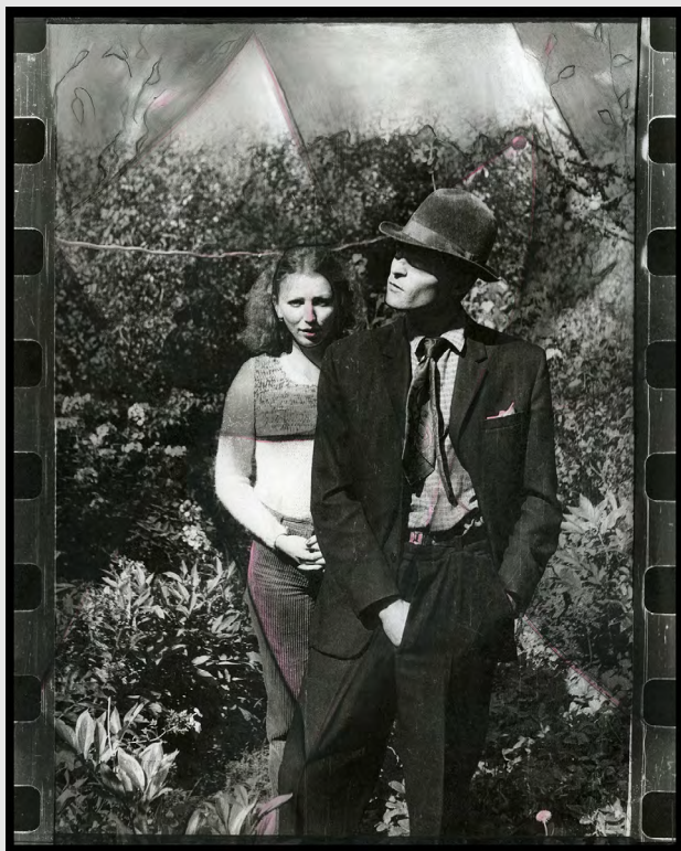
Грехопадение... Из серии «Адам и Ева. История с яблоком». 1981–1984. Черно-белый отпечаток, ретушь, красный карандаш. 24x30 см

Чисто фотографические работы Валера делал с 1962 по 1968 гг. Они были фотодокументацией акций, хешпенингов и перформансов. Позже фотография шла параллельно с изобразительными работами: рисунком, акварелью, живописью. В 1983–1984 гг. Валера начал постепенно использовать фотографию как материал для работы. До этого опыт был только однажды, с «луриком» — портрет 1968 г. «Лурик» — это увеличенная маленькая чёрно-белая фотография, раскрашенная анилиновыми красками. Тогда Валера не втянулся ни в этот коммерческий процесс, развитый в Харькове, ни в процесс эстетизации этого продукта в искусстве. Он не был готов, да и не было среды, мотивации.