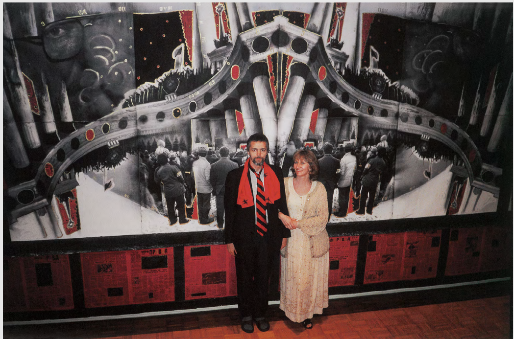
Инсталляция «Конец Эпохи». Дикинсон колледж, США. 1998.

Эту инсталляцию мы сделали для презентации фильма Сергея Соловьева «Дом под звездным небом», которая проходила в киноконцертном зале «Россия» в 1991 г. В верхних углах видно, как Соловьев смотрит на все происходящее в стране и курит сигару. Потом мы её выставили во многих местах.