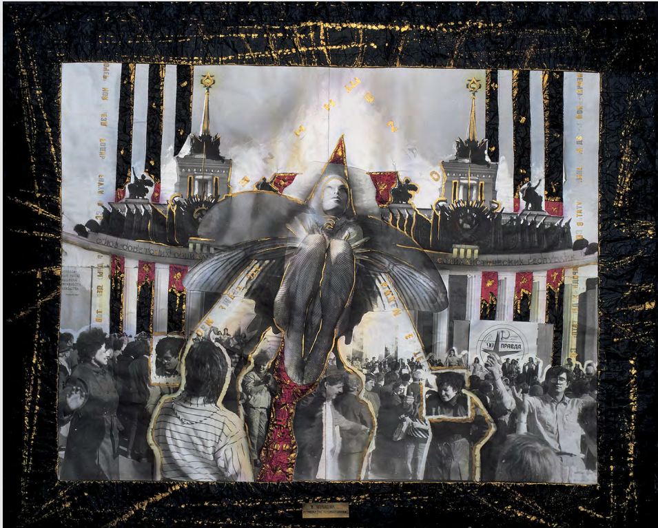
Подземная бабочка 1. 1991.

Черно-белый отпечаток, газеты, монтаж, травление, впечатывание газет, акварель, аэрограф, бронзовый акрил, чернила, газетная рама. 125x145 см