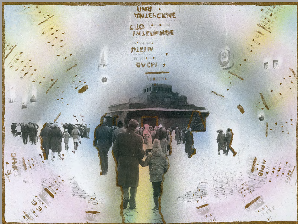
Красная площадь, Мавзолей. НЛО. 1993. Фотография, травление, ретушь, аэрограф, акварель, впечатывание газет, акрил. 18x24 см

Закончилась наша эпоха погружения в прошлое и настоящее нашей страны. Открылись границы других государств, и мы начали постепенно осваивать другие страны и другие культуры. Это дало нам новые формы в нашем искусстве, необходимые для выражения уже приобретенного нами опыта.