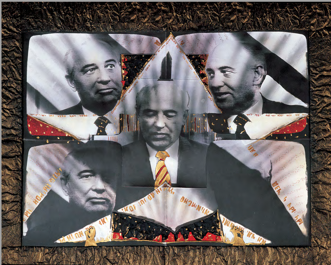
ТВ 1. Горбачёв. 1991. Черно-белый отпечаток, газеты, монтаж, травление, впечатывание газет, акварель, аэрограф, бронзовый акрил, чернила, газетная рама. 80x100 см