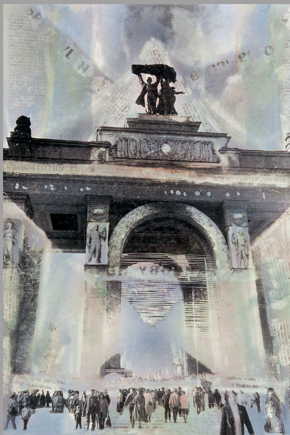
ВДНХ. 1991. Фотография, травление, ретушь, аэрограф, акварель, впечатывание газет. 30x24 см

В первых работах по ВДНХ было вытравлено много деталей, окружающих статуи фонтана и фигуры людей. Это было символично, в стране началась перестройка, и многое убиралось, уничтожалось. Мало что тогда устояло... Действительно, как будто вытравлялась наша история, наша культура, всё привычное и появлялось новое, незнакомое. Вместо лозунгов типа «Вперёд к лучшей жизни!» появились лозунги «Иди в Макдональде!», «Покупай две, третья бесплатно» или, условно, «Пей Кока-Колу», что было вкусно и по-другому.