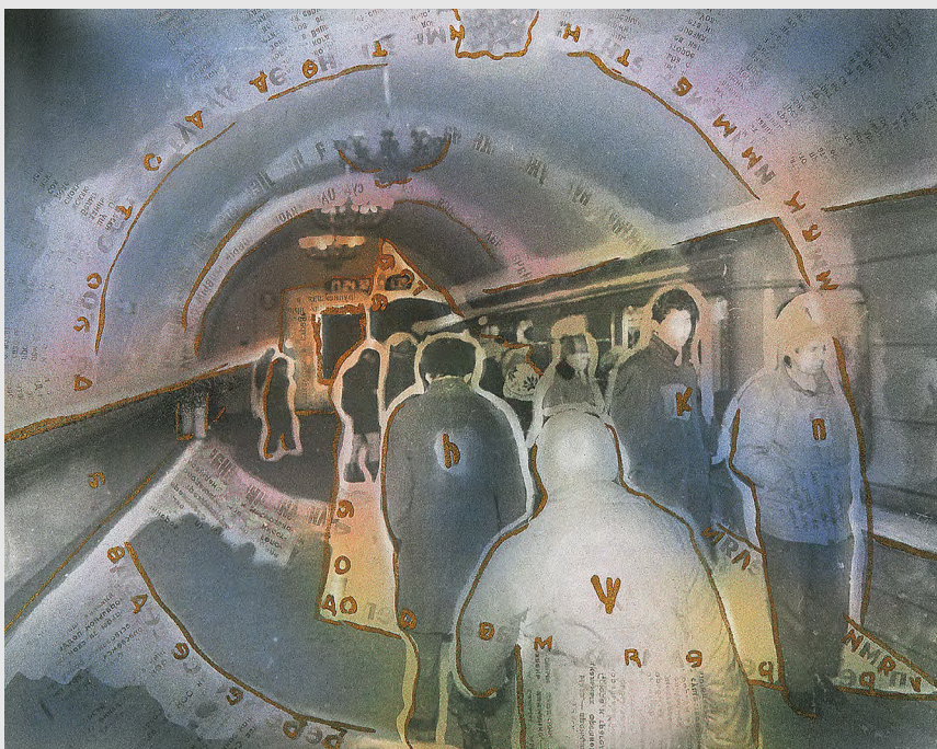
Метро, поезд. 1992. Фотография, травление, аэрограф, акварель, впечатывание газет, акрил. 24x30 см

Кстати, до перестройки социальными проблемами мы мало интересовались, а здесь пошёл сплошной социум. Мы включили в свои задачи интерес к социальным изменениям, с той лишь разницей, что социальное само по себе для нас не было главным. Фотография фиксировала состояние мира, в том числе и его социального слоя. Это был фактический материал, который нам предстояло сделать значимым в искусстве. И мы начали работать исключительно с фотодокументами, закончив на время с рисунком, живописью и акварелью. Как-то Ольга Барыкина, которая снимала о нас фильм, посвященный нашим перформансам на станции «Площадь революции», спросила: «Вы столько работаете с метро, а где вы познакомились?». Мы переглянулись: «В метро!». «Теперь всё понятно», — сказала она! А мы задумались, неужели это действительно как-то связано? Вероятно да, иначе почему эта тема постоянно возникает у нас под разными соусами и в разное время. Ведь если бы не метро, мы, скорее всего, никогда бы не встретились.