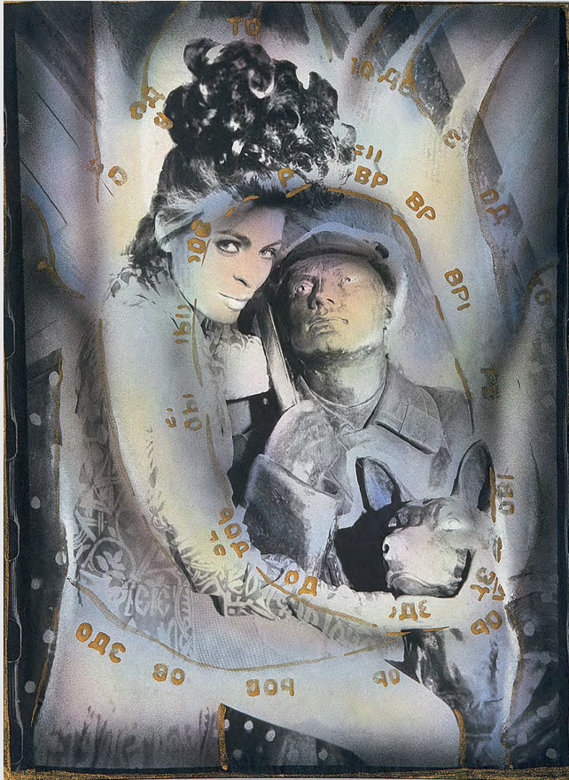
Любовь народа к искусству для народа. 1994. Фотография, травление, аэрограф, акварель, впечатывание газет, акрил. 40х30 см. Институт искусств Чикаго

Мы в очередной раз обратились к съёмкам нашего перформанса, только уже на новом техническом уровне. Мы шаг за шагом изобретали свою уникальную технику. Работали с фотоизображением при помощи травления, рисования, акварели и аэрографа, золотого и серебряного акрила, впечатывали газетные тексты.