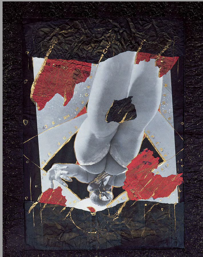
Кариатида. Нью Русского авангарда 3. 1990. Черно-белый отпечаток, газеты, монтаж, травление, впечатывание газет, акварель, аэрограф, бронзовый акрил, чернила, газетная рама. 100x80 см. Коллекция «Стелла Арт Фаундейшен»