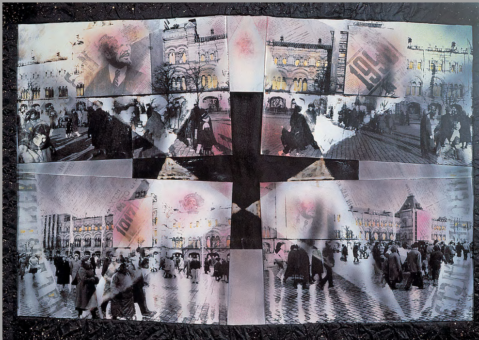
Последний ноябрь. Красная площадь. ГУМ. 1991. Черно-белый отпечаток, монтаж, травление, впечатывание газет, акварель, аэрограф, бронзовый акрил, чернила, газетная рама. 80x100 см

Одни из первых коллажных работ. Серия называлась «Последний ноябрь». Мы сделали съемки на Красной площади 8 ноября 1990 г. Оказалось, что это было последнее официальное празднование Октябрьской Социалистической революции и последняя официальная демонстрация трудящихся. В центре мы поставили чёрный лист фотобумаги, мы его просто засветили, а потом проявили. Это была такая же фотобумага, на которой были напечатаны и остальные изображения, но на ней должно было отразиться «сегодня»... Символически мы проявили в этих работах крест и звезду. Время было стрёмное, полное неизвестности, ожиданий и страхов. На работе, в сердце Москвы люди в растерянности стоят перед мавзолеем с вопросами... Еще был почётный караул, скоро его не станет и дверь будет закрыта. Потом всё вернётся на свои места. Остается постоянный вопрос: «Захоранивать или пусть его...», и он не решается. Как будто этот вопрос не может решиться теми людьми, которые ставят этот вопрос. А кто за этим или что за этим стоит?! Мистика какая-то... Фотографии специально плохо зафиксированы, они живут своей непредсказуемой жизнью. Мы не знаем, как они поведут себя. На них изображение постоянно меняется, оно непредсказуемо, как и тогдашнее время.