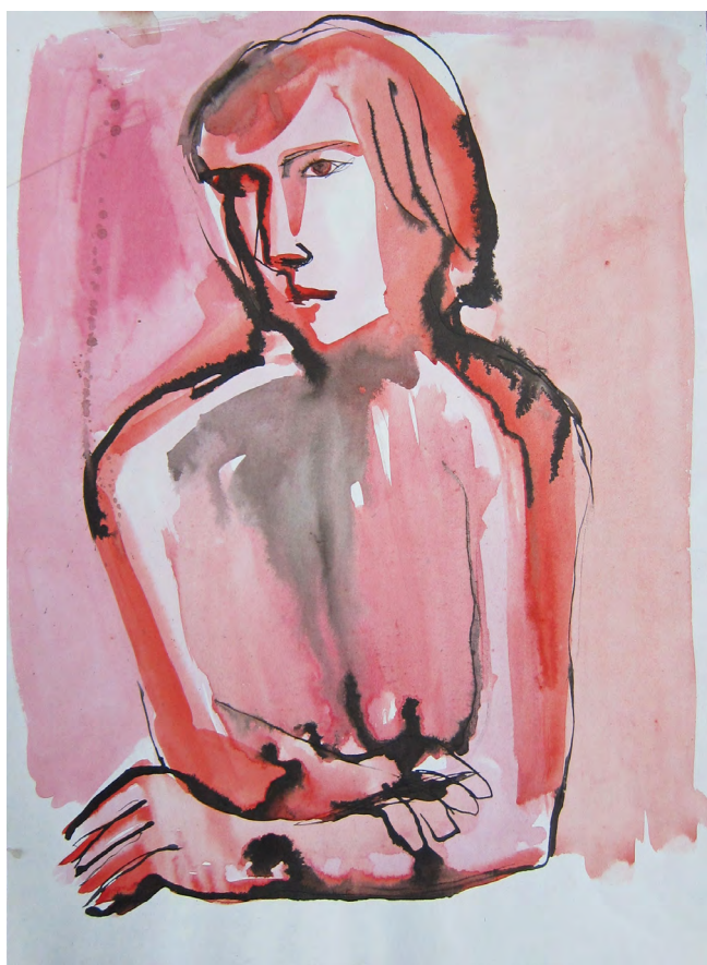
Илл. 9. Роберт Абрамович Лотош. Молодая женщина. 2008. Бумага, тушь, акварель. Собственность автора

Важную страницу в творчестве художника занимает память о родителях. Их образы воплощены по-разному: известен графический портрет отца художника — Абрама Мордуховича (литография, 2002) — и портрет матери (1983), выполненный в