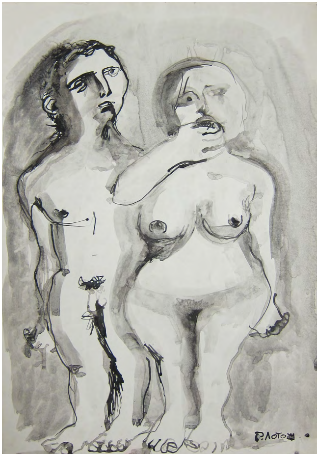
Илл. 5. Роберт Абрамович Лотош. Адам и Ева. 1994. Бумага, тушь. Частная коллекция

и телесности» [2, с. 95]. Да, задача нелегка и не всегда достигаема, но отчего же не последовать заветам великого французского скульптора О. Родена: «Рисунок в скульптуре... — это воплощение, позволяющее вложить душу в камень. Результат великолепен: вместе с профилями тела это дает и все профили души» [20, с. 296].