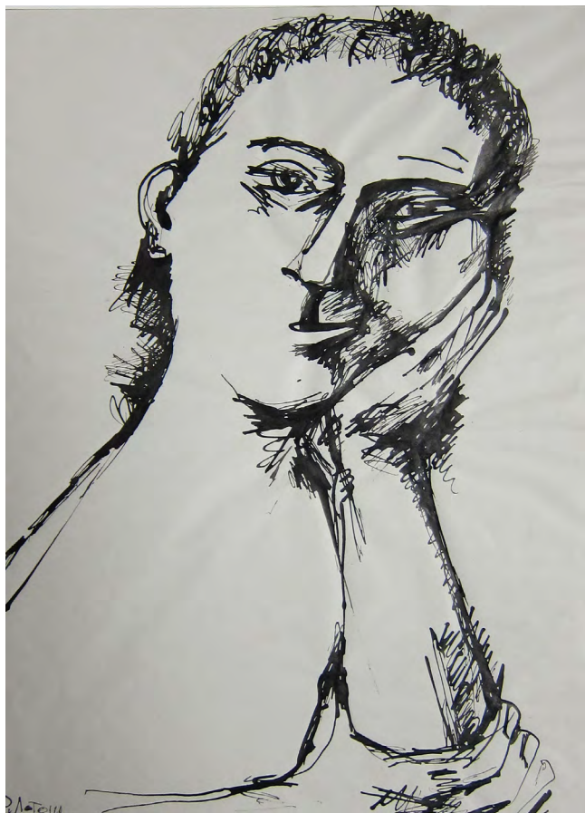
Илл. 3. Роберт Абрамович Лотош. Облокотившийся. 2000-е. Бумага, тушь, перо. Собственность автора

лизовать его реалистическими тенденциями; наоборот, выстраивая на нем свою пластику, мастер достигает большой степени условности и обобщения» [8, с. 87].