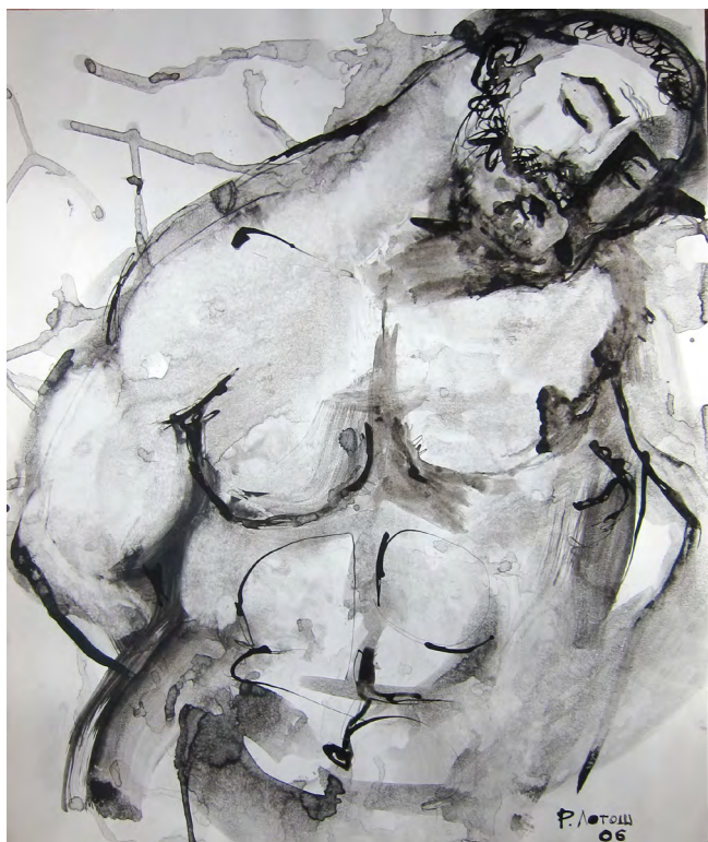
Илл. 1. Роберт Абрамович Лотош. Геракл. 2006. Бумага мелованная, тушь. Частная коллекция

венного музея; пополнили собрания современного искусства Центрального выставочного зала «Манеж» (Санкт-Петербург), Музея «Царскосельская коллекция», а также Министерства культуры России и Союза художников России (Москва). Работы Лотоша находятся в частных собраниях России, Германии, Голландии, Дании, Израиля, США, Швеции, Финляндии, Франции и других стран [1, с. 461; 14, с. 394, 398, 403, 425].