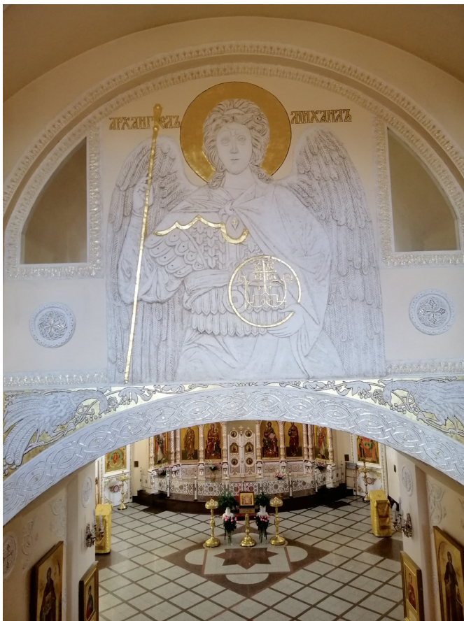
Илл. 4. М. А. Раздобурдин. Архангел Михаил. Рельеф в Соборе Архистратига Михаила. Клей, мраморная крошка.

основе композицию с плавными волютными «барочными» завершениями в верхней части. Сам иконостас является прекрасным архитектурным сооружением, на котором расставлены высокого живописного качества иконы в византийском стиле. В центре — уникальные Царские врата латунного литья, покрытого позолотой [5].