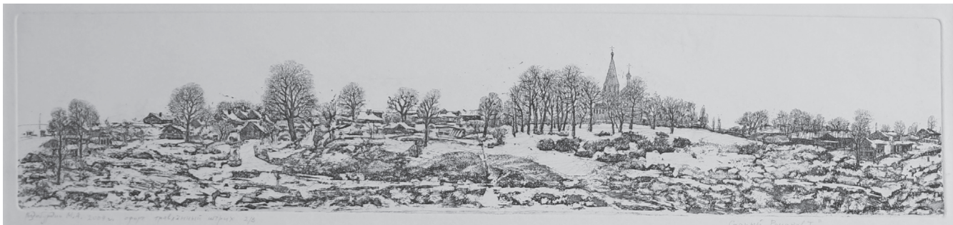
Илл. 5. М. А. Раздобурдин. Старый Романов. 2009. Бумага, офорт

М. А. Раздобурдиным, и они относят нашу память к раннехристианскому искусству, к его символике и эстетике. На