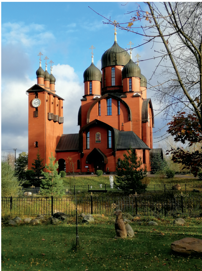
Илл. 1. Собор Архистратига Михаила и Всех Небесных Сил Бесплотных в Токсово. Архитектор В. Ф. Назаров. 1999–2004

Многочисленные эскизы монументальных храмовых росписей создают выпускники мастерской церковной и религиозной живописи под руководством профессора А. К. Крылова. Современное храмовое искусство изучается специалистами с разных точек зрения [1; 2; 3; 4; 6; 14; 17], однако пока нет обобщающего исследования, в котором были бы комплексно представлены все его проблемы.