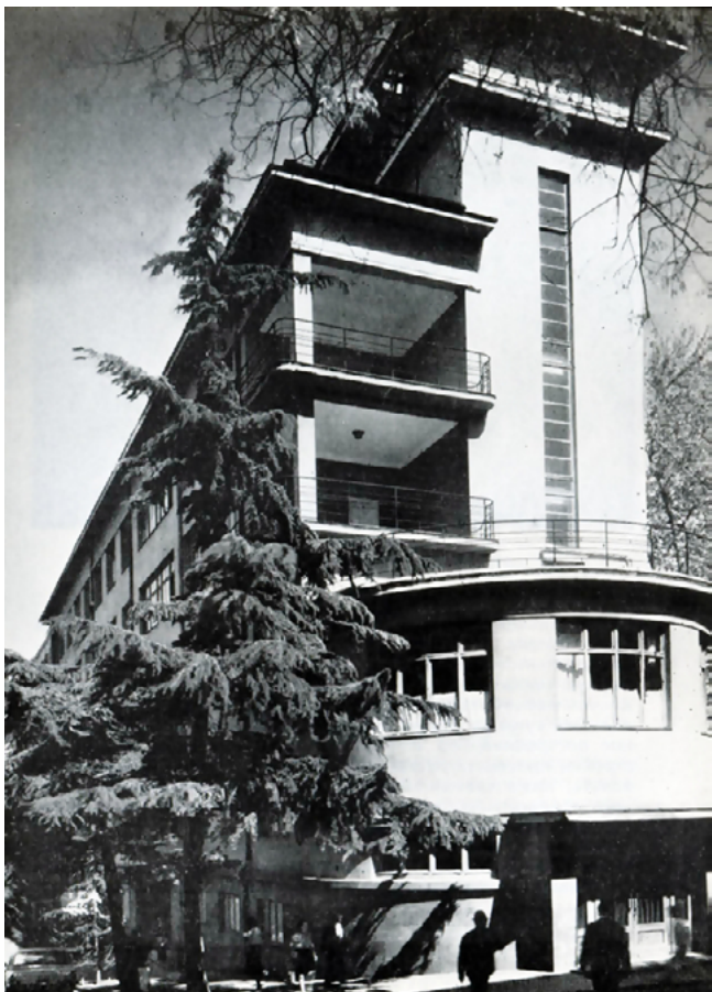
Илл. 2. Дом Заксовнаркома (впоследствии – здание ЦК КП Грузии). Арх. Н. Северов, М. Калашников. 1929–1930. Источник: https://pastvu.com/

академии художеств во ВХУТЕИН в 1930 г. — в 1927-м аналогичный по своей задумке процесс произошел в Москве, когда ВХУТЕМАС был реорганизован во ВХУТЕИН — и об образовании в 1930 г. грузинской ячейки ВОПРА и других пролетарских объединений — в 1929-м сообразные процессы произошли в Москве. Таким образом, подчинение грузинской культурной политики условному центру было оформлено уже к концу 1920-х гг. Эта систематическая последовательность центру будет характерной чертой всех культурных, социальных и политических тенденций грузинской республики.