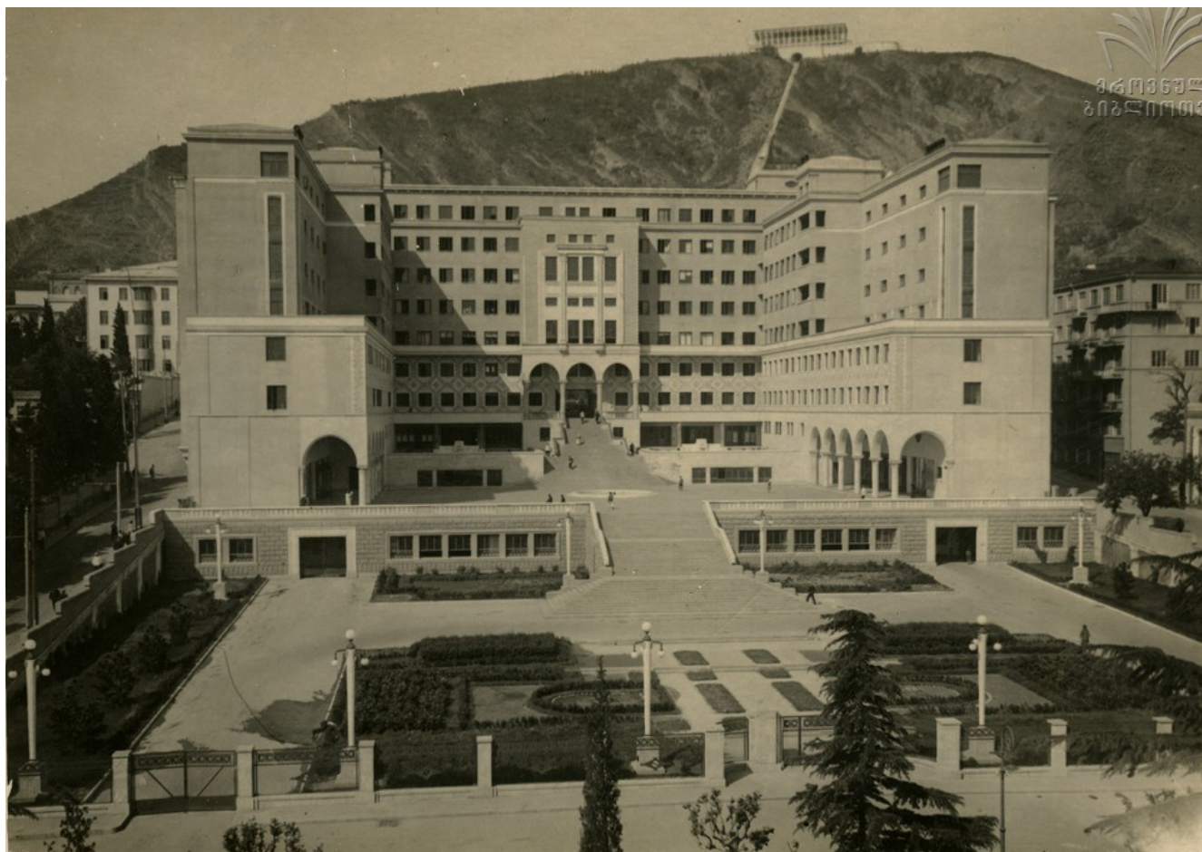
Илл. 4. Верхний корпус Дома Правительства Грузинской ССР. Арх. В. Кокорин, Г. Лежава. 1932–1938.