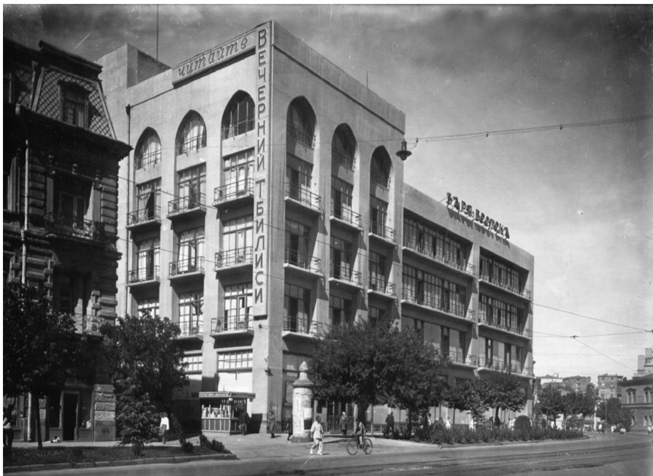
Илл. 1. Здание газеты «Заря Востока» в Тбилиси. Арх. Д. Числиев. 1929.

республиках. Однако именно на примере национальных республик можно наиболее подробно рассмотреть взаимоотношения между центром и регионами на архитектурном и градостроительном «поле» – предмет, весьма слабо изученный в советской архитектуре. Наконец, за рамками сегодняшних исследований постконструктивизма находится проблема формирования национальных стилей в советских республиках. Все это объясняет необходимость более детального изучения специфики постконструктивизма – его региональных особенностей. Так, период постконструктивизма в Грузии имеет несколько иные выражения и особенности, отличные от обще-советских тенденций, описанных А. Селивановой. Грузинский постконструктивизм, ставший результатом взаимовлияния партийных установок из Москвы и собственной архитектурной практики закавказского региона, получил к 1937 г. ряд специфических черт и приемов, позволяющих говорить о нем как об отдельном подстиле в рамках постконструктивизма.