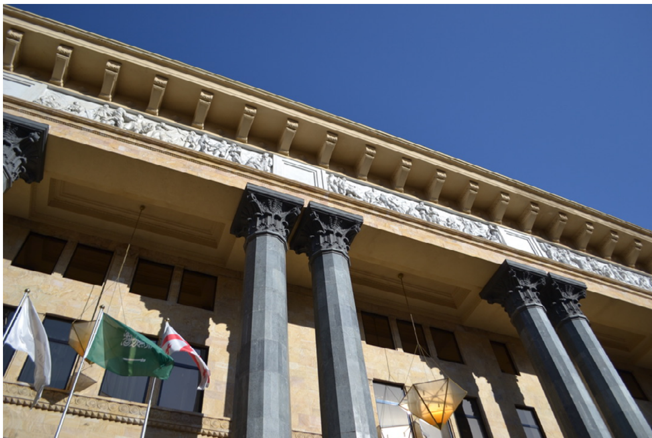
Илл. 3. Грузинский филиал ИМЭЛС в Тбилиси. Арх. А. Шустев. 1933–1938.

рирования национального вопроса в рамках освоения общепролетарской культурной практики: пролетарская и по содержанию, и по форме (о котором начали говорить ВОПРАВцы) [14].