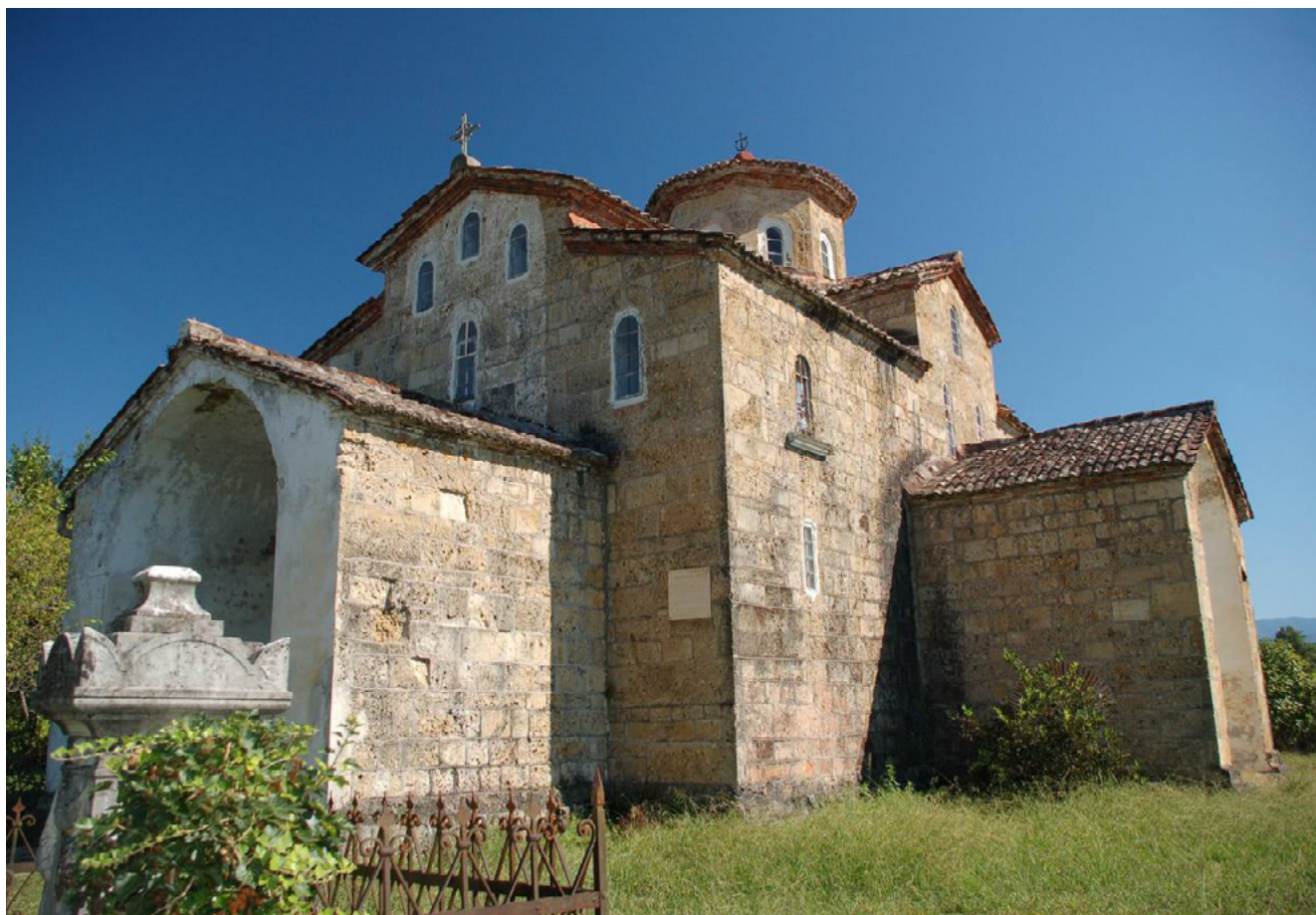
Илл. 4. Храм в Лыхнах в Абхазии. X–XI вв. URL: https://commons.wikimedia.org/wiki/Category:Orthodox_church_of_the_Dormition_in_Lykhny#/media/File:Lykhny_temple.jpg

ное место было отведено собору Святой Софии, а также были приведены чертежи храма Сергия и Вакха (527–536), церкви Святой Ирины (VIII в.), церкви Богородицы монастыря Липса (X–XIII вв.), и один лист был посвящен церквям Малой Азии. Необходимо также упомянуть вышедший несколько позднее альбом Ш. Тексье (1864) [25], где отдельные разделы посвящены архитектуре Фессалоники, Эдессы, Трапезунда. Все эти публикации были хорошо известны русским исследователям: они хранились в библиотеке князя Г. Г. Гагарина, на них ссылается во введении к своему труду Н. П. Кондаков [12, с. 3]. В целом альбомы с чертежами византийских храмов важны для настоящего исследования не только как показатель того, какие памятники были известны архитекторам и, в частности, Гримму, но и как свидетельство того, как эти памятники в тот период выглядели.