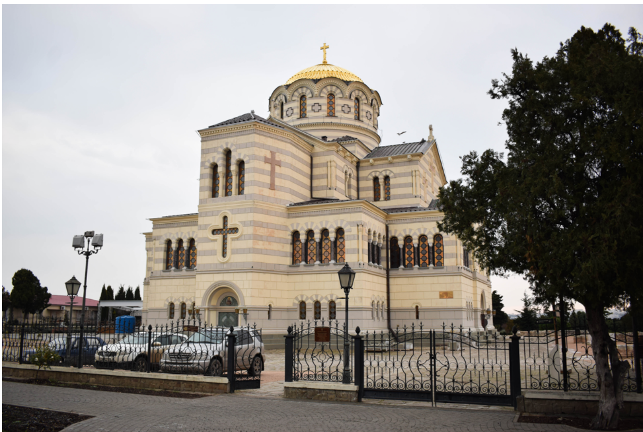
Илл. 1. Д. И. Гримм. Собор Владимира равноапостольного в Херсонесе. Проект 1859, построен в 1861–1879.

вопрос о конкретных источниках заимствования. В целом византийскому стилю в русской архитектуре посвящено несколько монографий: Ю. Р. Савельева [19] и Е. М. Кишкиновой [10], где достаточно подробно анализируются общие исторические и культурные предпосылки формирования стиля, его развитие и деление на этапы. Развитию отдельных приемов и их источникам также уделяется внимание в монографии Кишкиновой, но в рамках этого общего обзора стиля ускользают некоторые специальные детали. Уже проведенные исследования византийского стиля показывают, что особую роль в его развитии сыграл архитектор Д. И. Гримм, которому, однако, до сих пор не посвящено отдельной монографии, а несколько статей об архитекторе рассматривают лишь узкие сюжеты, не касающиеся этого направления. Между тем именно Гримм создал тот формальный репертуар, который потом использовался другими архитекторами как база, постепенно расширявшаяся и дополнявшаяся. В связи с этим анализ творчества архитектора, источника восприятия им византийских образцов представляется важнейшим для понимания византийского стиля как одного из направлений русского историзма.