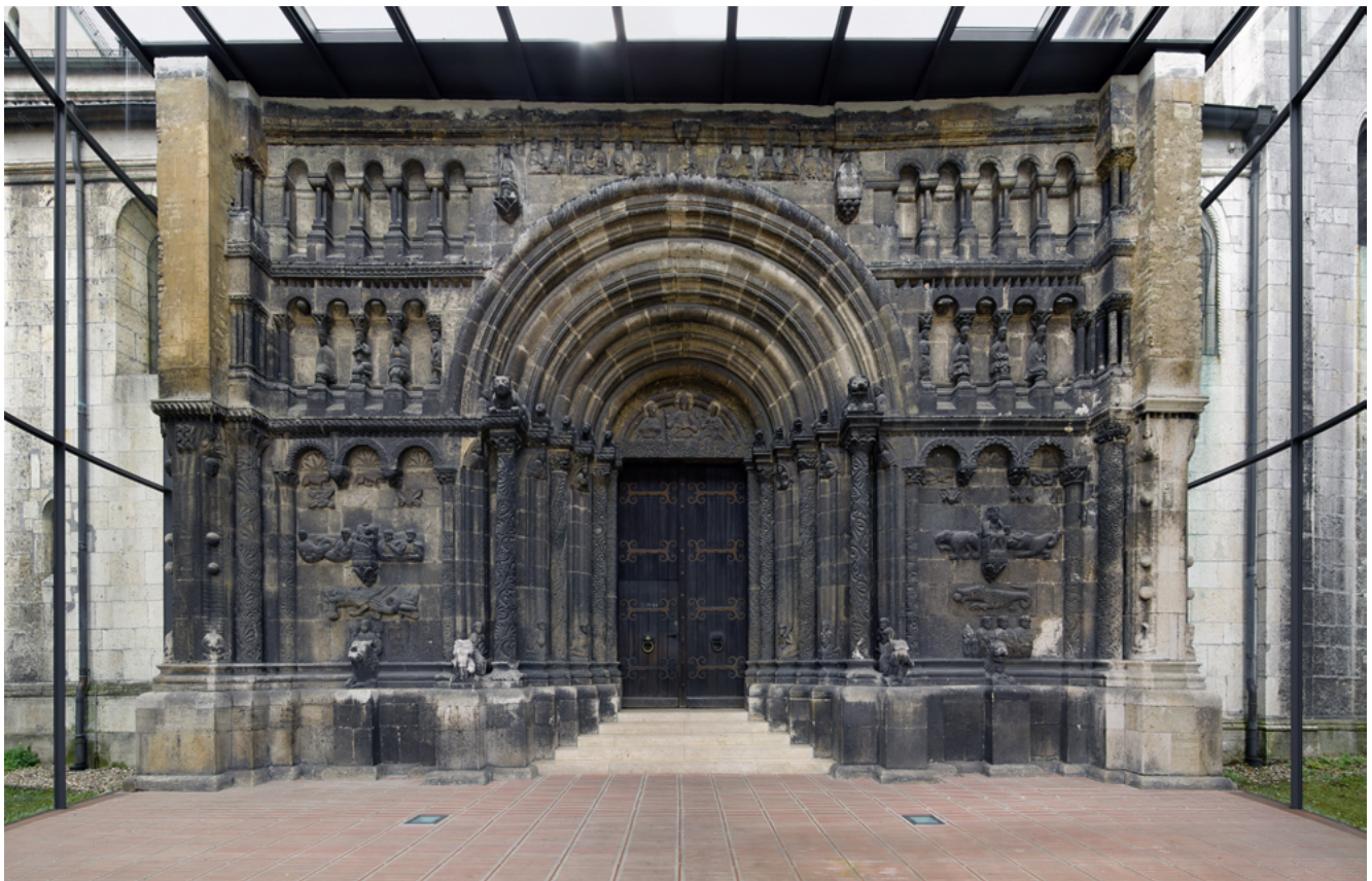
Илл. 6. Шотландский портал в церкви Святого Якоба и Святой Гертруды в Регенсбурге. 1180. URL: https://commons.wikimedia.org/wiki/File:Schottenportal_RB.jpg

Несмотря на то, что Д. И. Гримм спроектировал всего два крупных собора в византийском стиле, которые были реально построены, он оказал огромное влияние на других архитекторов и на развитие стиля, не только декларативно, но и на практике. Мотивы и приемы, использованные Гриммом, прочно вошли в словарь направления и сохранились на протяжении всего существования стиля.