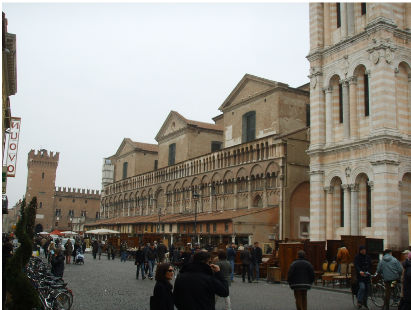
Илл. 5. Южная стена Феррарского собора (фасад XIII в.).

зован архитектором без ориентации на какие-либо средневековые образцы и основной функцией которого было уравновесить западную и восточную часть постройки (Илл. 2).