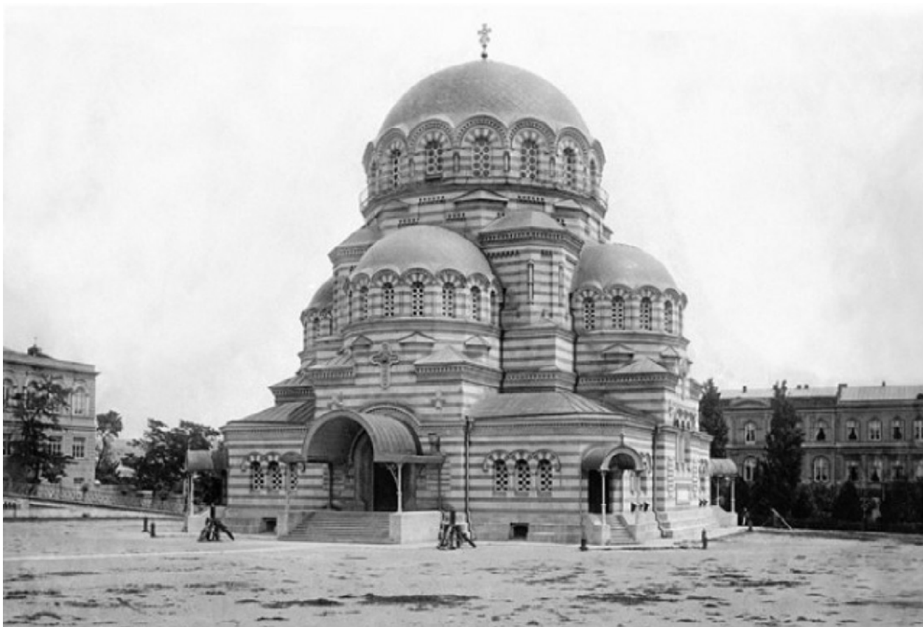
Илл. 7. Д. И. Grimm, Р. А. Гедике. Собор Александра Невского в Тифлисе. Проект 1865–1866, изменен в 1870, строительство в 1890-е, освящен в 1897. URL: http://humus.livejournal.com/2604783.html