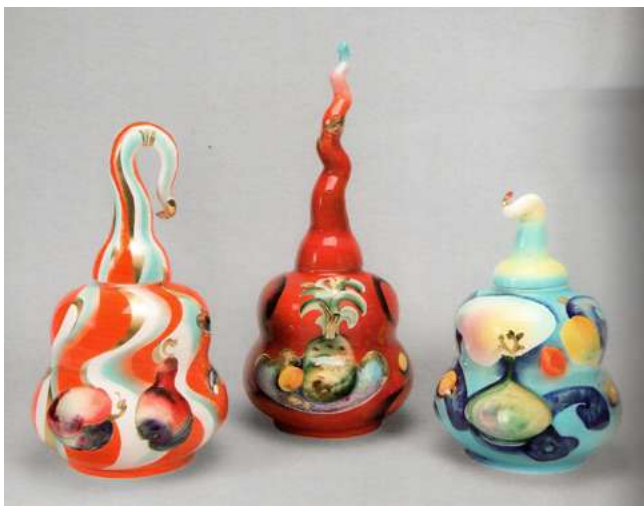
Илл. 8. Ваза «Озерная». 2011. Автор формы «Вектор» и росписи Н. Е. Троицкая. Фарфор; роспись подглазурная полихромная. АО «Императорский фарфоровый завод», Санкт-Петербург