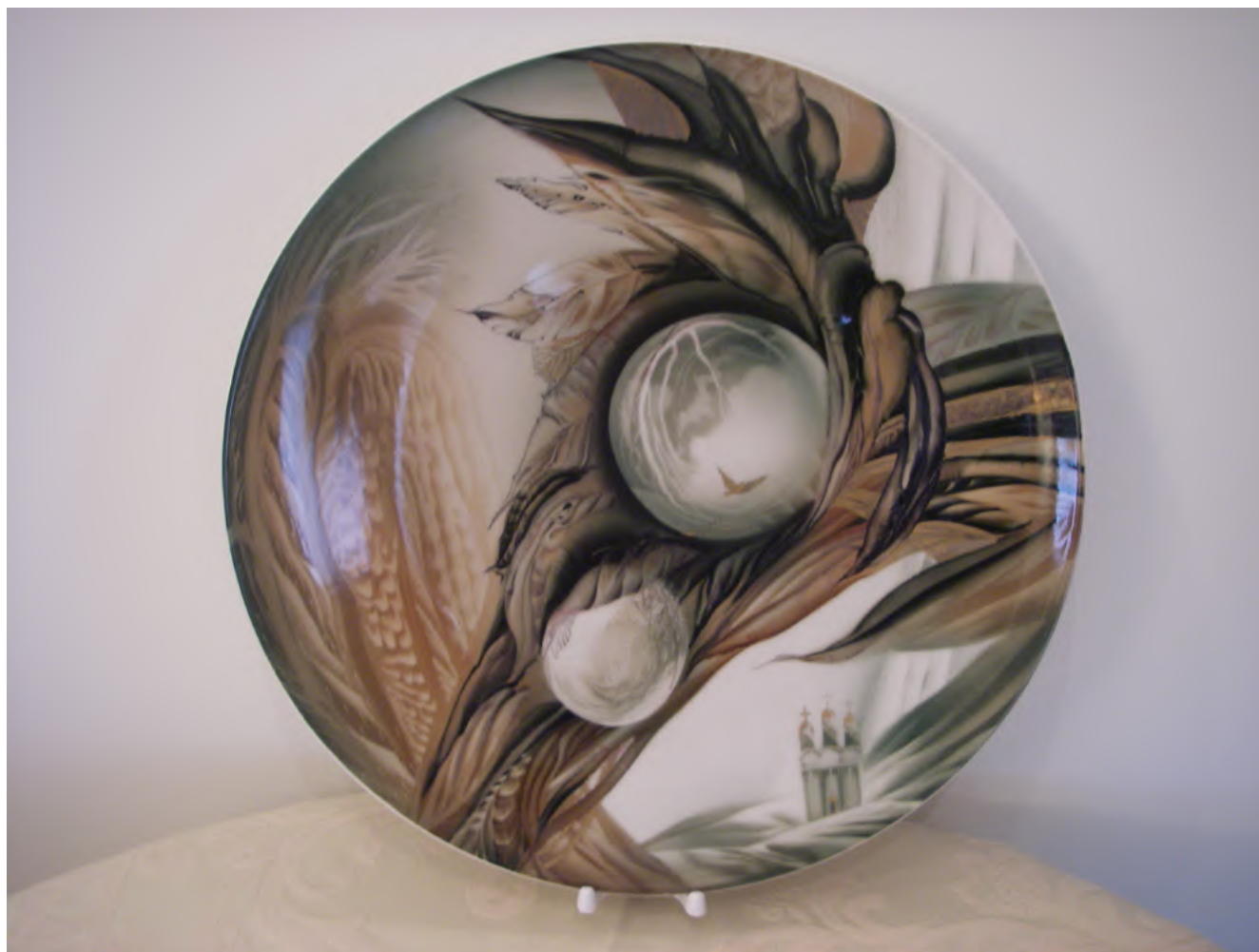
Илл. 7. Блюдо «Капля росы» из серии «Вода». 2001. Автор росписи Н. Е. Троицкая. Фарфор; роспись подглазурная полихромная, позолота. Коллекция В. И. Некрасова