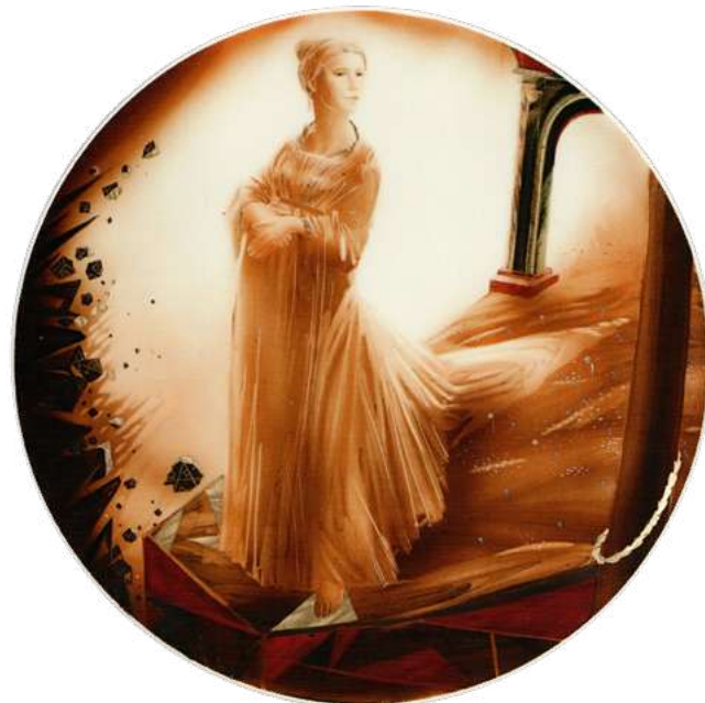
Илл. 6. Блюдо «Ослепительный миг». 2000. Автор росписи Н. Л. Петрова. Фарфор; роспись подглазурная полихромная, позолота, цирровка. Коллекция В. И. Некрасова