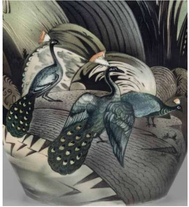
Илл. 1 - 1а. Ваза с изображением горного пейзажа с павлинами. 1928. Автор композиции Р. Ф. Вильде, исполнитель росписи А. Ф. Большаков. Фарфор; роспись подглазурная полихромная. Елагиностровский дворец-музей, Санкт-Петербург