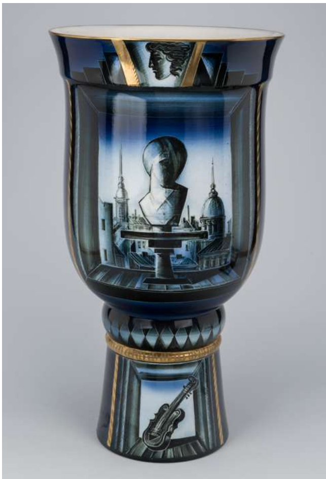
Илл. 4. Ваза «Творчество». 1984. Автор формы и росписи А. В. Ларионов. Фарфор; роспись подглазурная полихромная, позолота, цирювка.