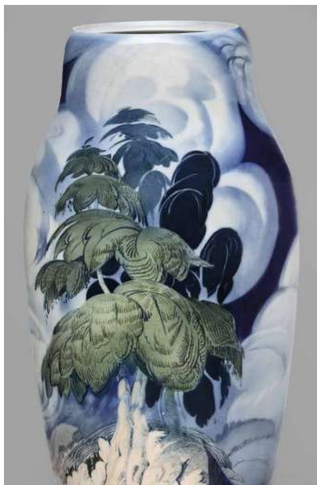
Илл. 2 - 2а. Ваза «У озера». 1928. Автор композиции Р. Ф. Вильде, исполнитель росписи А. Ф. Большаков. Фарфор; роспись подглазурная полихромная. © Государственный Эрмитаж, Санкт-Петербург, 2021. Фотограф Д. В. Сироткин

новая эстетика, раскрывающая красоту художественного материала и природных форм, появилось стремление к достижению целостности произведения, его уникальному звучанию. Мастера Дании сумели обогатить художественный язык фарфора, подарив росписи богатство светотеневых и световоздушных эффектов, «раскрыв пространство фарфора», при этом не разрушив, а наоборот, усилив ощущение органической связи керамического материала и росписи. Отныне с помощью подглазурной техники стало возможным создавать в фарфоре отдельный, замкнутый в самом себе мир, где есть пространство, воздух, свет, природа и природные формы, близкие реальным, где мягкие тональные переходы цвета, растворяясь в сияющей белизне фарфора, рожают иллюзорно объемный образ. В этой ускользающей гармонии «зазеркалья» содержалась своя поэзия и красота с той мерой условности и декоративности, которая была необходима для цельности произведения и которая в итоге служила художественным средством образно-символической интерпретации мотива.