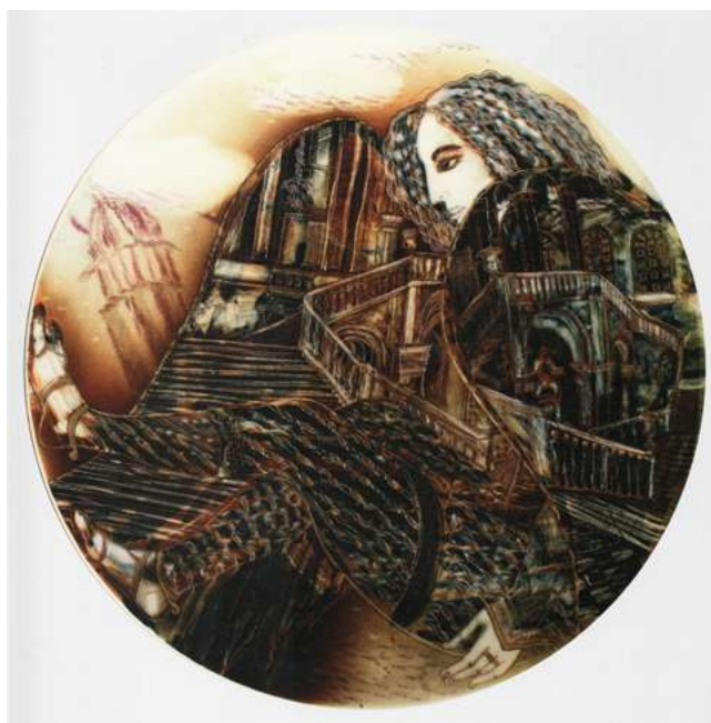
Илл. 14. Блюдо «Ангел. Лестница Эрмитажа». 2002. Автор росписи Т. М. Чапургина. Фарфор; роспись подглазурная полихромная, роспись надглазурная полихромная. Музей авторского фарфора и шахмат, Санкт-Петербург