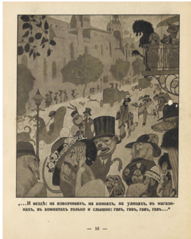
Илл. 5. Сборник «Жар-птица» (СПб.: Шиповник, [1911–1912]). С. В. Чехонин. Иллюстрация к произведению К. Чуковского «Собачье царство»