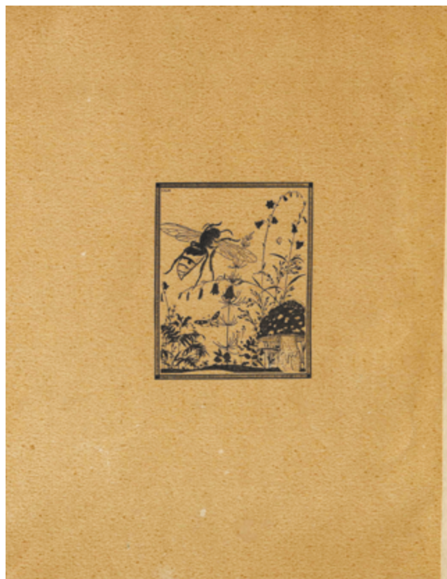
Илл. 10. Сборник «Жар-птица» (СПб.: Шиповник, [1911–1912]). А. А. Радаков. Иллюстрация к произведению Вл. Азова «Который лопнул»

Перед авторами сборника стояла сложная задача — создание единого художественного облика книги-сборника груп-