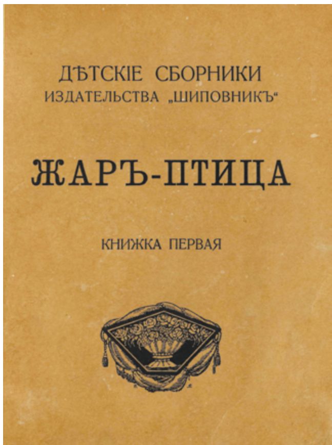
Илл. 2. Сборник «Жар-птица» (СПб.: Шиповник, [1911–1912]). Титульный лист

стительным мотивом или авторский рисунок в ромбе символического толка с инициалами «В. Б.» (Илл. 2). Титульный лист построен на основе классической центрической композиции, но выглядит новым и современным. Он строг, гармонично выдержаны разные интервалы между строками. При наборе были использованы несколько кеглей, три типа начертания одной гарнитуры. Подобную верстку можно было нечасто встретить в детской книге начала XX в.