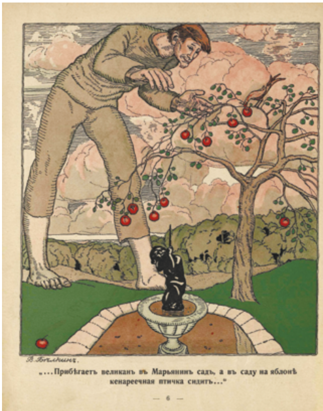
Илл. 4. Сборник «Жар-птица» (СПб.: Шиповник, [1911–1912]). В. П. Белкин. Иллюстрация к произведению А. Н. Толстого «Жар-птица»