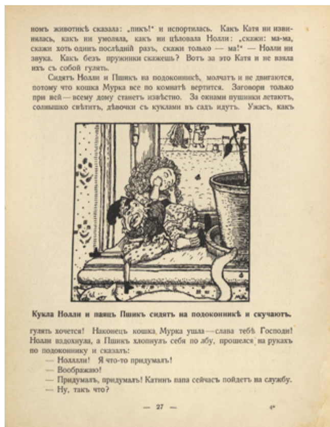
Илл. 6. Сборник «Жар-птица» (СПб.: Шиповник, [1911–1912]). М. В. Добужинский. Иллюстрация к стихотворению С. Черного «Нолли и Пшик»