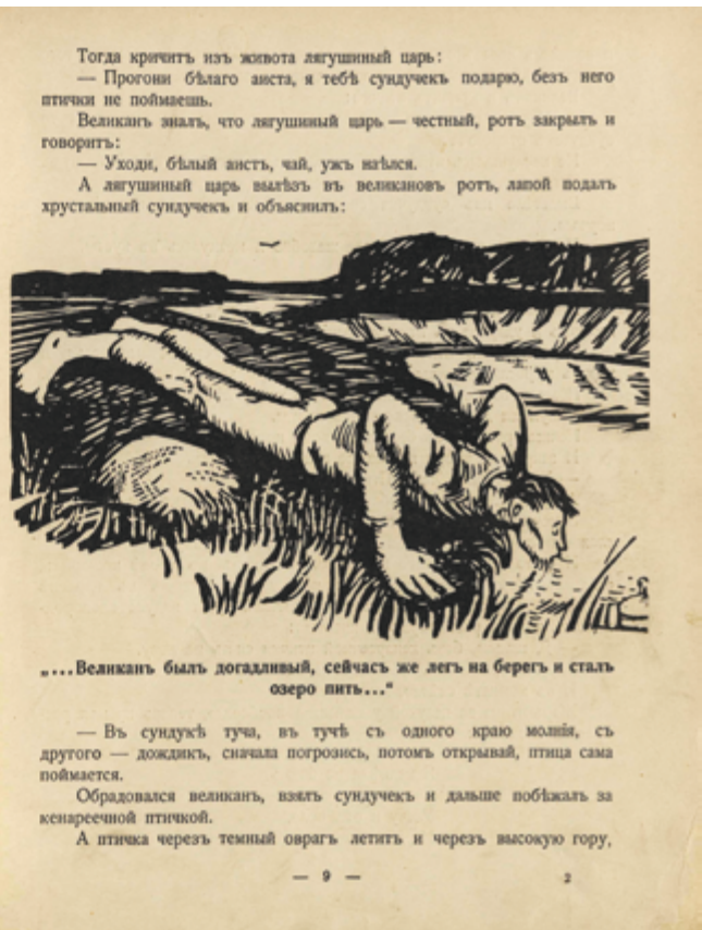
Илл. 3. Сборник «Жар-птица» (СПб.: Шиповник, [1911–1912]). В. П. Белкин. Иллюстрации к произведению А. Н. Толстого «Жар-птица». Разворот