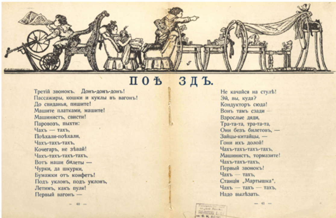
Илл. 8. Сборник «Жар-птица» (СПб.: Шиповник, [1911–1912]). М. В. Добужинский. Иллюстрация к стихотворению С. Черного «Нолли и Пшик». Концовка