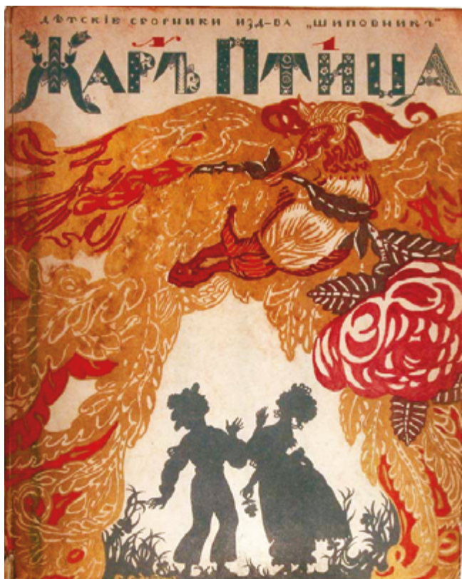
Илл. 1. Сборник «Жар-птица» (СПб.: Шиповник, [1911–1912]). Иллюстрированный переплет. Художник С. Ю. Судейкин. Хромофотография