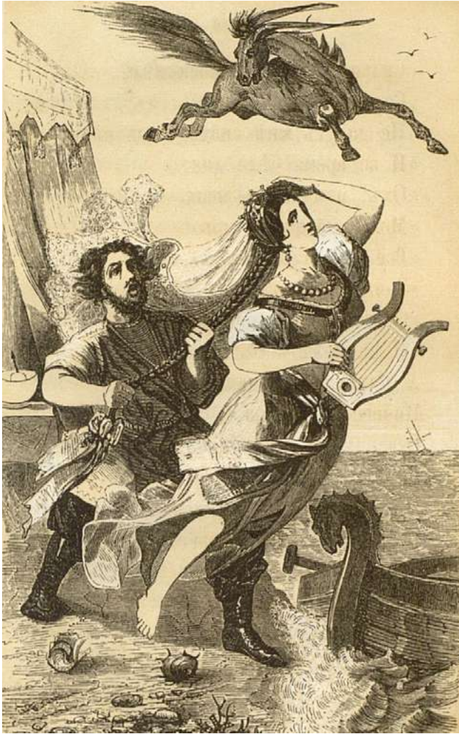
Илл. 1. Ершов П. П. Конек-Горбунук. Художники Л. А. Серяков, Р. К. Жуковский. СПб.: Изд-во Якова Трея, 1856