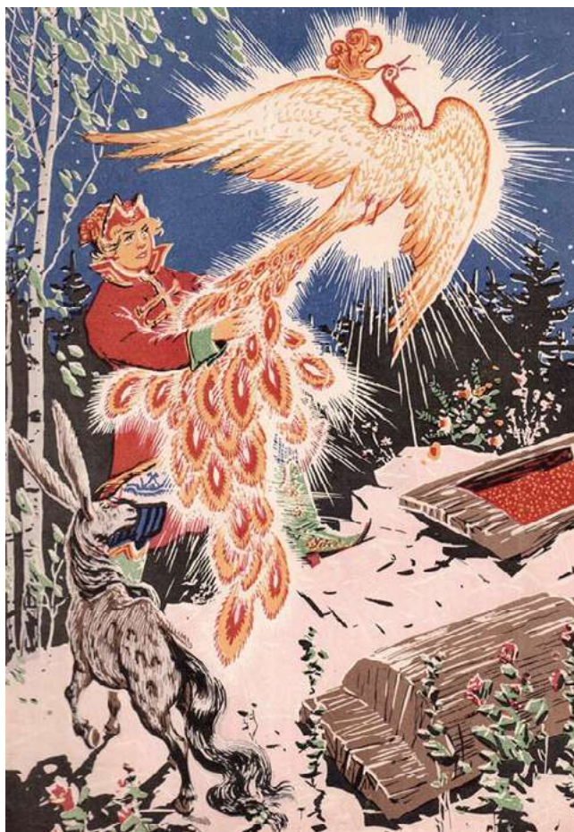
Илл. 5. Ершов П. П. Конек-Горбунок. Художник Н. А. Ращектаев. М.: Калужское КИ, 1958

Художник-плакатист, а также один из ярких представителей «золотого века» детской иллюстрации Н. М. Кочергин в 1961 г. (Илл. 6) оформил сказку «Иван-царевич и серый волк». Его работы выделялись оригинальным прочтением знаменитой сказки. Яркие, праздничные, исторически достоверные — все эти качества определяли характер иллюстраций мастера. Для точности передачи характера и настроения стародавних времен художник долго изучал историю, костюмы, традиции и обычаи. В своих иллюстрациях он словно реконструировал атмосферу Древней Руси, отображая целый пласт русской культуры, на-