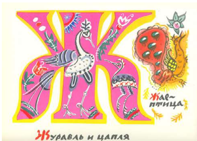
Илл. 7. Маврина Т. А. Сказочная азбука. М.: Гознак, 1969

чиная от традиционных костюмов и заканчивая убедительными изображениями архитектуры. В образах Жар-птицы вновь прослеживается сходство с билибинскими композициями, и даже сюжет в них повторяется. Однако у героев совершенно разные характеры. Если билибинский Иван-царевич ведет себя более отрешенно-благородно, то Иван-царевич Н. М. Кочергина — персонаж лучезарный, уверенный, целеустремленный, он до последнего момента не желает упускать волшебную птицу, являясь настоящим творцом своего счастья. Жар-птица изображена очень торжественно и ярко, плавными линиями, напоминающими языки пламени. Цвета иллюстраций чистые, максимально сочные, живописный ореол света вокруг птицы создает ощущение движения. Вся картина выполнена в золотисто-охристых тонах, подчеркивая волшебное сияние птицы.