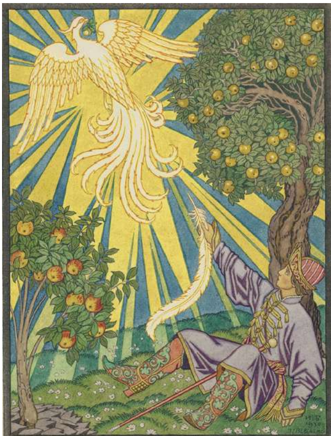
Илл. 3. Афанасьев А. Н. Сказка об Иване-царевиче, Жар-птице и сером волке. Художник И. Я. Билибин. СПб., 1930