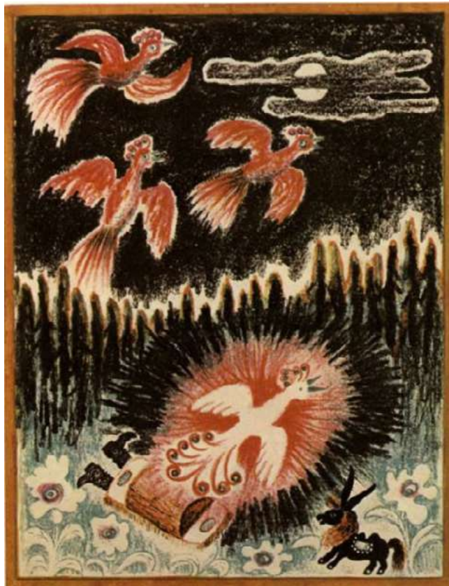
Илл. 4. Ершов П. П. Конек-Горбунук. Художник Ю. А. Васнецов. Л.: Дегиз, 1935

Первые иллюстрации к сказке А. Н. Афанасьева были выполнены в технике ксилографии, их создал художник М. С. Башилов, а ксилографическую резьбу исполнил К. Рихау, они были опубликованы в сборнике «Русские детские сказки» в двух частях в 1870 г. в Москве [1]. В работах обоих авторов отмечается схожесть в описании волшебной птицы: яркая, редкая, волшебная птица, чье перо принесет удачу и богатство, взлетая, озаряет небо светом, сияет и переливается разными огнями. Прототипом сказочной Жар-птицы в их образах стала реально существующая птица — павлин. Экзотическая, редкая птица с необыкновенным оперением и причудливым окрасом вдохновляла художников на создание законченного образа волшебной птицы.