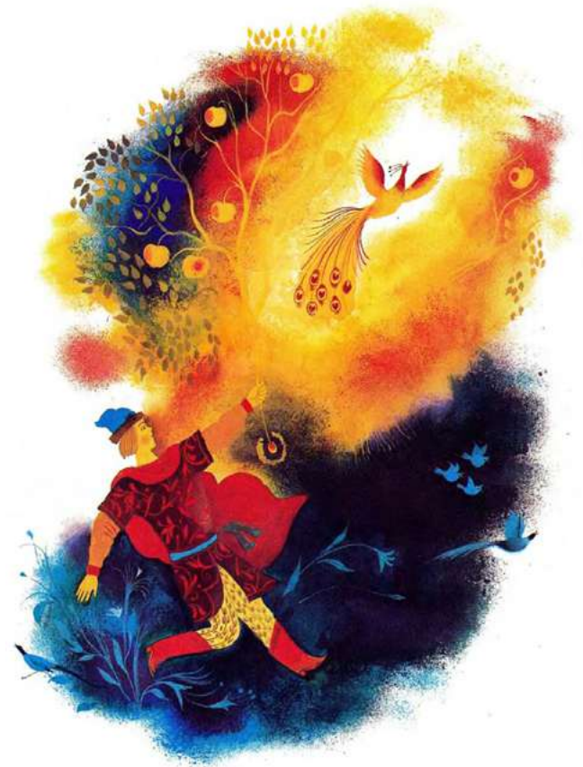
Илл. 8. Афанасьев А. Н. Сказка об Иване-царевиче, Жар-птице и сером волке. Художник П. И. Багин. СПб., 1978

чиная от традиционных костюмов и заканчивая убедительными изображениями архитектуры. В образах Жар-птицы вновь прослеживается сходство с билибинскими композициями, и даже сюжет в них повторяется. Однако у героев совершенно разные характеры. Если билибинский Иван-царевич ведет себя более отрешенно-благородно, то Иван-царевич Н. М. Кочергина — персонаж лучезарный, уверенный, целеустремленный, он до последнего момента не желает упускать волшебную птицу, являясь настоящим творцом своего счастья. Жар-птица изображена очень торжественно и ярко, плавными линиями, напоминающими языки пламени. Цвета иллюстраций чистые, максимально сочные, живописный ореол света вокруг птицы создает ощущение движения. Вся картина выполнена в золотисто-охристых тонах, подчеркивая волшебное сияние птицы.