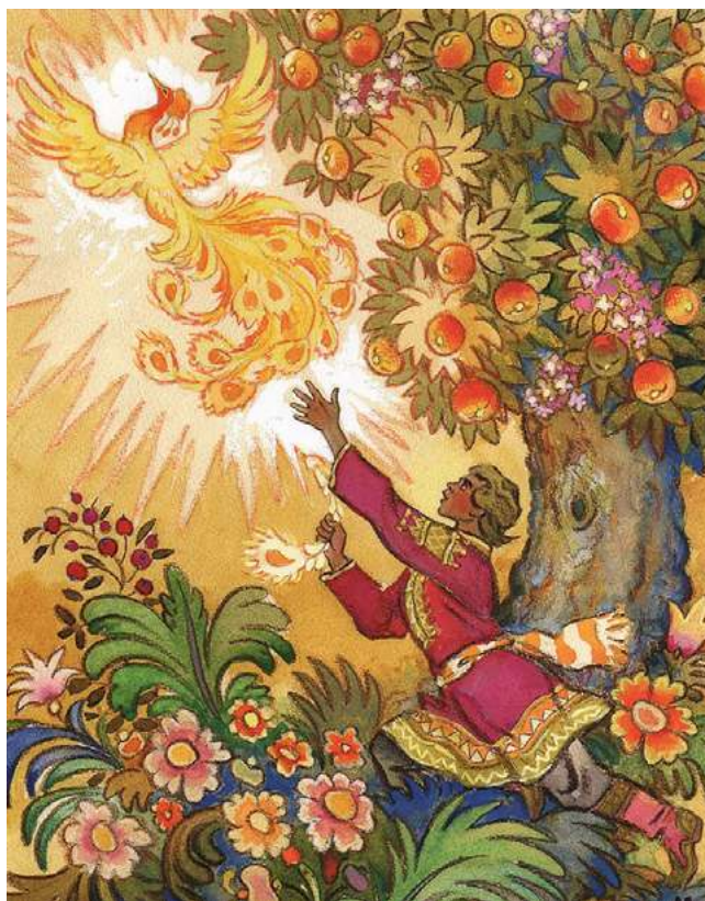
Илл. 6. Ершов П. П. Конек-Горбунок. Художник Н. М. Кочергин. Л.: Художник РСФСР, 1961