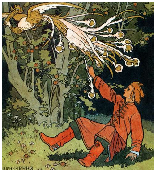
Илл. 2. Афанасьев А. Н. Сказка об Иване-царевиче, Жар-птице и сером волке. Художник И. Я. Билибин. СПб., 1899

Помимо народного творчества образ Жар-птицы присутствует в произведениях П. П. Ершова «Конек-горбунук» и А. Н. Афанасьева «Сказка об Иване-царевиче, Жар-птице и о сером волке». Непростой путь издания пережил «Конек-горбунук». Первое издание вышло в 1834 г., затем книга удачно переиздавалась несколько раз, последний раз в первой редакции сказка издавалась в 1843 г., после чего она была запрещена цензурой на тринадцать лет до 1856 г. (Илл. 1). Новое издание вышло уже с значительно переписанным и откорректированным текстом самого писателя.