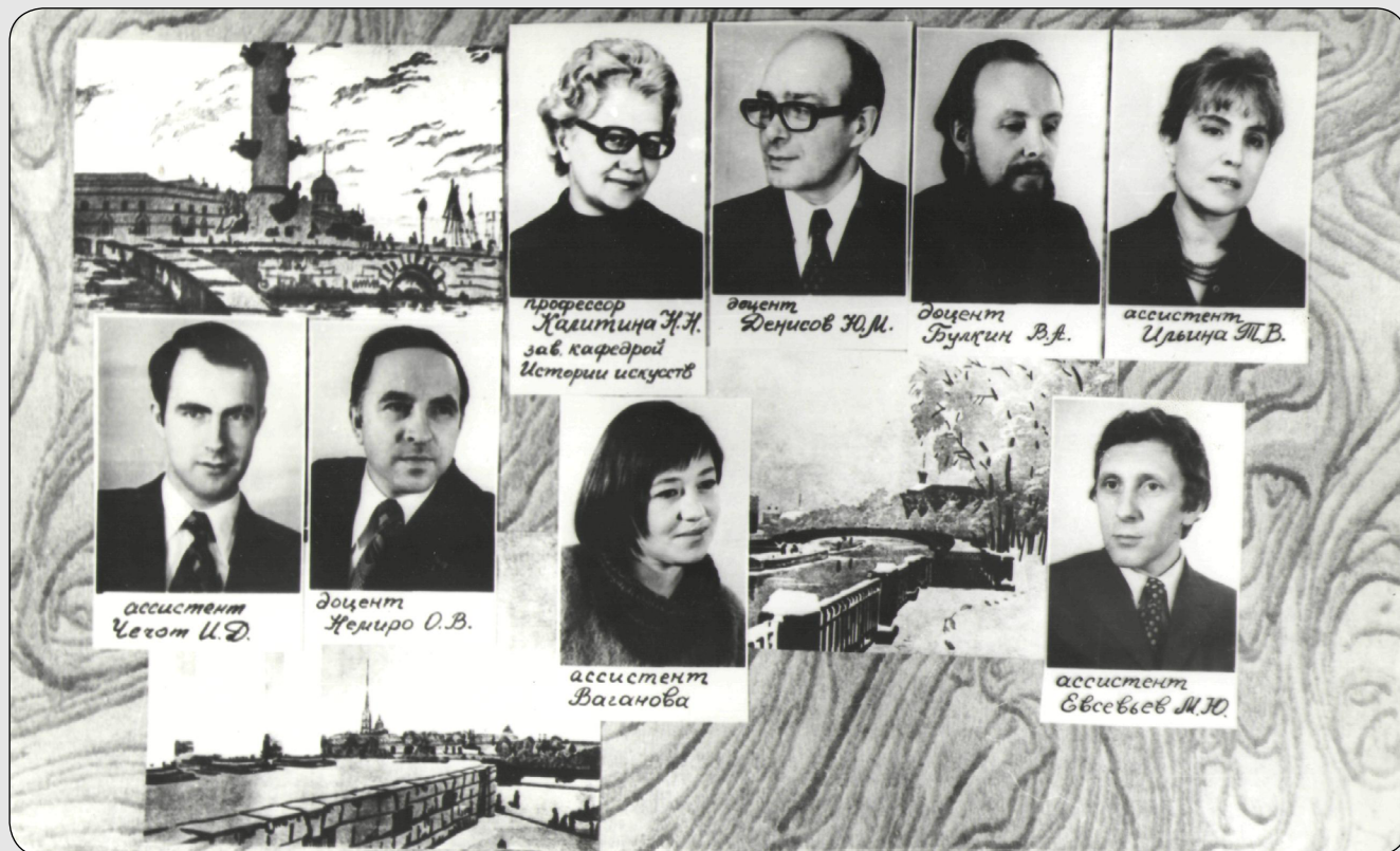
Илл. 19. Фотография с портретами преподавателей из выпускного альбома студентов-искусствоведов ок. 1976–1981 гг. выпуска