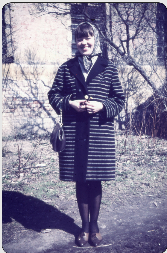
Илл. 8. Е. О. Ваганова, г. Пушкин. Весна 1968.