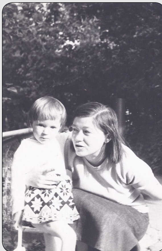
Илл. 16. Е. О. Ваганова с дочерью Машей. 1976–1977.