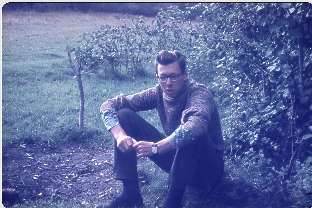
Илл. 7. Б. М. Кириков. Совхоз деревни Малышево. Начало студенческой жизни. Сентябрь 1966.