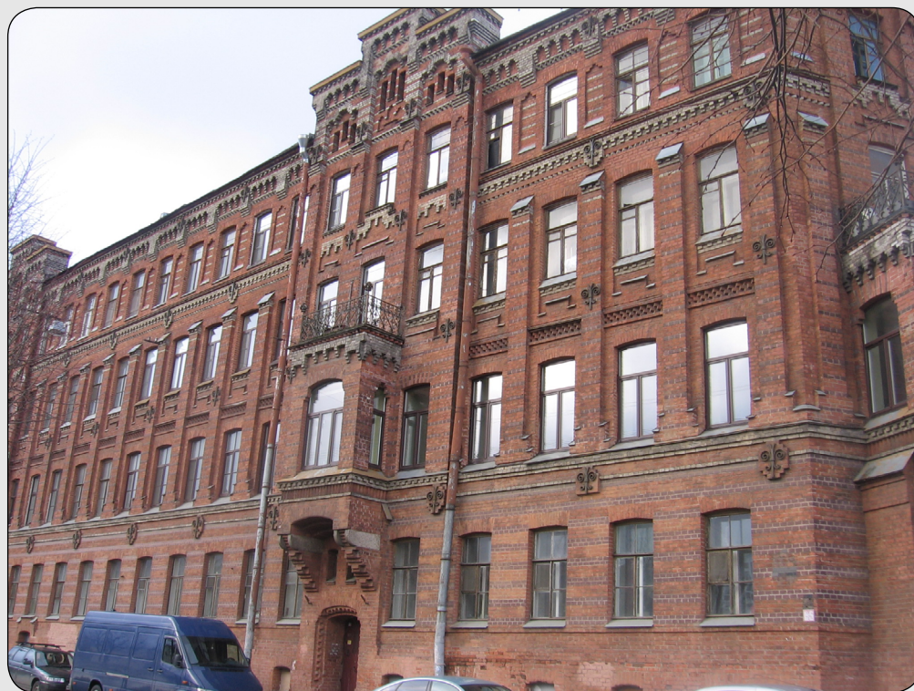
Илл. 14. Дом на наб. Фонтанки, вид со стороны набережной.