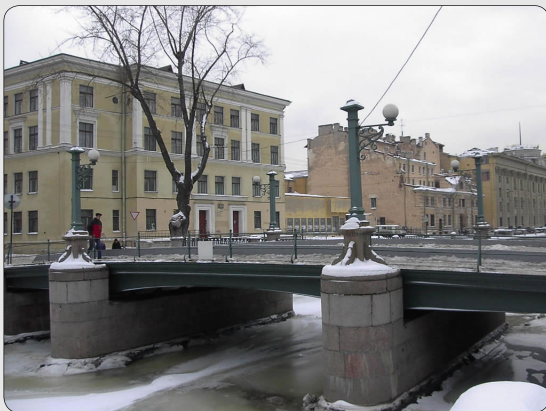
Илл. 3. Школа № 243 на ул. Союза Печатников, д. 1