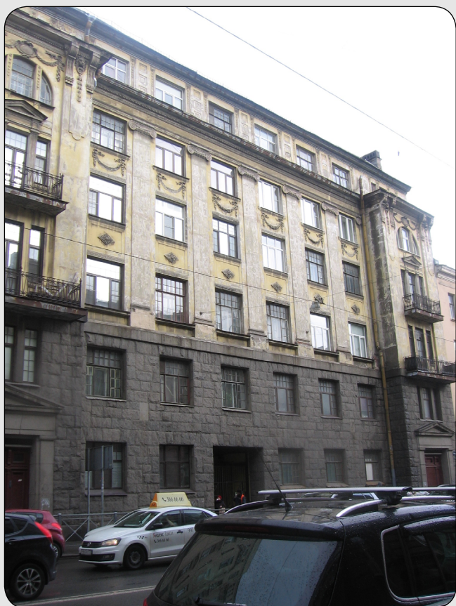
Илл. 2. Дом Е. О. Вагановой на Лермонтовском пр., 8а.