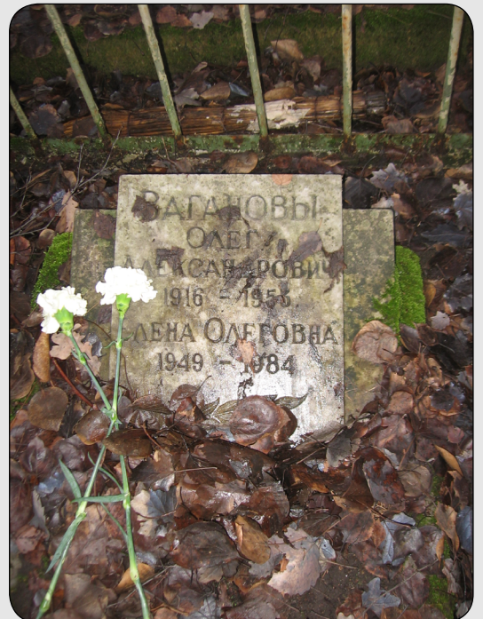
Илл. 23. Могила Вагановых Олега Александровича и Елены Олеговны на Серафимовском кладбище.