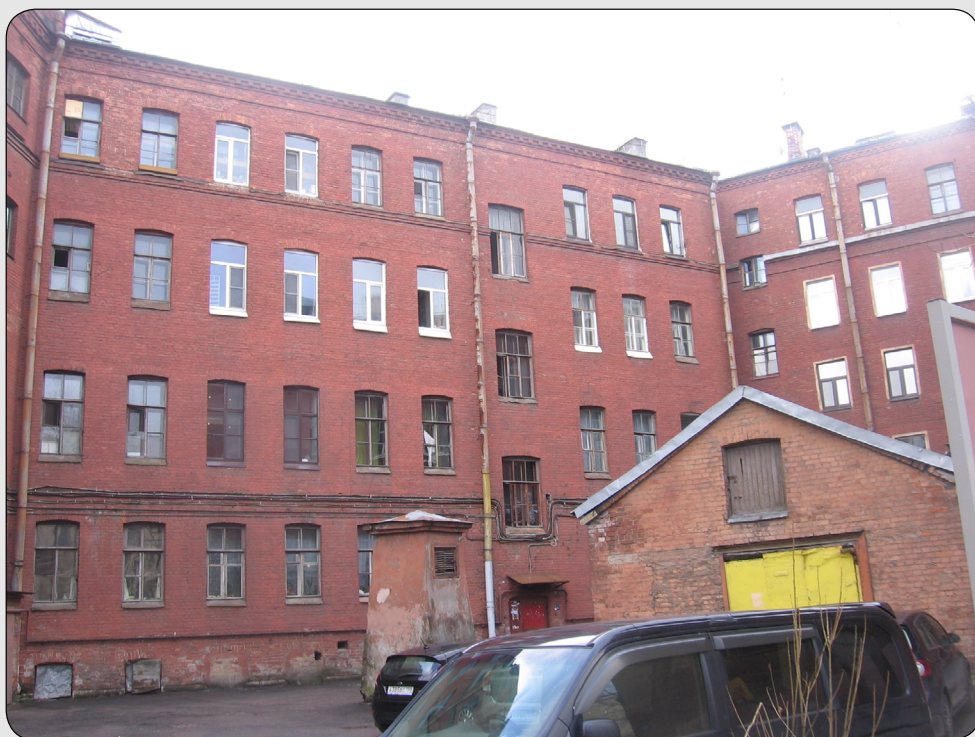
Илл. 13. Дом на наб. Фонтанки, в котором жила Е. О. Ваганова, двор. Фотография А. В. Морозовой.