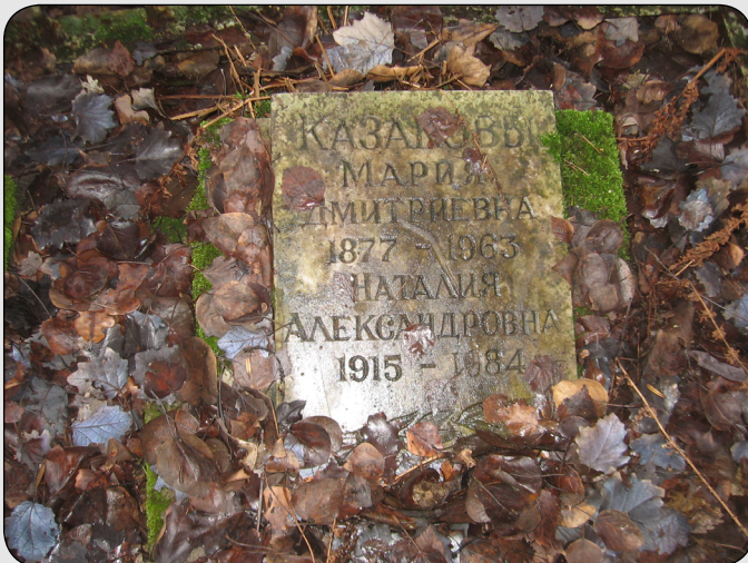
Илл. 22. Могила Казаковых Марии Дмитриевны и Наталии Александровны на Серафимовском кладбище.