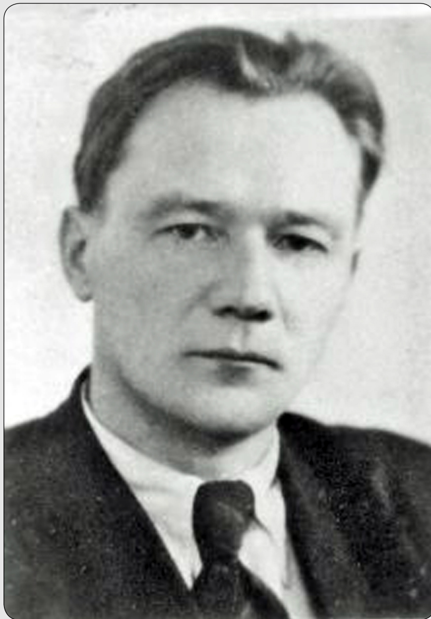
Илл. 1. О. А. Ваганов (1916–1953).