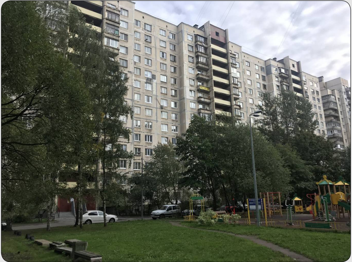
Илл. 21. Дом на ул. Композиторов, 1