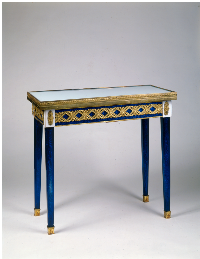
Илл. 1. Георг Кёниг. Столик из убранства Синего кабинета («Табакерка»). 1780-е. Сосна, смальта, бронза золоченая, литье; ткань.

Однако прошло немало столетий, прежде чем прозрачные виды материалов с их возможностями были освоены в достаточной степени для того, чтобы стать популярными для отделки интерьеров и мебели. История сохранила яркие примеры применения в XVIII в. стекла. Существовавшие тогда технологические сложности в преодолении его хрупкости превращали подобные проекты в редкие и дорогостоящие заказы. Наиболее подходящим техническим способом применения этого материала в мебели стала инкрустация относительно небольшими декоративными стеклянными элементами. Однако подобных памятников сохранилось крайне мало. Один из них — кресло середины XVIII в., изготовленное из резного золоченого дерева со вставками из синего стекла — находится в музее стекла в Мурано. Данное изделие приписывается Джузеппе Бриати (Giuseppe Briati, 1686–1772), который активно применял цветное стекло в изготовлении мебели — шкафов, стульев, кресел, комодов и бюро [10, р. 36–37]. Небольшие зеркальные вставки имеются и на венецианском шкафе-бюро второй четверти XVIII в. из коллекции Эрмитажа [7, с. 159, № 158]. Данная статья посвящена атрибуции на основе архивных документов и введению в научный оборот редкого памятника художественной мебели из коллекции Екатерины II.