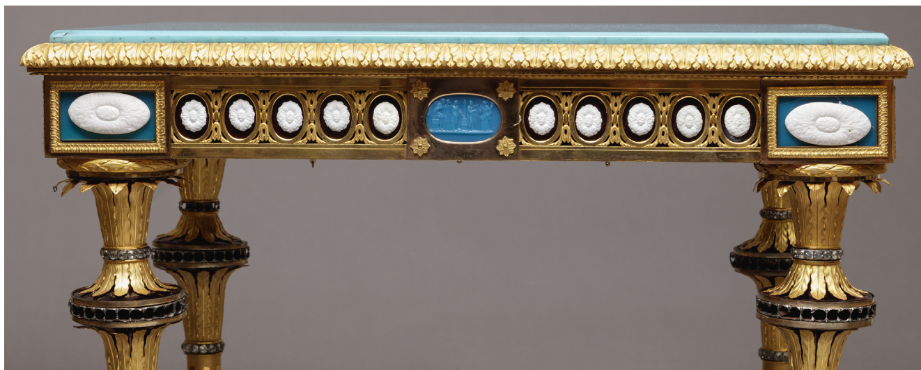
Илл. 3. Георг Кёниг. Столик из сокровищницы Екатерины II. 1793. Дуб, бук, сталь, медь, смальта, хрусталь, бронза золоченая.