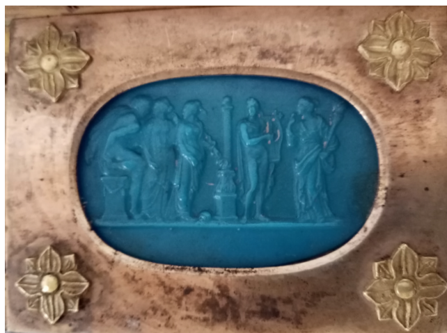
Илл. 4. Смальтовая плакетка в виде камеи. Элемент декора столика из сокровищницы Екатерины II

В перечислении декоративных элементов столика, упомянутых А. Фелькерзамом, также отсутствует упоминание о подвесках. Досадные утраты этих выразительных и редко