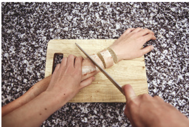
Анхела Бурон. Кусок хлеба. 2015