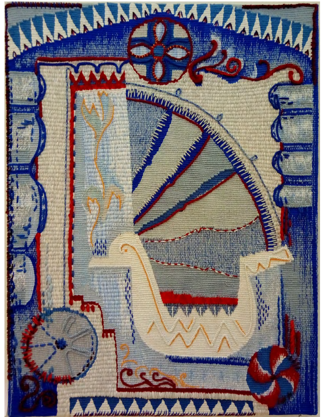
Илл. 8. Е. В. Рожкова. Русский натюрморт. 2015. Шерсть, вискоза, хлопок, ручное ткачество. Собственность автора