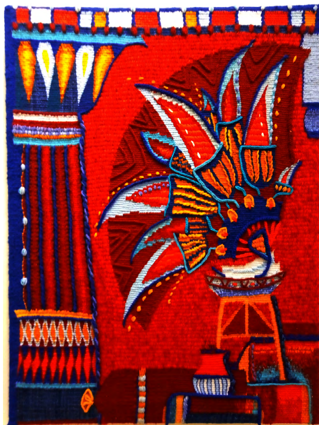
Илл. 6. Е. В. Рожкова. Египетский натюрморт. 2015. Шерсть, вискоза, хлопок, ручное ткачество. Собственность автора

ческими композициями. Бакст создавал костюмы, усиливающие выразительность тела танцовщика, дополняя их аксессуарами или сложными орнаментами. Эскизы костюмов, разработанные Леоном Бакстом, представляют собой удивительные динамичные композиции, в которых движение фигуры продолжается элементом костюма, орнаментальный декор то прячет, то выявляет красоту человеческого тела. При этом художник создаёт совершенно реалистичное изображение, соответствующее образам эпохи модерна, выявляя наиболее характерные и выразительные черты, присущие определённому персонажу. А ткани выполнены с такой лёгкостью и одновременно — тщательно, что можно не просто рассмотреть декор, но и повторить его (Илл. 2). Компоновка динамичной фигуры в листе — это, пожалуй, одна из сложнейших задач для студентов, разрабатывающих эскизы фигуративных композиций. Особенно если мы говорим о заданиях по дисциплинам в области декоративного искусства, где необходимо сохранить условность изображения фигуры и пространства. Опираясь на иллюстративный ряд, собранный из эскизов Бакста, можно ясно и доступно объяснить задание студентам. Символизм художественных образов, определённая стилистика и реалистичный метод рисования Бенуа и Бакста в наше время воссоздаются многими профессиональными художниками, в основном — иллюстраторами.