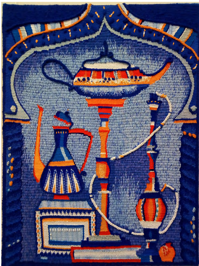
Илл. 5. Е. В. Рожкова. Восточный натюрморт. 2015. Шерсть, вискоза, хлопок, ручное ткачество. Собственность автора