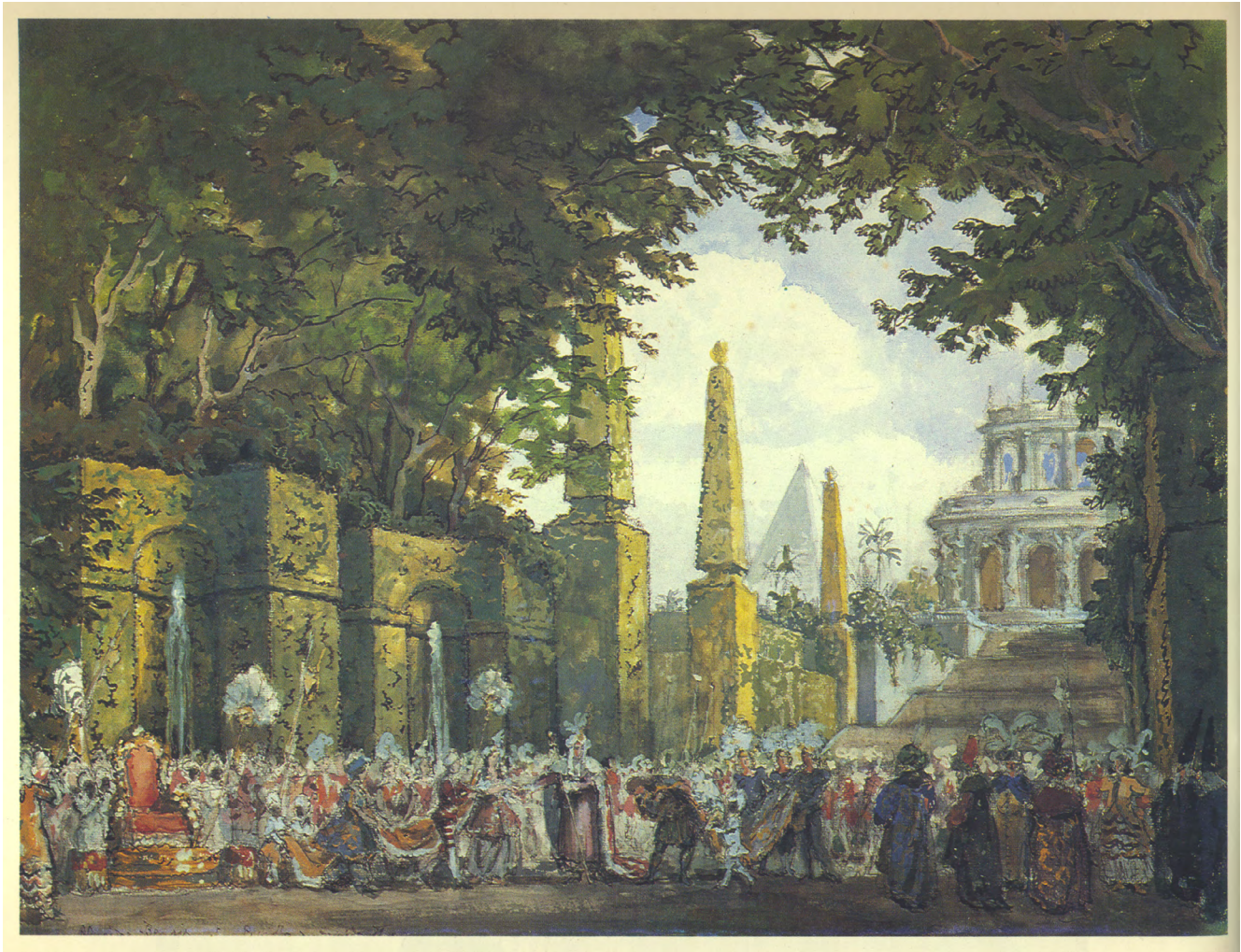
Илл. 1. А. Н. Бенуа. Эскиз декорации к балету «Павильон Армии». 1907. Бумага, акварель, тушь, карандаш, гуашь. Из собрания Никиты и Нины Лобановых-Ростовских. Санкт-Петербургский государственный музей театрального и музыкального искусства. Опубликовано в: Боулт Дж. Художники русского театра 1880–1930. Собрание Никиты и Нины Лобановых-Ростовских. М., 1991

оформлении балетов обрела новые качества контрастности, смелости композиционных и технических приёмов. Образно-драматургические решения, подчас шокирующие зрителя, как в первом показе «Весны священной» [12], сегодня воспринимаются традиционными, даже азбучными для молодых художников театра.