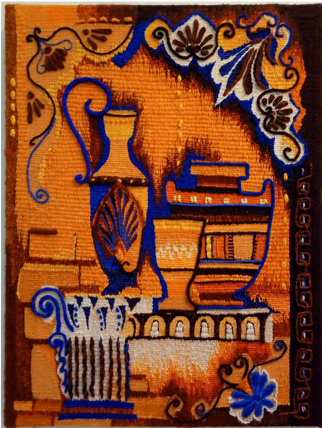
Илл. 7. Е. В. Рожкова. Греческий натюрморт. 2015. Шерсть, вискоза, хлопок, ручное ткачество. Собственность автора

Знакомство с театрально-декорационным наследием в контексте образовательного процесса предполагает творческую